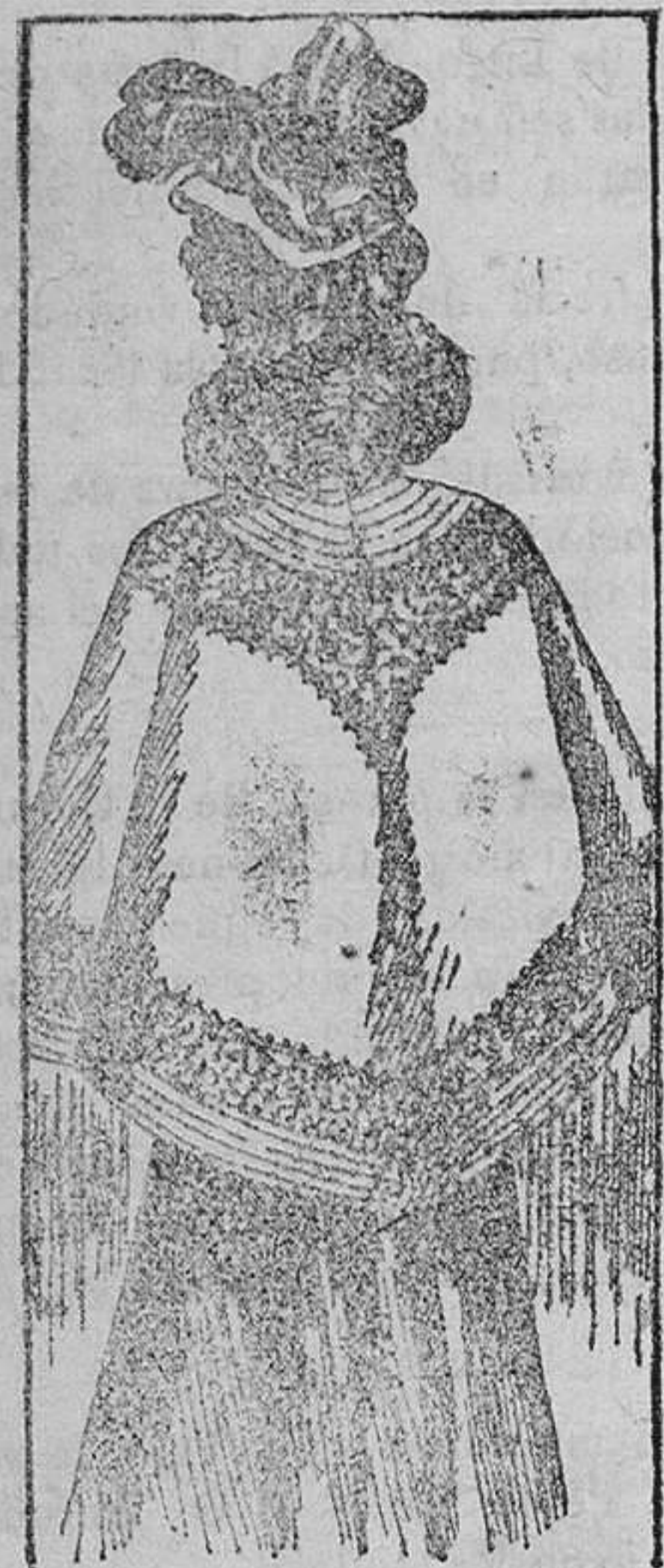
Esclavina para paseo.

La esclavina que nuestro dibujo representa se confecciona con pañete, basándose en el bordado que la adorna toda la elegancia de esta prenda. Forma este bordado dos anchas cenefas, una a la altura de los hombros y la otra por encima de los pespunte que rodean el borde. También lleva respuntado el cuello, que es de los llamados Montañés y parte de la espalda hasta el primer bordado.