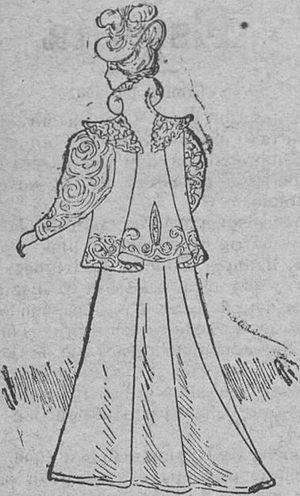
Traje para calle.

Es de terciopelo negro; delantero y cuello bordado, de una pieza: la espalda forma una tabla que parte de debajo del cuello; y la manga bordada igual que el resto de la chaqueta. Falda, forma de campana, con tres tablas por detrás.