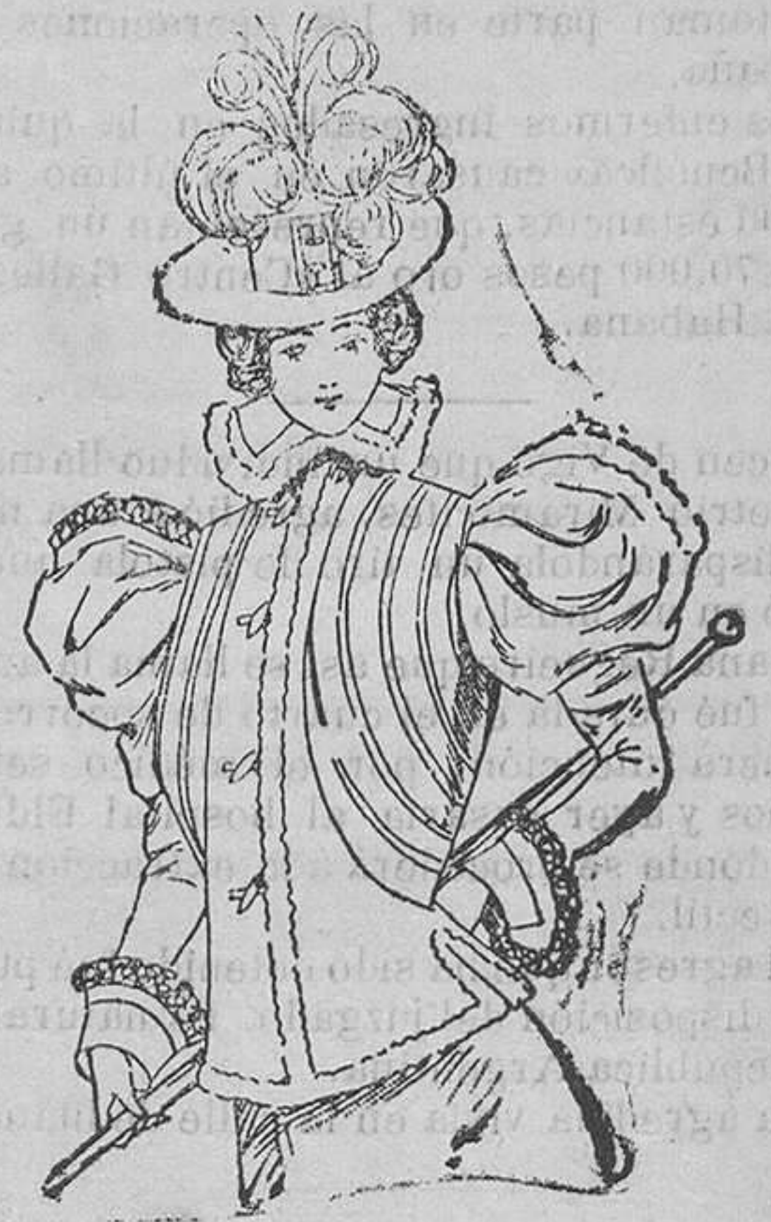
Chaqueta de pañeto

La espalda de esta elegante chaqueta es floja, con tres canalones que parten del cuello, sien lo este alto y ovalado, con borde del adorno. El delantero va flojo y abrocha lo por botones de acero, llevando estos una tirilla de astrakan, igual a la que rodea la chaqueta y las mangas al biés, con carterá y borde. Encima de esta chaqueta, que, como se ve en el grabado, va algo abierta por los lados, se coloca una torera de terciopelo con tiras de paño.