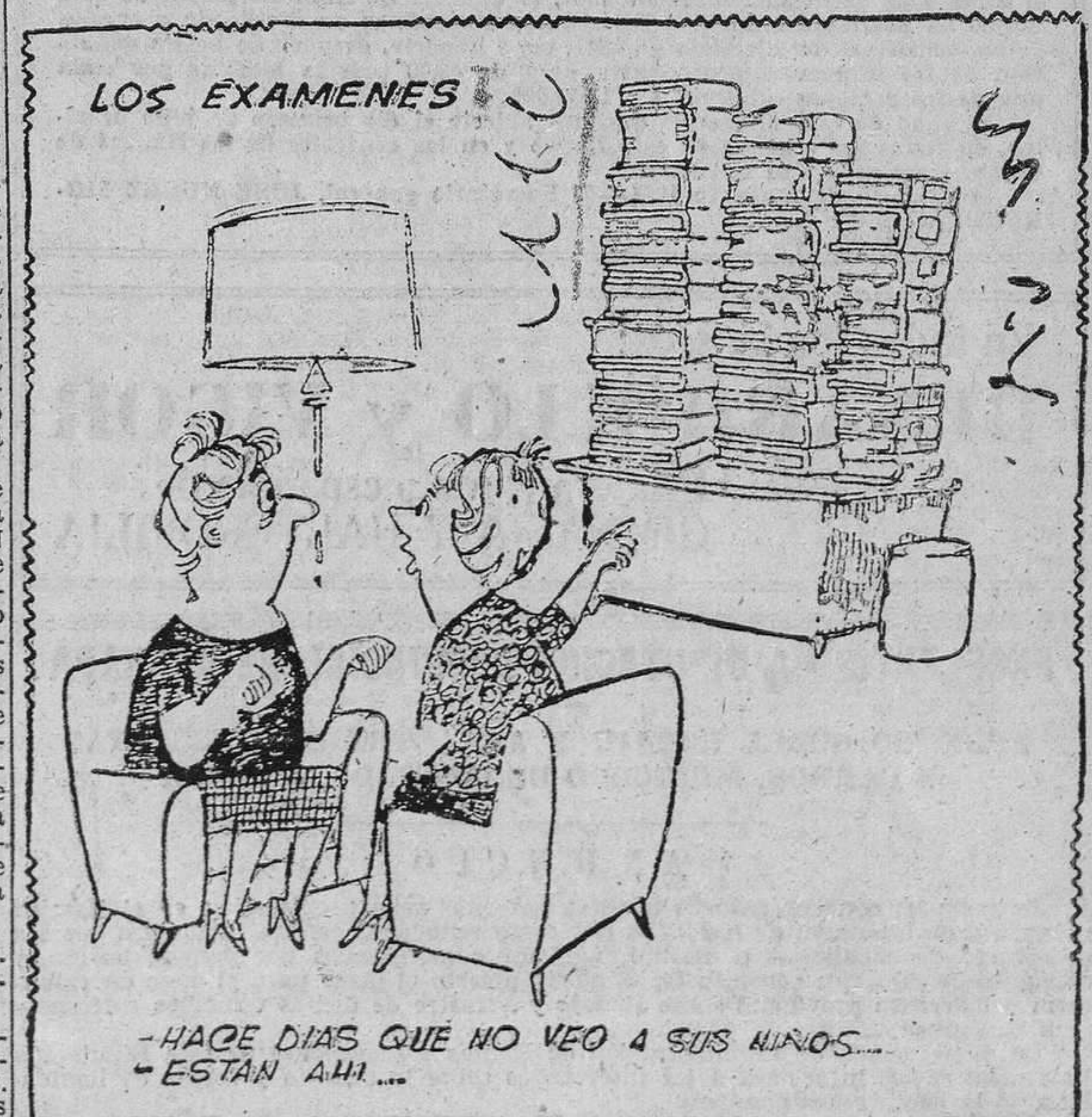
— HACE DIAS QUE NO VEO A SUS NIÑOS... — ESTAN AHÍ... —