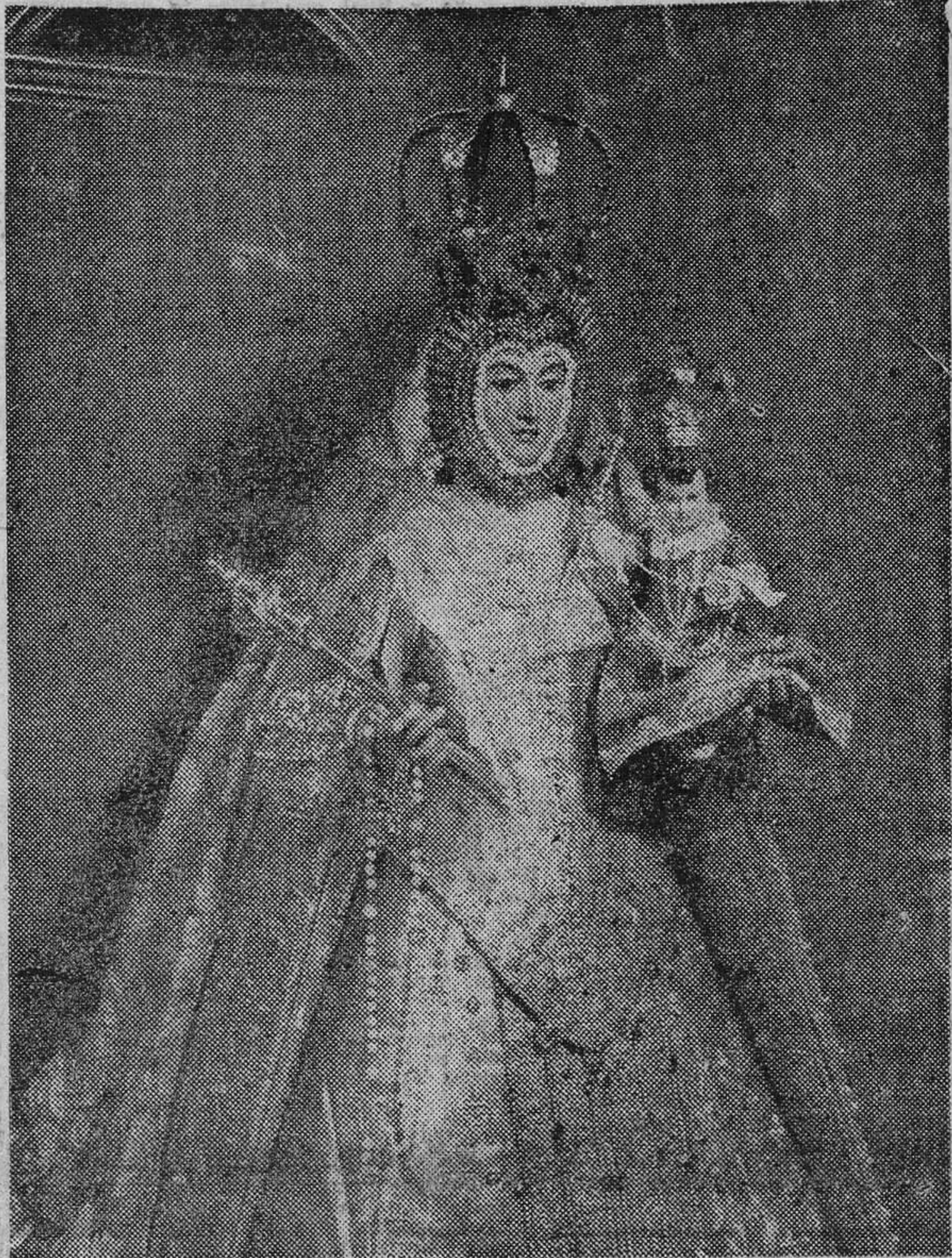
Bella imagen de Nuestra Señora del Rosario, que ayer fue coronada por el señor arzobispo, en solemne ceremonia celebrada ante millares de granadinos en el recinto del Triunfo.

Valiosa corona, ofrendada por el pueblo granadino a Nuestra Señora del Rosario, con la que ayer ciñó sus sienes la venerada imagen