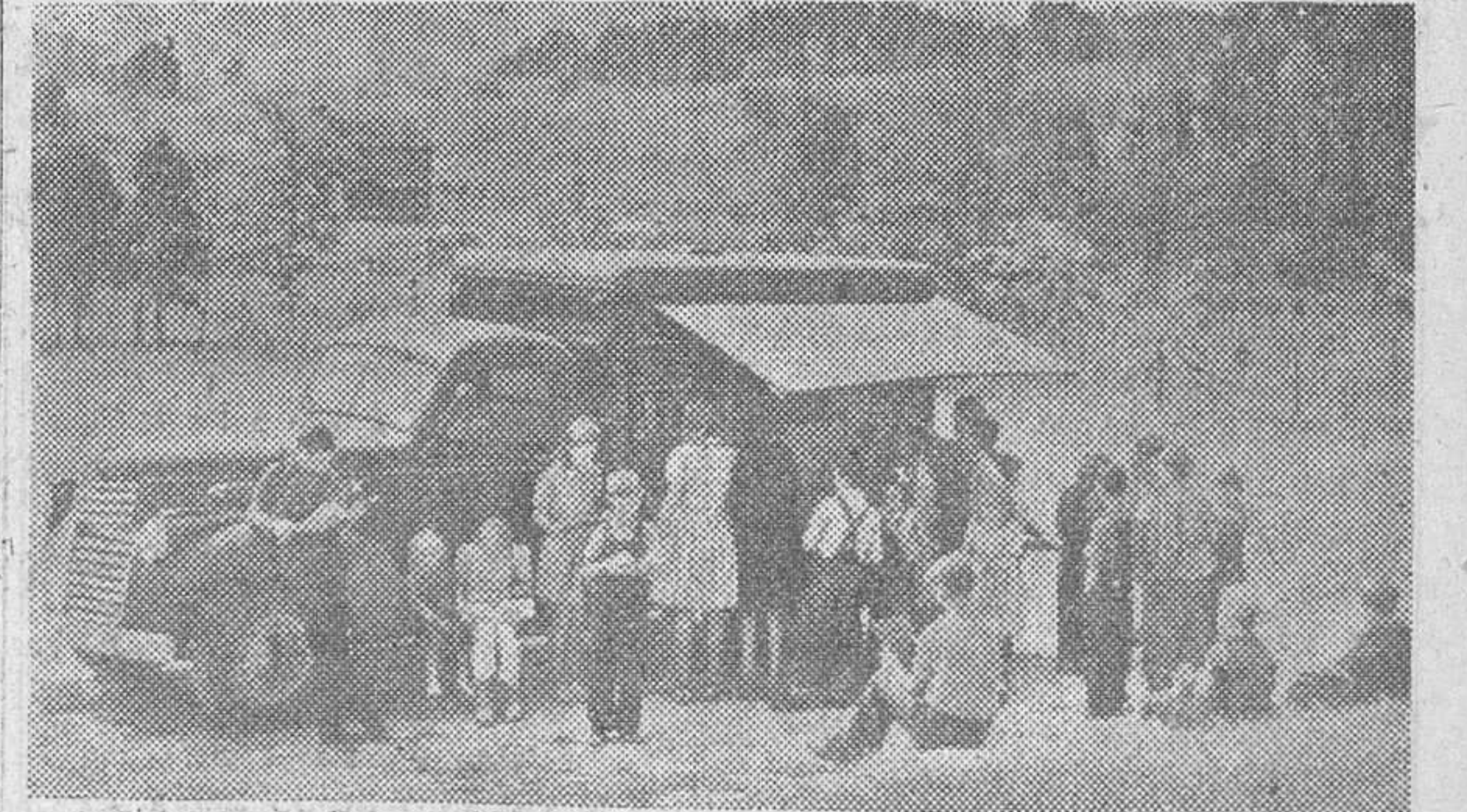
Ante la escuela de un pueblecito yanqui se detiene una biblioteca automóvil.

Los setenta millones de labradores desdeñan las novelas y prefieren los libros prácticos y útiles