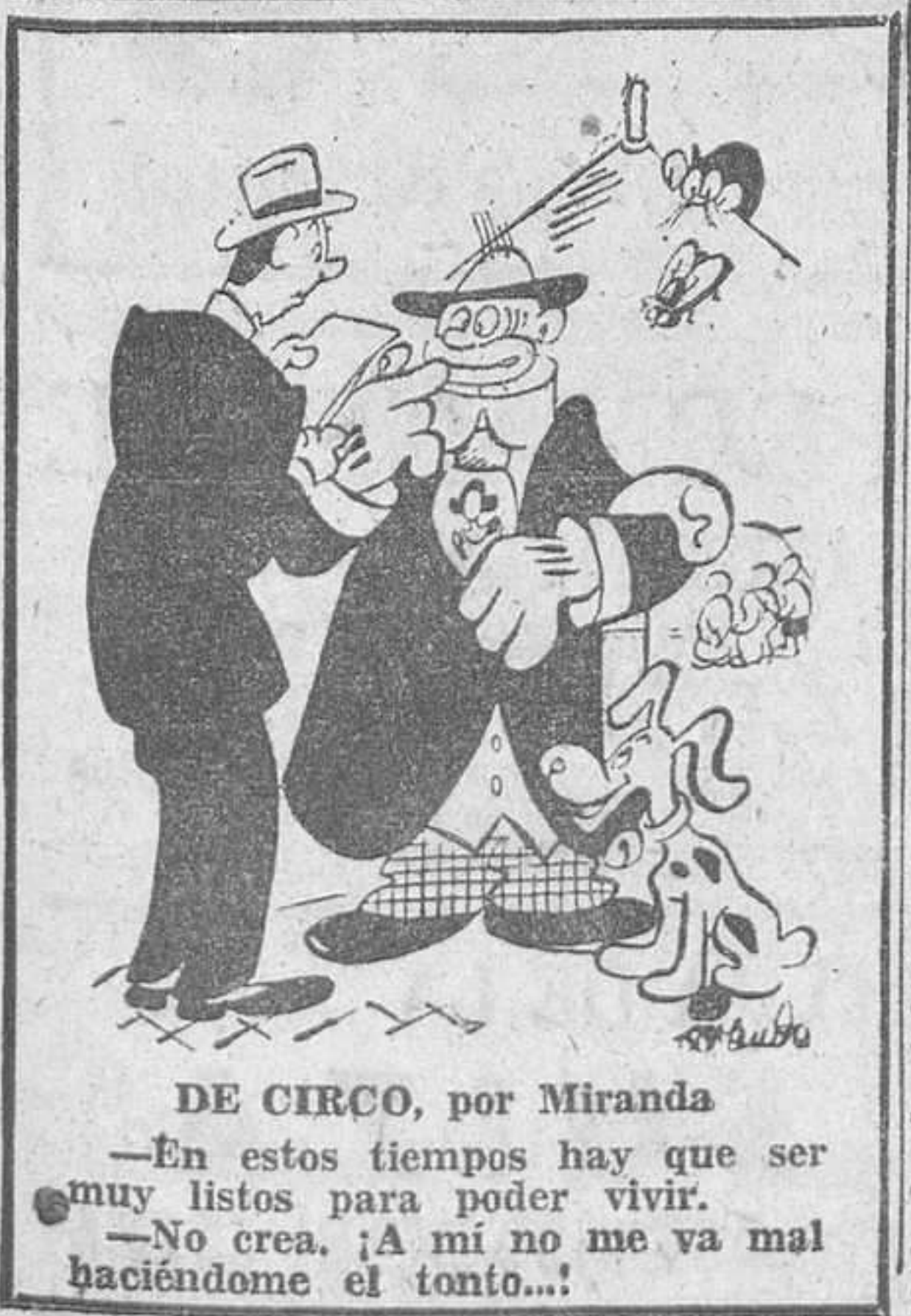
DE CIRCO, por Miranda

der los tecnicismos contenidos en los boletines publicados por el Gobierno acerca de la situación de la agricultura y el comercio. Hoy día se redactan esos boletines en lenguaje más sencillo, y una nueva encuesta ha puesto de relieve que ya pueden entenderlos 53 por 100 de los agricultores. Ha podido observarse que los habitantes de las zonas rurales en los Estados Unidos desdeñan las novelas, y prefieren los libros prácticos y útiles, en los que puedan aprender cosas nuevas, y enterarse de asuntos tales como el problema ruso, la química orgánica, etc.