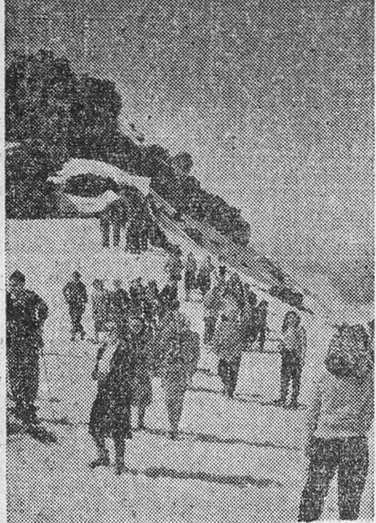
Las pistas de Sierra Nevada son las mejores de España para el esquí. Aun en verano hay nieve en algunas pistas, lo que permite el deporte durante todo el año.

una carga que una ayuda. Además, como condición reglamentaria de esta expedición, es preciso llevar cada uno a su chaval en la excursión. La cuarta excursión fue a Lanjarón, Orgiva, Torvizcón, Cádiar, Cerrajón de Murtas, Turón, Beni-