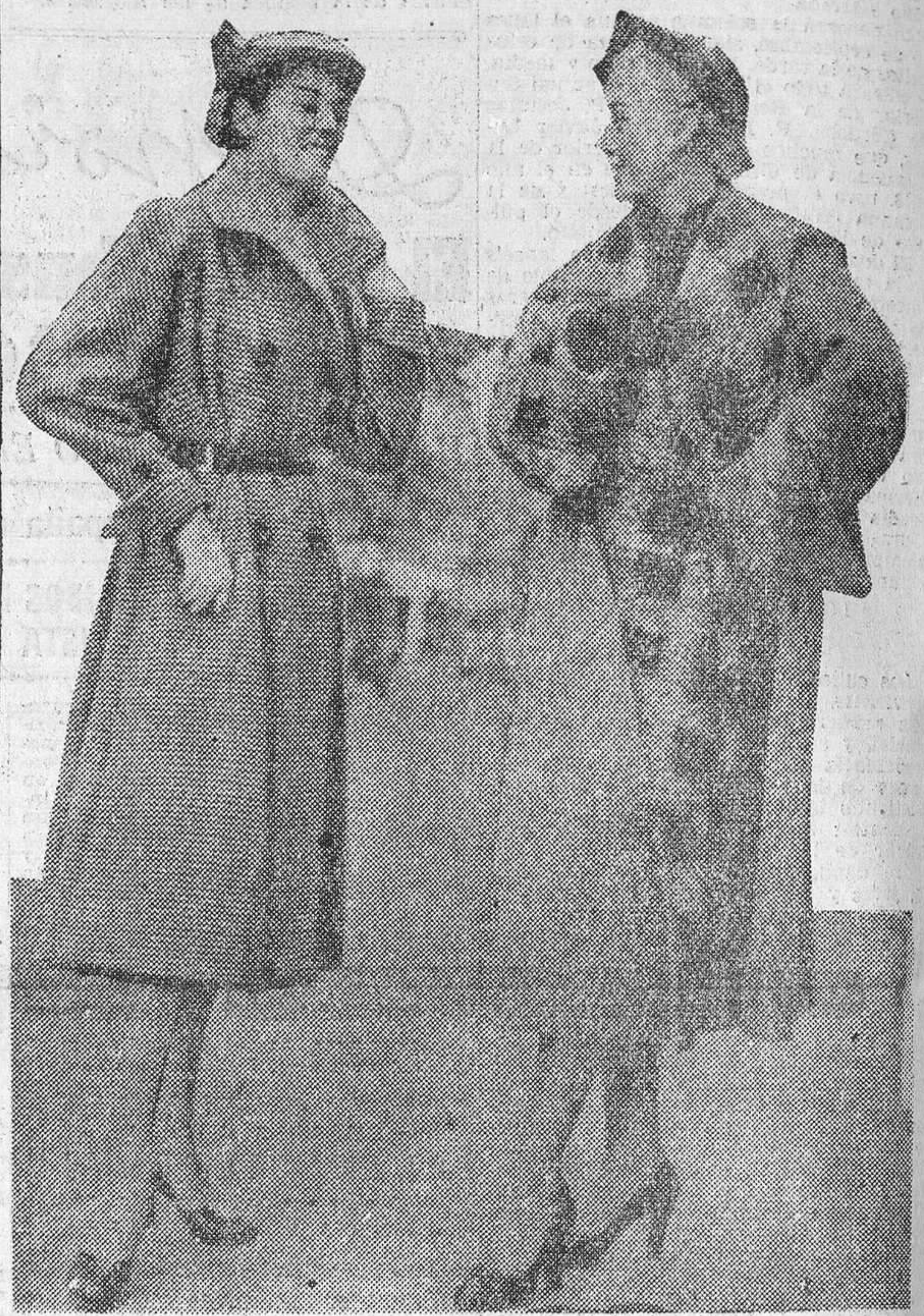
Los creadores de la moda no descansan. En pleno estío, preparan ya las novedades para otoño e invierno. Aquí tienen, señoras y señoritas, dos bellos modelos de abrigo «último grito» para 1953. La tendencia, según los técnicos, es acortar un poquitín las faldas.

Tres mil famosos modistos de varios países, quinientos periodistas y seiscientos industriales, en el gran desfile de la moda para otoño e invierno, en París