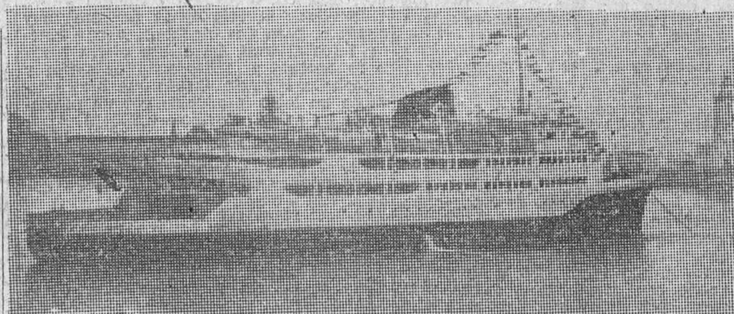
He aquí el magnífico transbordador «Victoria», que ha empezado a prestar servicio entre Algeciras y Ceuta. Ha sido construído por el empresa nacional «Eleano», de Valencia. Desplaza 4.250 toneladas con plena carga y en sus cinco cubiertas puede llevar numeroso pasaje, vagones y vehículos motorizados.

exaltación y la grandeza del 18 de Julio después de haber movido a los mayores riesgos y sacrificios a una juventud mil veces heroica.