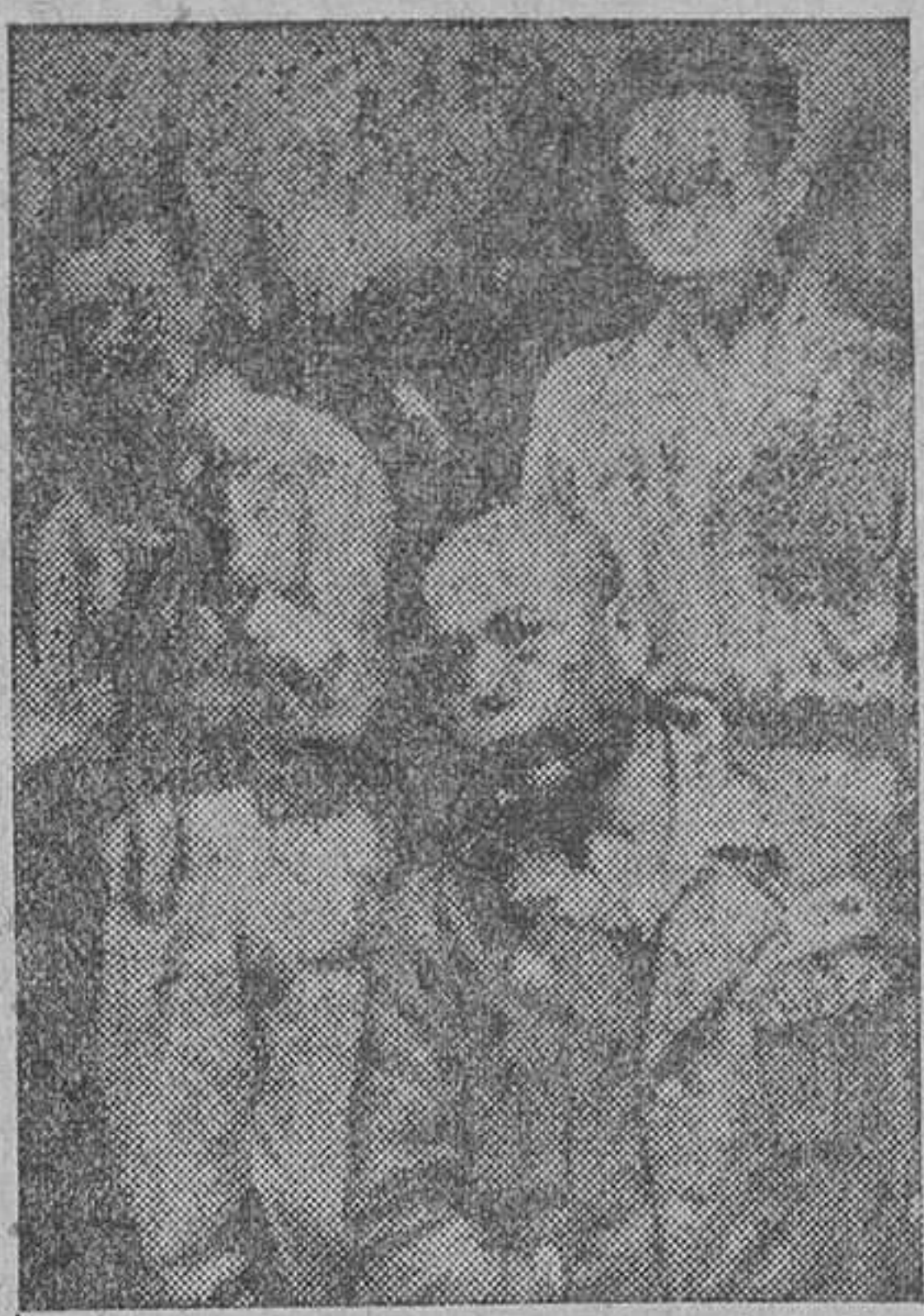
Yamashita, el «carnicero de Filipinas», comparece ante los jueces para responder de sus atrocidades durante la dominación nipona en aquel archipiélago.

electorales, poco antes del anochecer, había votado en varios de los distritos de esta capital el noventa por ciento del censo. Las noticias que se reciben de todo el país son de que la participación electoral ha sido muy grande. En una aldea de la Baja Austria no hubo ninguna abstención.