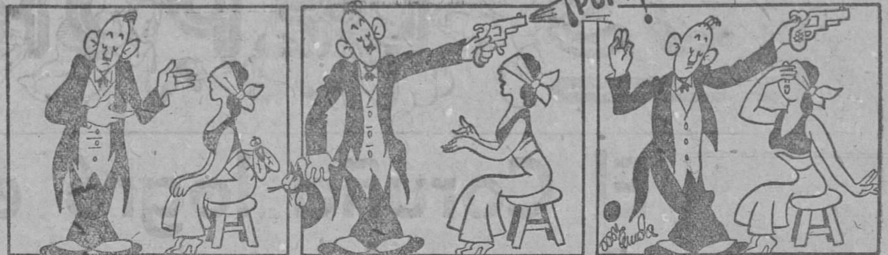
—Y ahora, respetable público, una vez dormida adivinará todo cuanto se le pregunte.