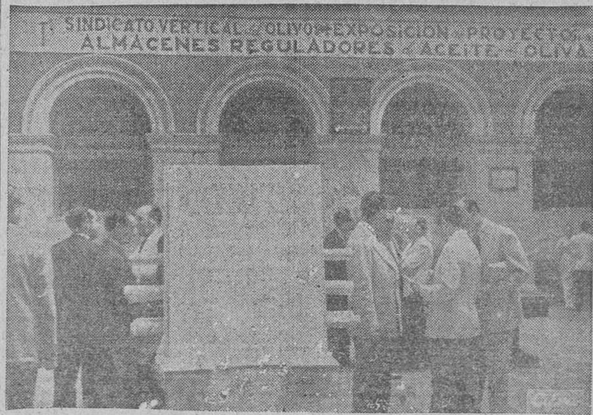
MADRID.—Inauguración en uno de los patios del ministerio de Agricultura de la Exposición de proyectos de almacenes reguladores de aceite para el Sindicato del Olivo.