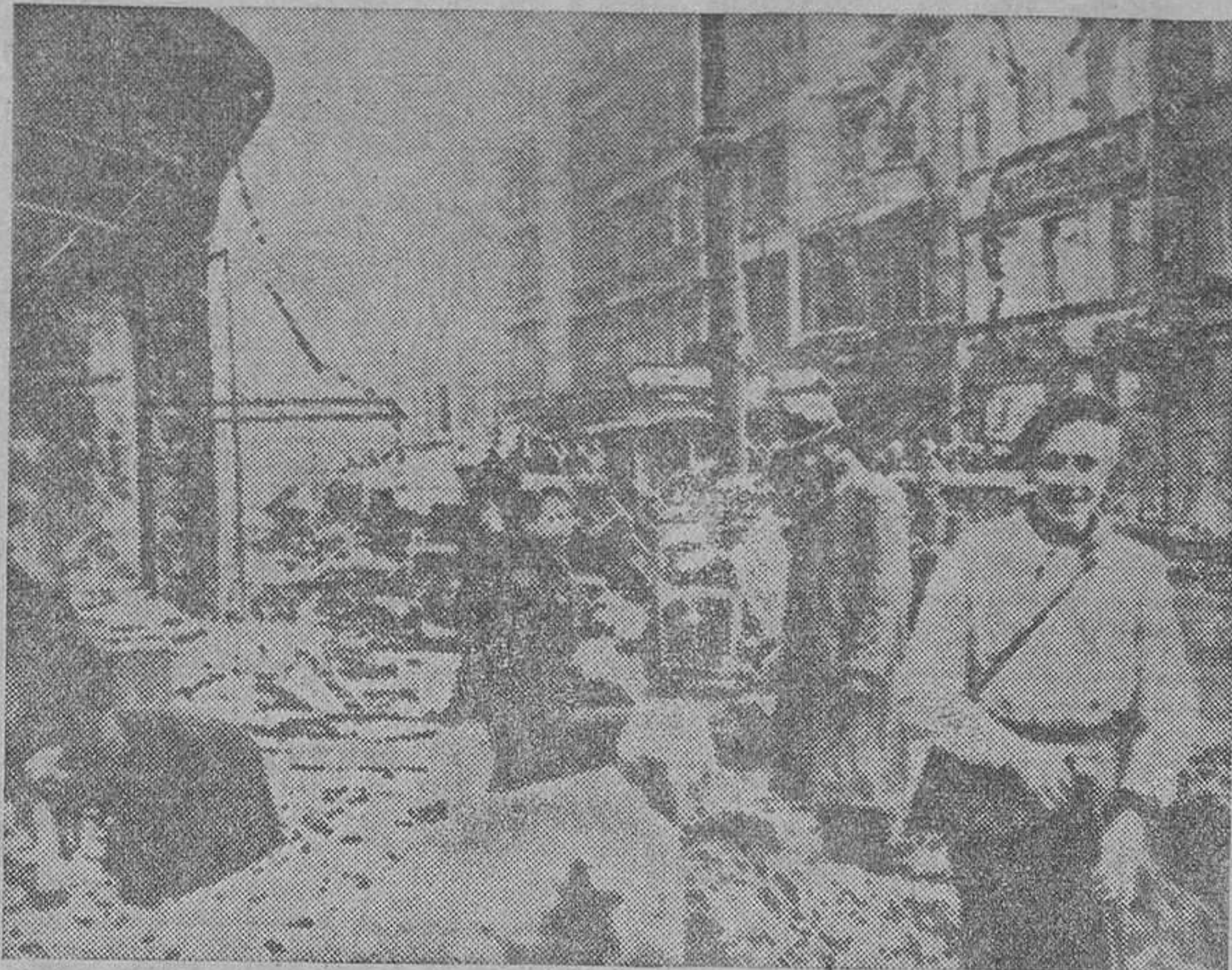
BERLIN.—Los ciudadanos de Berlín trabajan en labores de descombro y de reconstrucción de la ciudad. (Cifra.)