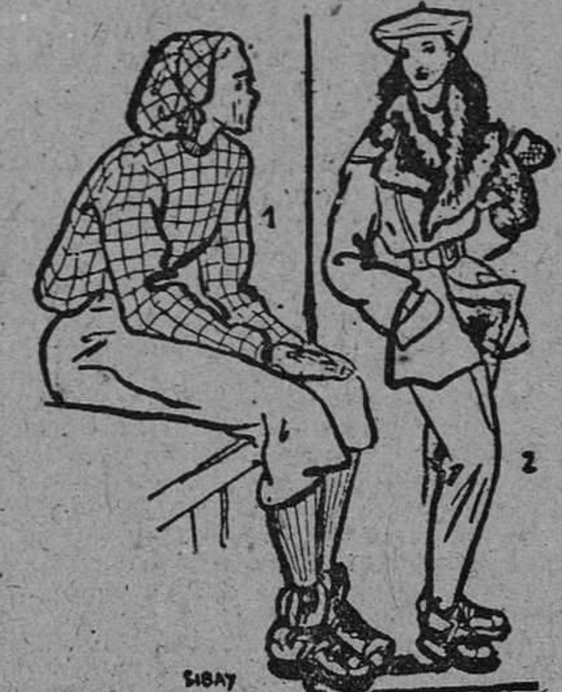
1. Blusa y gorro en lana cuadrada roja y azul marino. Puños y escote de punto rojo.—2. Pantalón y chaqueta en bellardina color beige. Forro y grandes solapas en castorina marrón. Visera de bellardina.

Es difícil precisar las muchas soluciones y detalles que existen para resolver los problemas particulares que se plantean a toda esquiadora novata al querer seleccionar su equipo.—M. F.