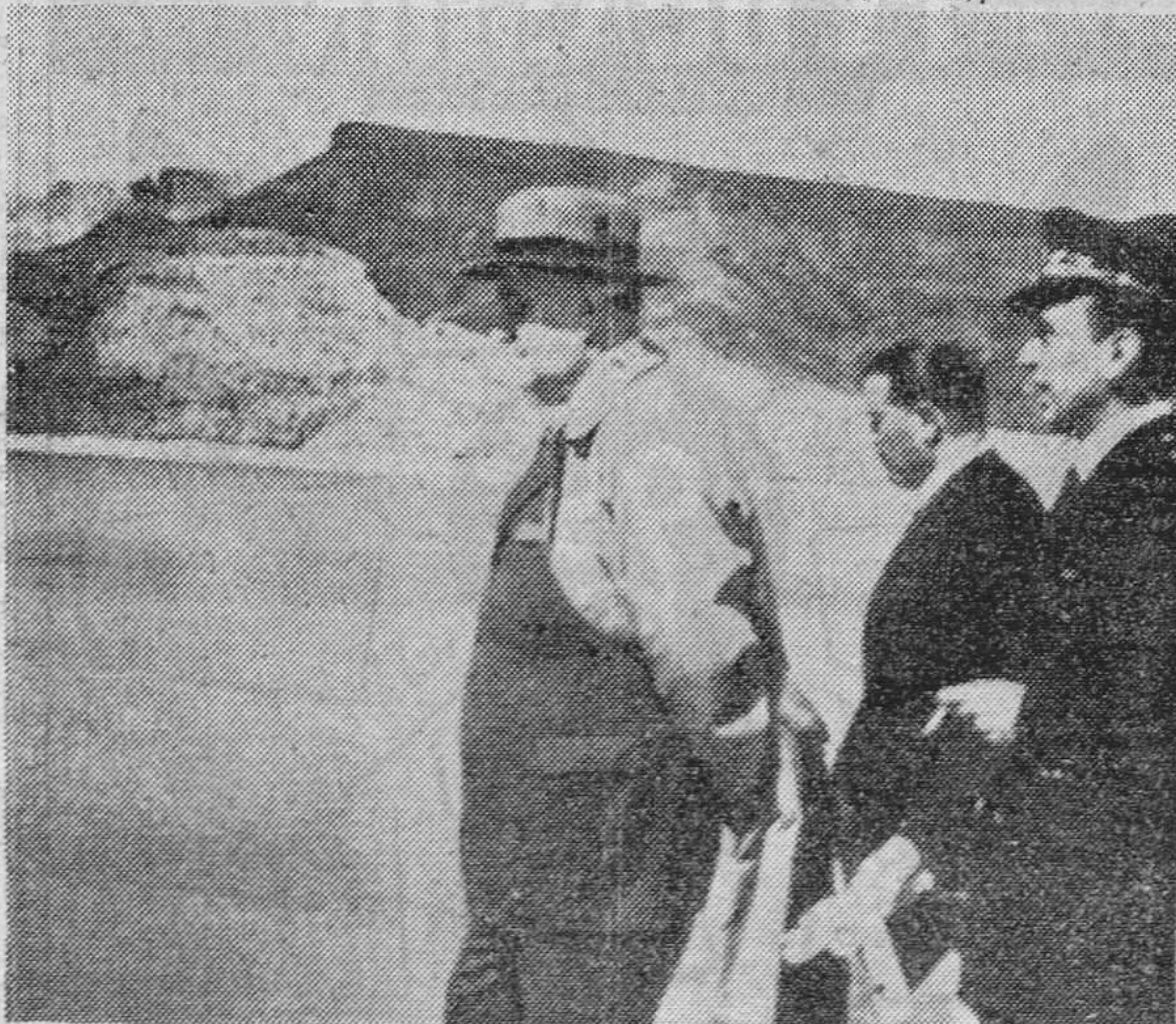
MURCIA.—El Conde de Vallellano durante su visita al pantano Corcovado.

A las diez de la noche, en tren especial, el ministro de Obras Públicas marchó a Almería.—(CIFRA).