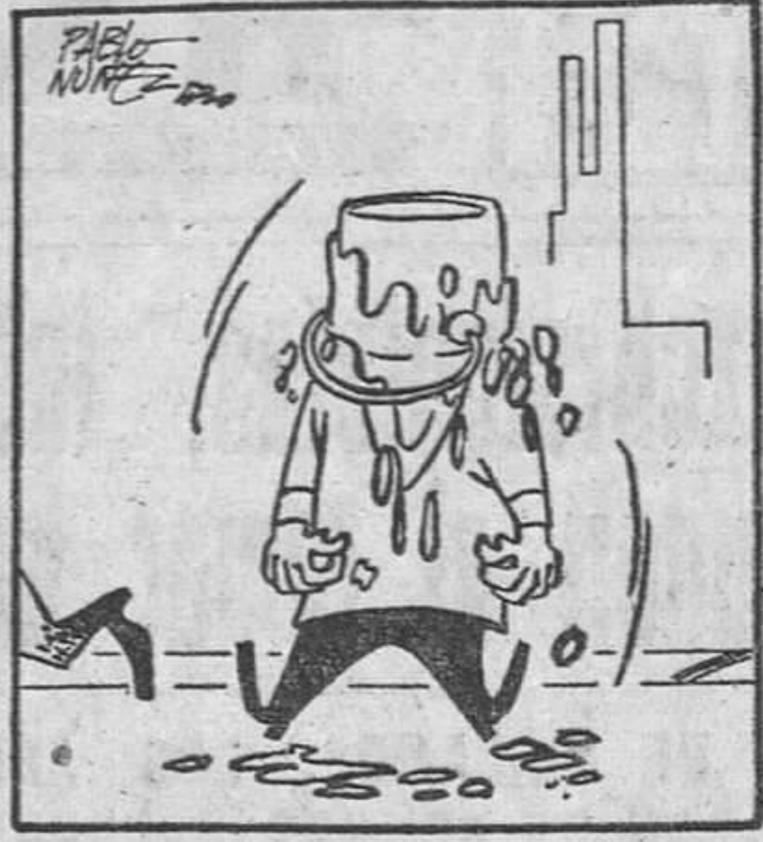
ESTUDIOS HISTORIAS-1952. Derechos reservados. ESPAÑA. S. S. S. S. S.