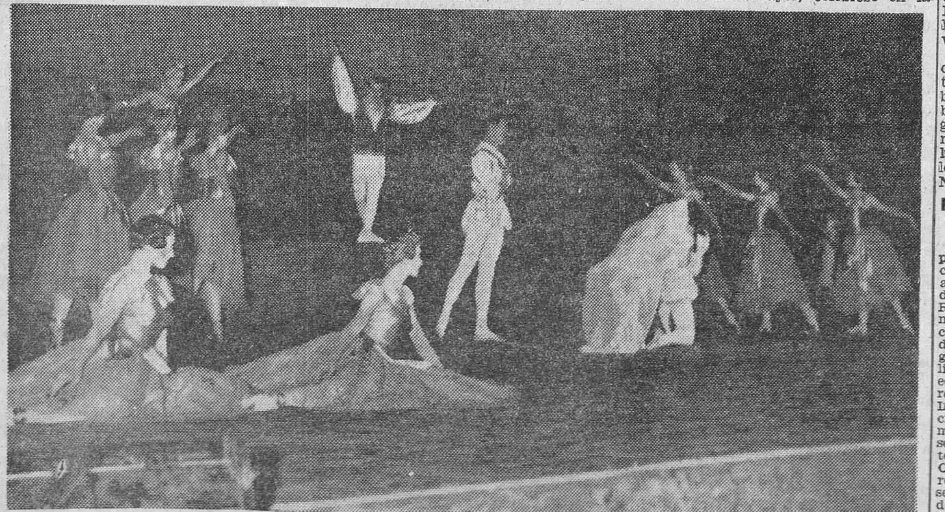
Uno de los momentos de la actuación del «Gran Ballet de la Opera de Paris», que anoche dió su tercera y última representación en el teatro del Generalife.

El público que llenaba la amplia terraza al advertir la presencia allí de la marquesa de Villaverde, que permaneció en aquel lugar largo rato, le hizo objeto de cariñosos aplausos.