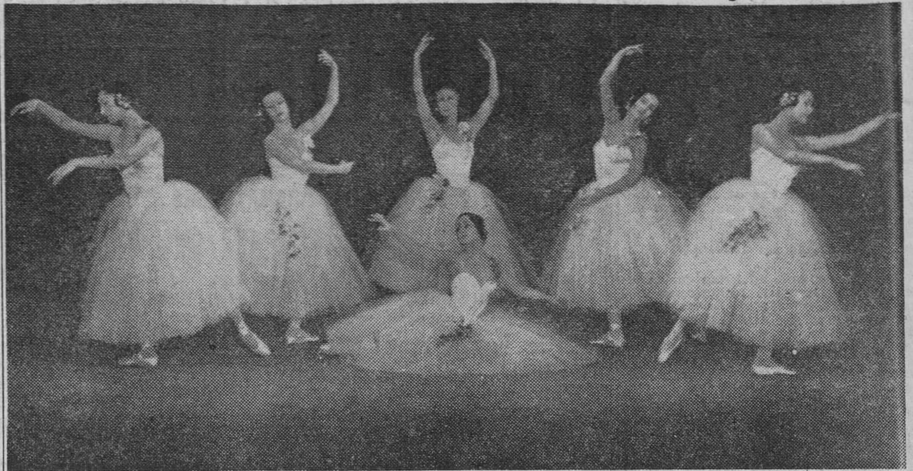
Las sesiones del VI Festival Internacional de Música y Danza se vienen celebrando con extraordinario éxito y brillantez, en los magníficos escenarios de la Alhambra. La «foto» recoge un momento de la actuación del «Gran Ballet de la Opera de París», en el maravilloso teatro al aire libre del Generalife, donde anoche dió su tercera y última representación, con idéntico éxito que las precedentes. (Información en pág. última.)