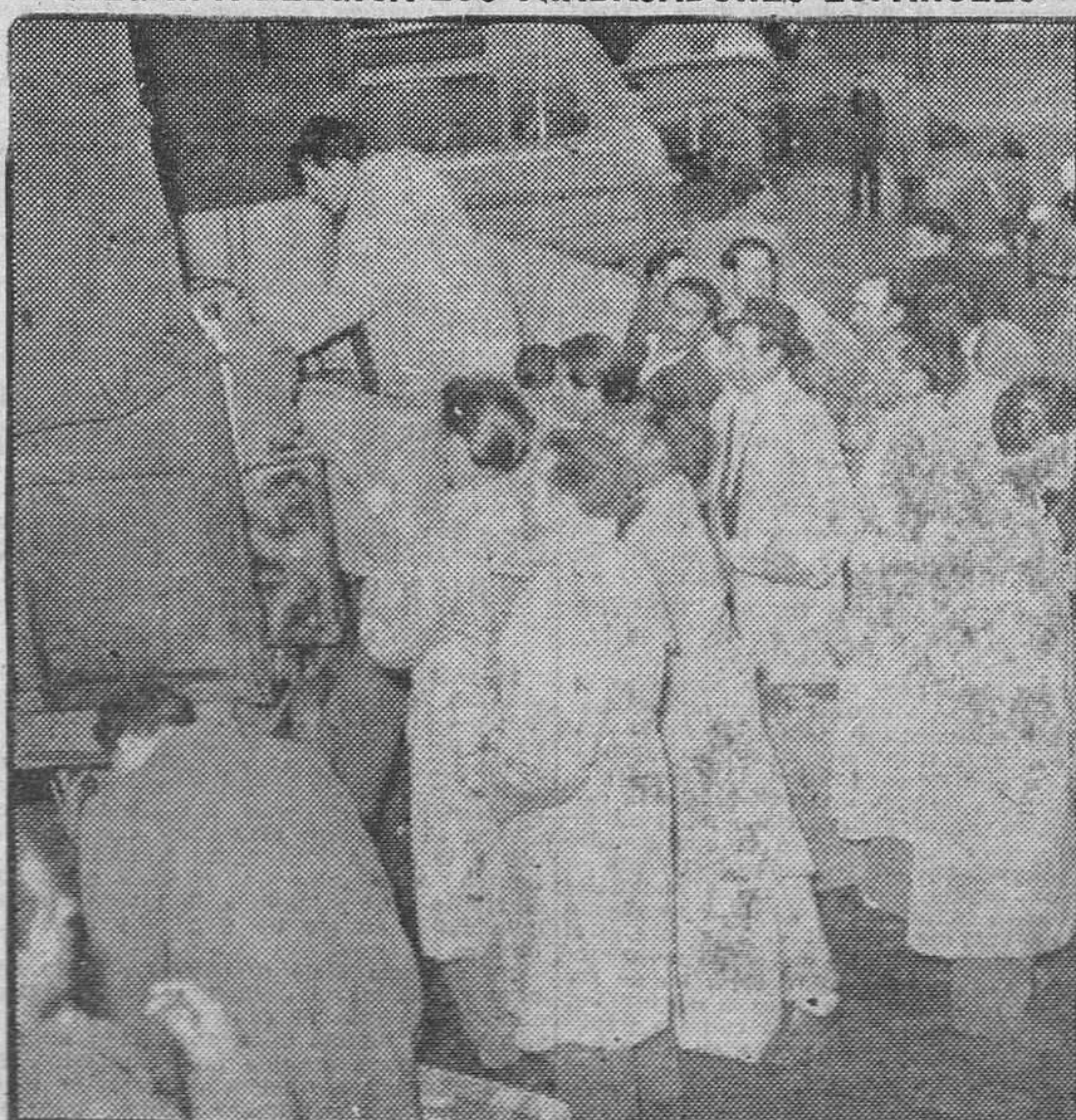
CHARLEROI.—A su llegada a esta ciudad, los trabajadores españoles proceden a recoger su equipaje para dirigirse a sus alojamientos. Componen la expedición ciento cinco obreros y se espera la llegada de otros centenares para los meses próximos.