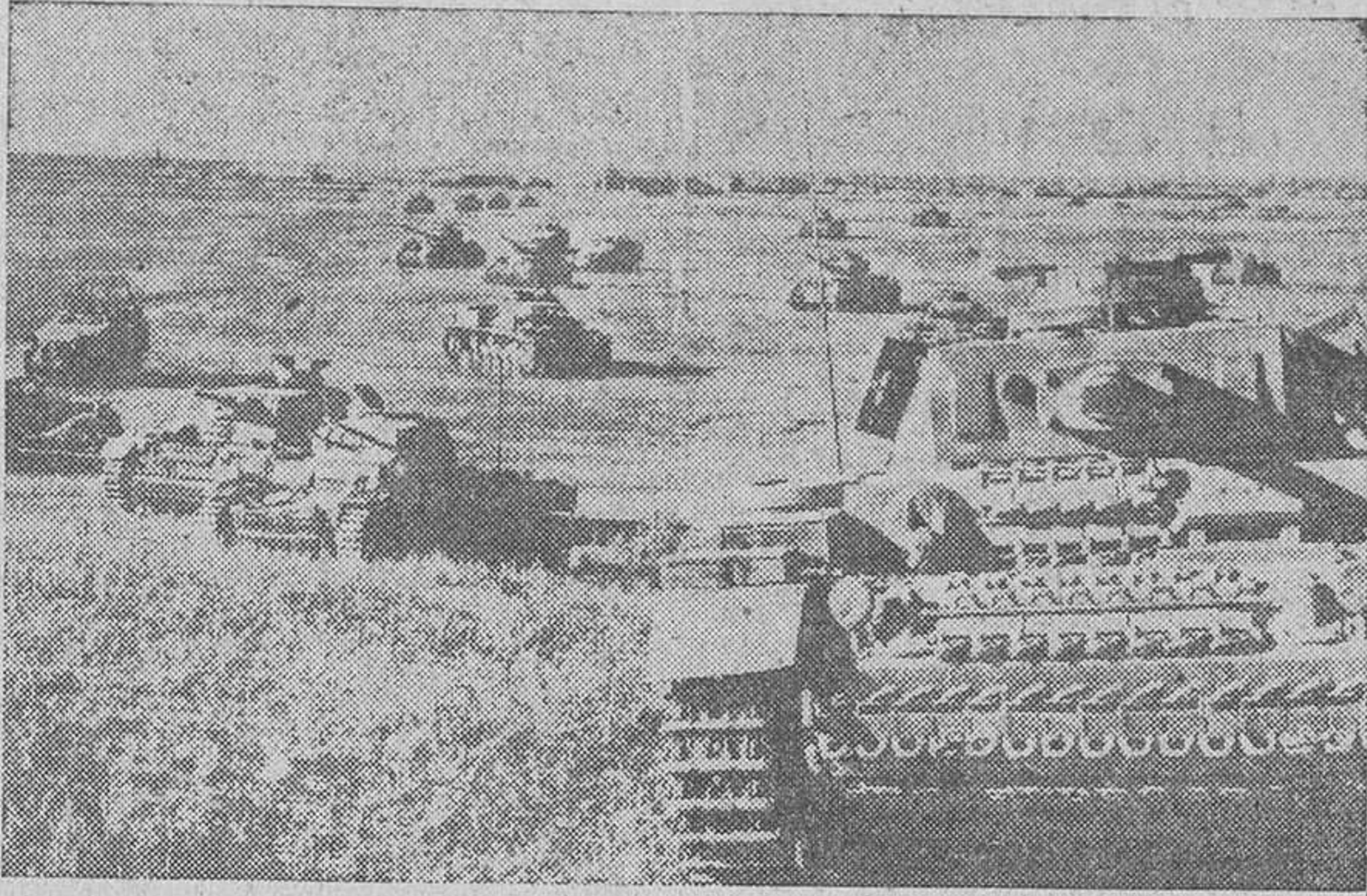
En los campos de Africa, en donde ahora se ha reproducido la lucha los tanques del Eje desfilan en impresionante cortejo