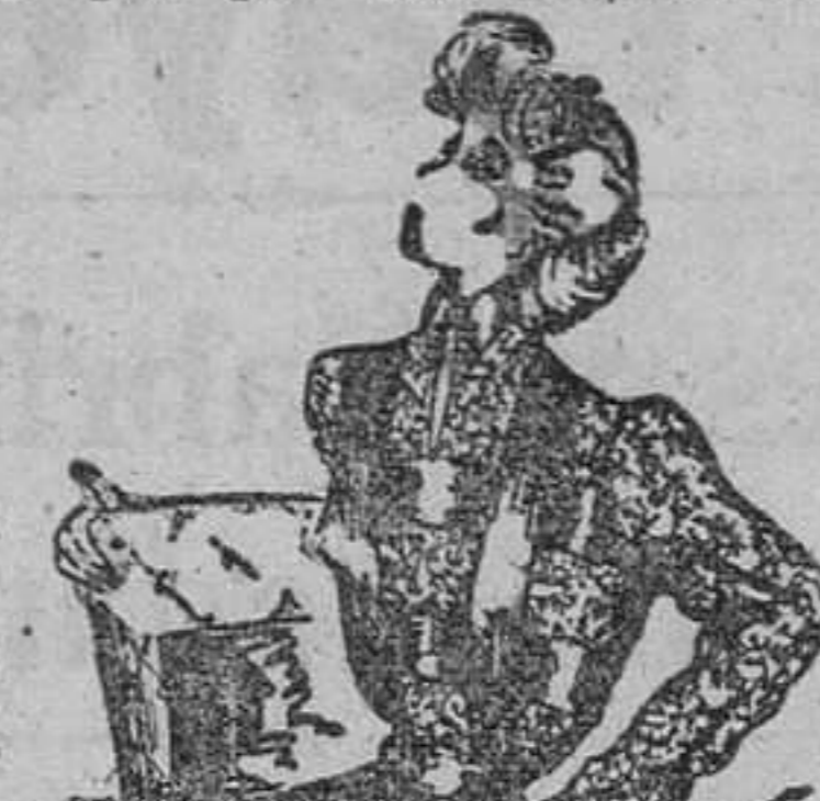
Un bonito modelo de blusa de crepón

No es ningún secreto para las mujeres el constatar que los hombres las admiran por todo menos que por sus cualidades mentales. Y si se ven obligadas a reconocer la clara inteligencia de alguna de ellas se limitan a decir: "¡Bah! Ha hecho lo que hubiera podido hacer un hombre". O también: "Esta mujer tiene un criterio masculino".