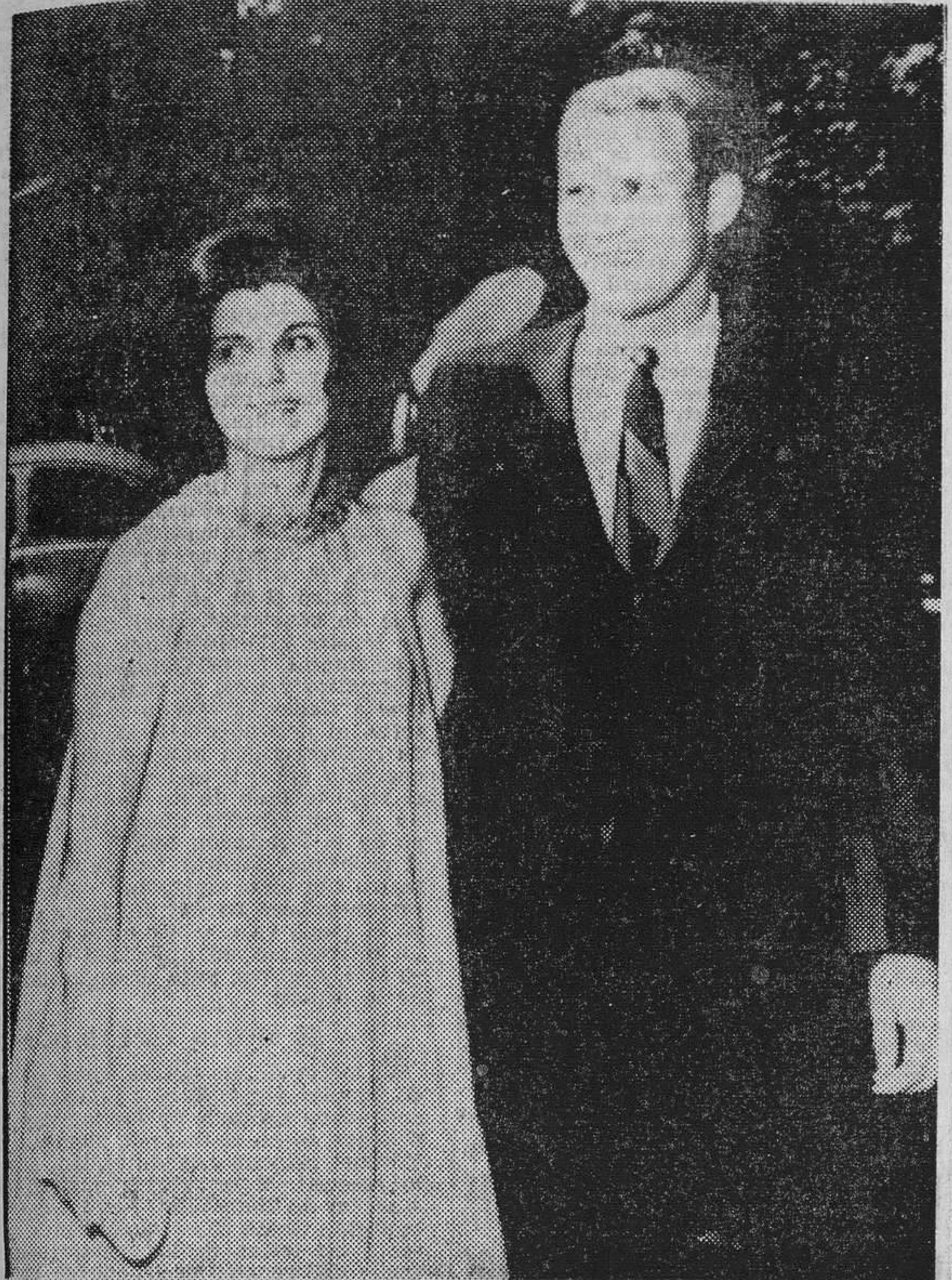
Luci Johnson y Pat Nugent, que han contraído matrimonio en Washington, ceremonia considerada como la boda del siglo.