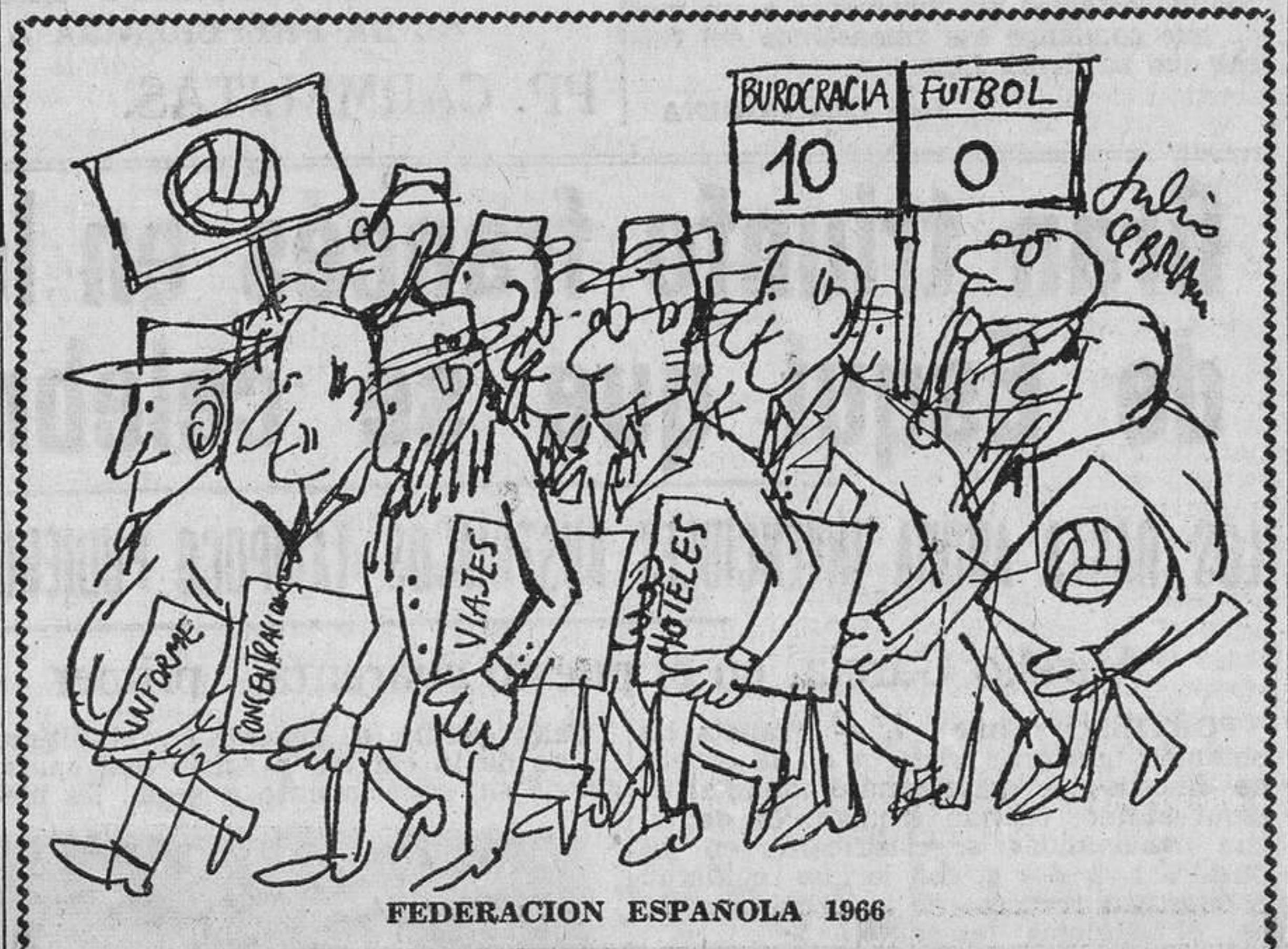
FEDERACION ESPAÑOLA 1966