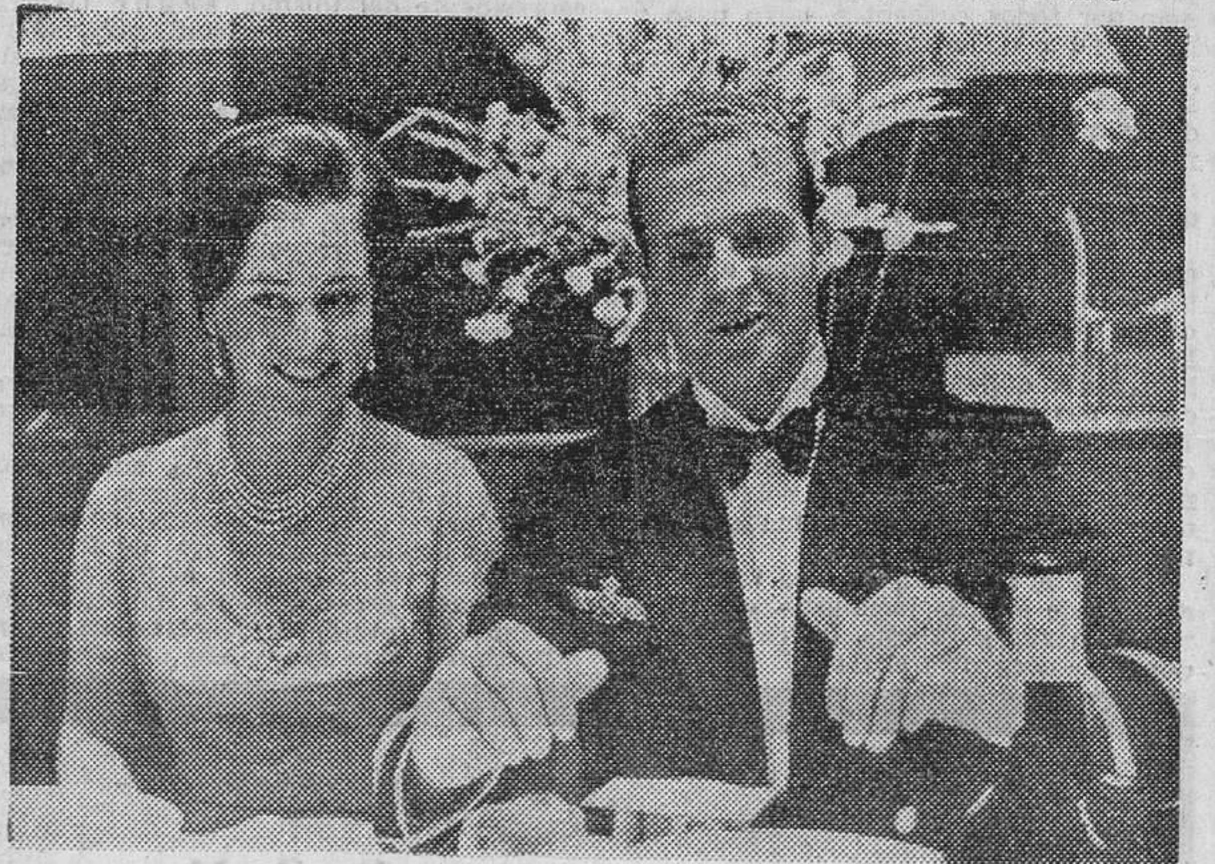
COPENHAGUE.—La princesa Benedikte de Dinamarca y el príncipe don Juan Carlos de Borbón, durante la cena de gala organizada por el «Royal Danish Yachtclub», con motivo de su centenario. Asistieron al banquete tres reyes y los participantes en el Campeonato de Europa y del Mundo de regatas de diversas categorías.