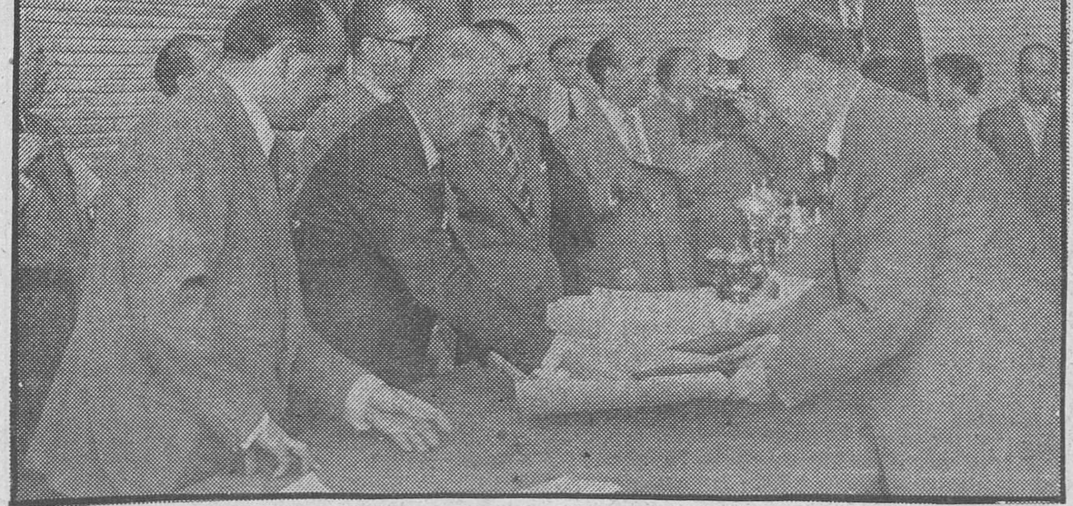
Clausurada la III Feria Internacional del Campo, se ha celebrado en Madrid un acto para la entrega de premios y diplomas a las distintas entidades que concurrieron a dicho certamen. Presidió el ministro de Agricultura, señor Cavestany, quien aparece en la fotografía entregando los premios, a compañía del delegado nacional de Sindicatos, Sr. Solís