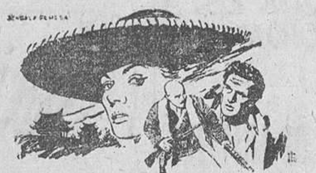
APOCALIPSIS SOBRE EL RIO AMARILLO Anita Ekberg - George Marchal

UN ACONTECIMIENTO UNICO EN LA HISTORIA DE UN CONTINENTE