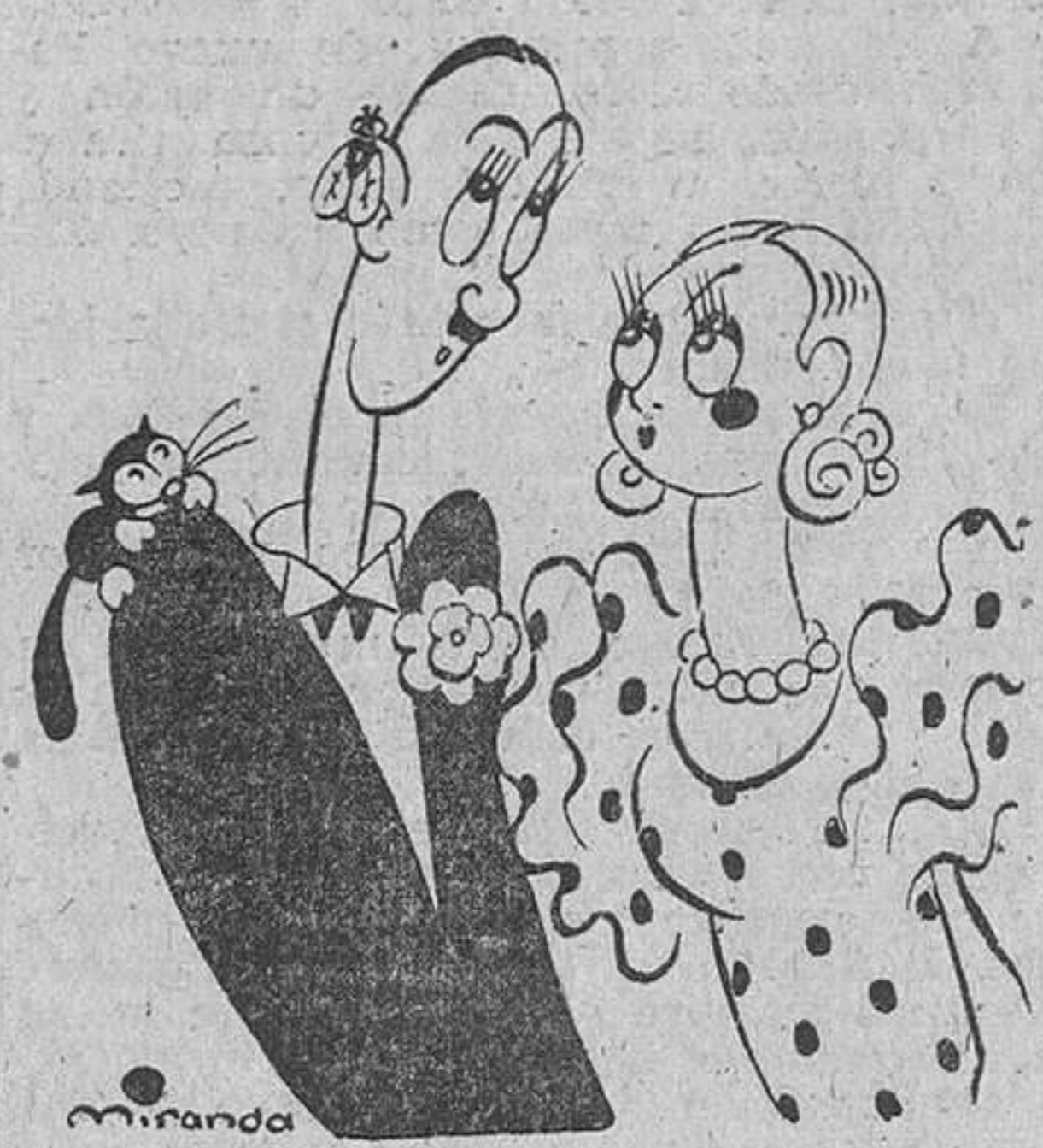
PUNTO FINAL. Por Miranda

Se pita el final de la primera parte. El Rácing de Córdoba ha jugado entusiasta y todos sus «equipiers» actúan con alma, supliendo la modestia y pobre clase de juego con moral. En cambio el Granada está desconocido, y los espectadores se extrañan de que un equipo tan falto de cohesión y fe ocupe lugar destacado en la clasificación. Su portero es regular. La defensa, trabajadora, aunque joven; de la media sólo se salva el izquierdo;