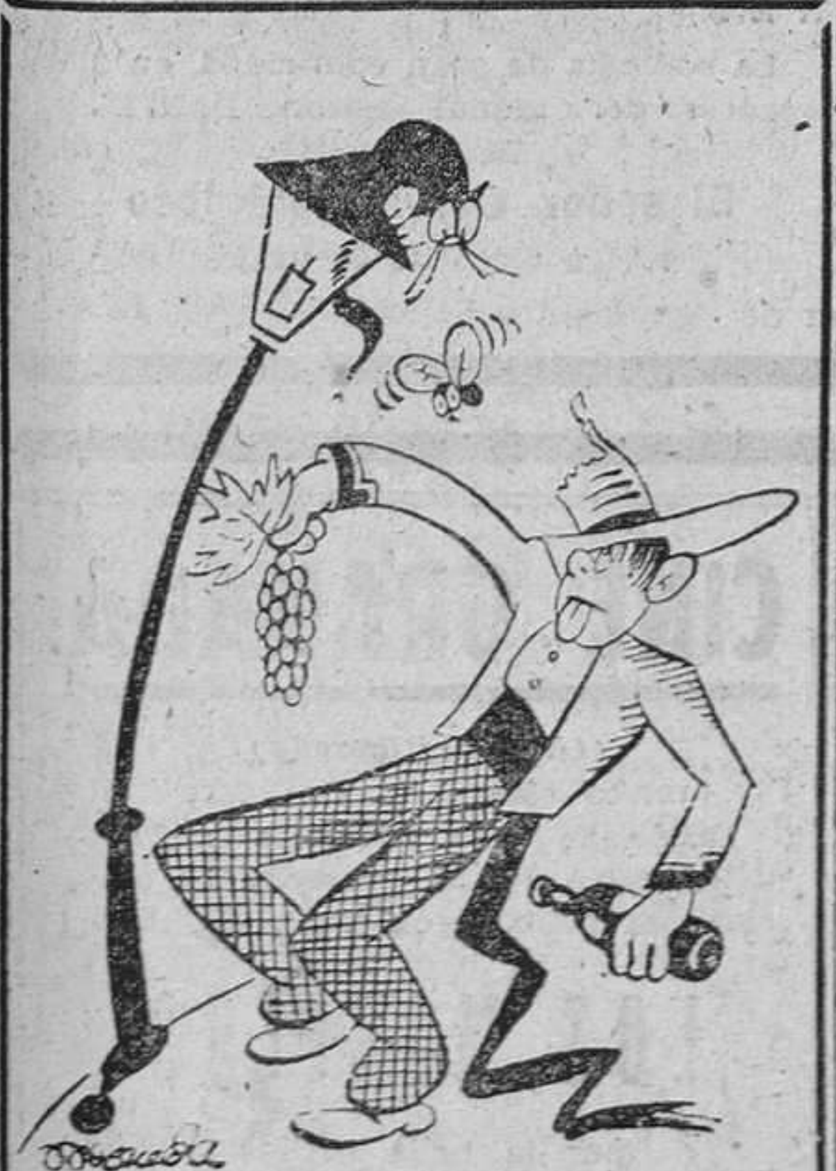
DE «BAJO VOLTAJE» —Que hablen de restricciones con lo «alumbrao» que voy yo!

Los socialistas y comunistas se unieron a los judíos en un mitin de protesta. (EFE).