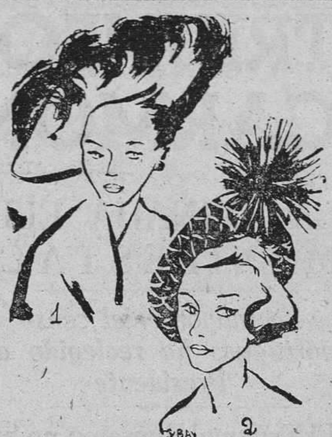
1.—Sombrero grande marrón, bordeado con plumas en beige. 2.—Pequeño sombrero en terciopelo ribeteado de red plateada y plumas.

Usando de un socorrido, tópico, diremos que la moda ha sido, es y será la eterna tirana que impondrá a la mujer sus caprichos y a padres y maridos un continuo y costoso desembolso. Cada estación, cada nueva temporada,