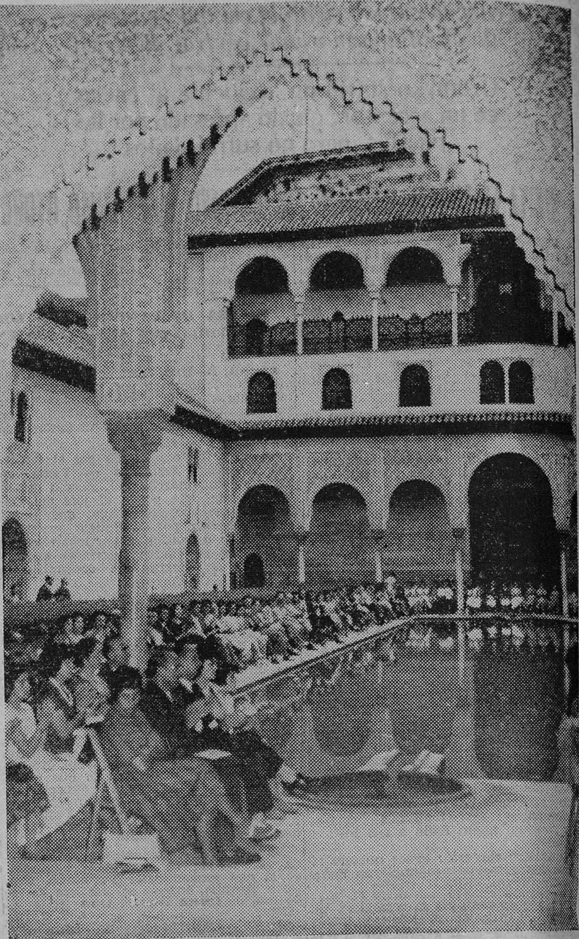
Un aspecto del patio de Arrayanes durante uno de los conciertos