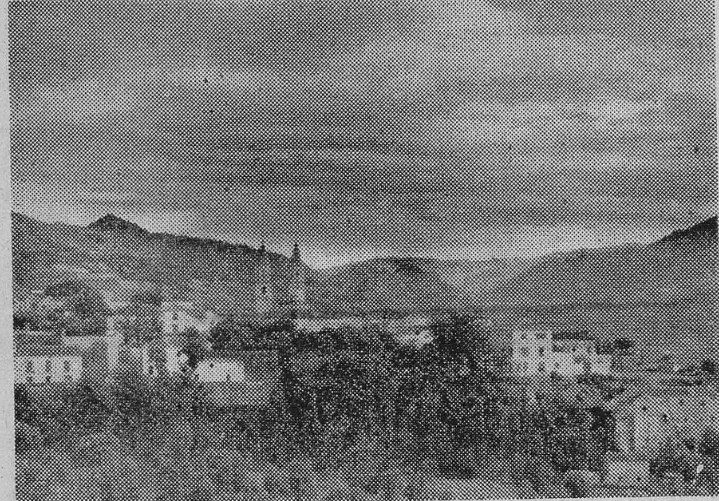
Una vista de Orgiva, en donde comienza la Alpujarra

Y este «silencio bienhechor» lo encuentra Spanhi allá arriba, «casi pegado al cielo», en las gentes de La Alpujarra; son los que permanecen fieles a su pueblo, los que cumplen los sagrados gestos de sembrar, de segar las espigas y de trillar sobre la era, cantando todo el día; los que caminan durante la noche para tocar el violín o la guitarra, para bailar o fortificar los lazos que los unen a los otros; los que saben sufrir con una sonrisa y dar, cuando apenas si tienen nada, lo mejor de ellos mismos... Esos sólo conocen el verdadero sentido de la vida.