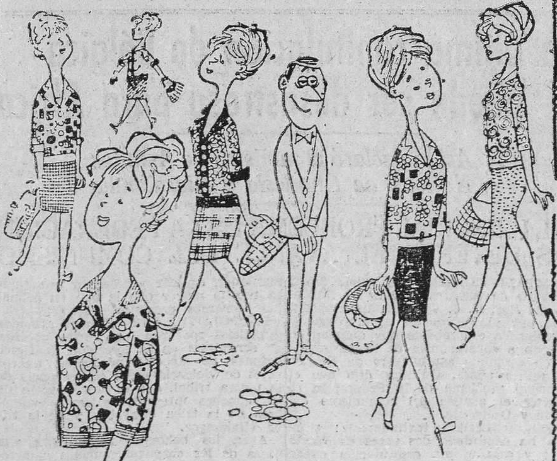
...para que al final todas se pongan lo mismo: dos pañuefos...