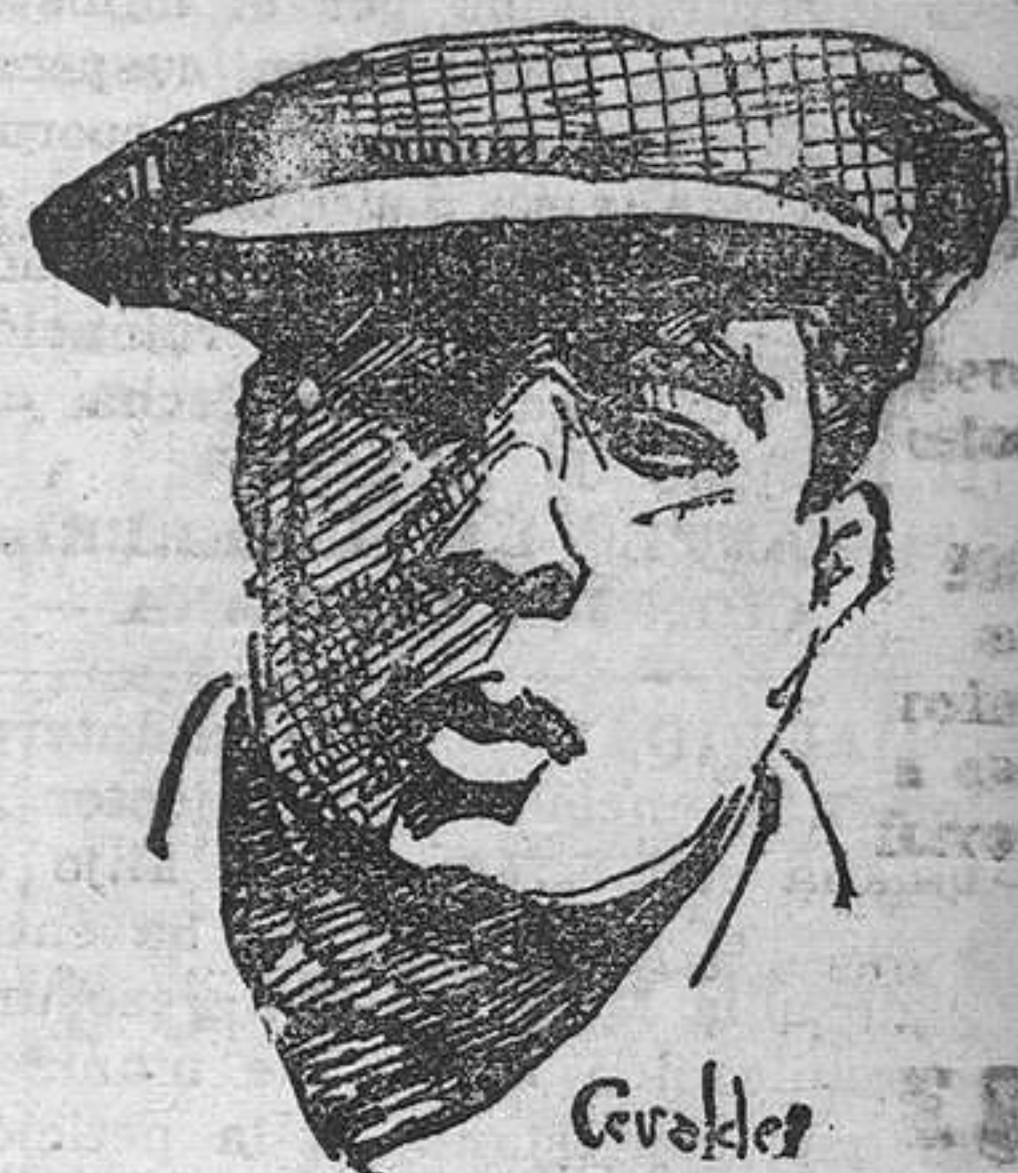
El guardameta internacional Ricardo Zamora, en cuyo honor se celebró ayer un homenaje nacional en Madrid.

toró en su puesto habitual. El remate de Lángara y la profundidad de Lafuente dieron una consistencia, que faltó en los demás. Lecue fracasó en su corta intervención, y Gorostiza bajo de forma estuvo lejos de su antigua fama. Tampoco Chacho hizo nada saliente. Solé si mejoró a Muguerza en el pase no defendió bien. La defensa fué impecable. Lo mismo Zabalo que Quincoces contuvieron los ataques intermitentes de los húngaros sin gran dificultad. Zamora no tuvo mucho trabajo. En el segundo tiempo apenas sacó algún balón. Se resume esto en que Regueiro,