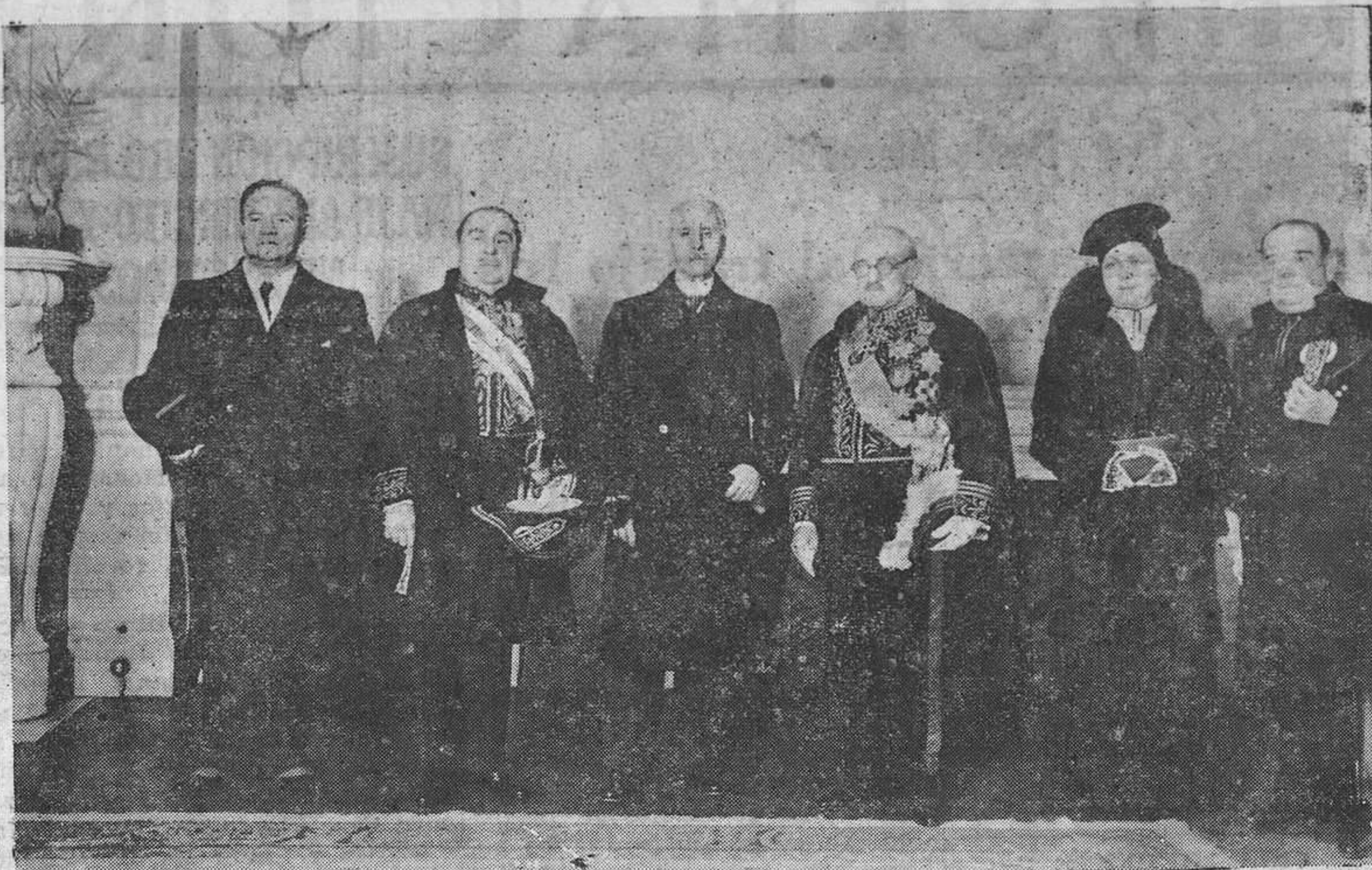
Don Carlos Manuel Céspedes—ex presidente de la República de Cuba—, nuevo embajador de su país en Madrid, que ha presentado las cartas credenciales al Presidente de la República, señor Alcalá Zamora.