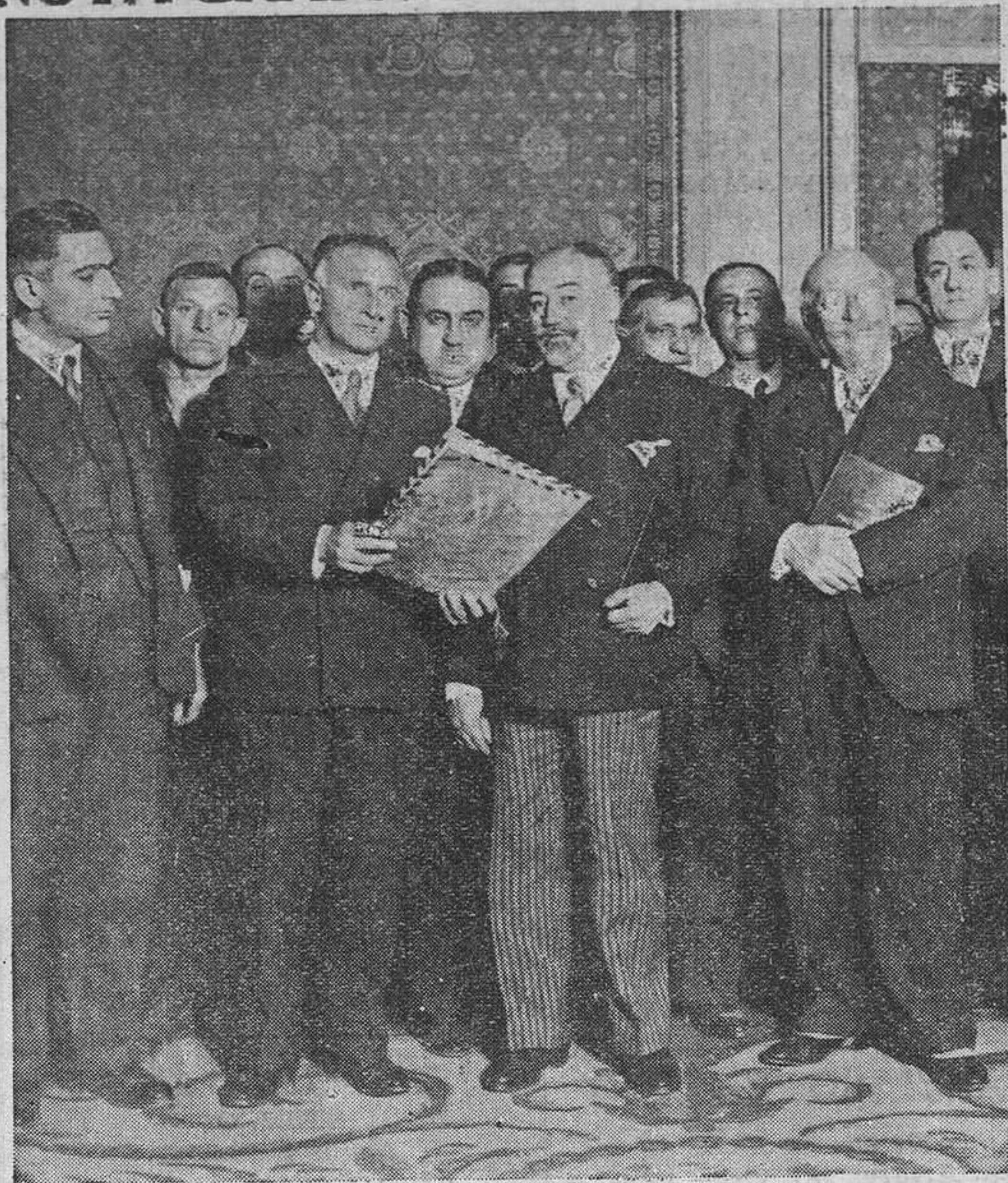
La representación de las Diputaciones vascas, al hacer entrega del ESTATUTO VASCO al presidente de las Cortes, señor Alba, con asistencia del jefe del Gobierno, señor Lerroux.