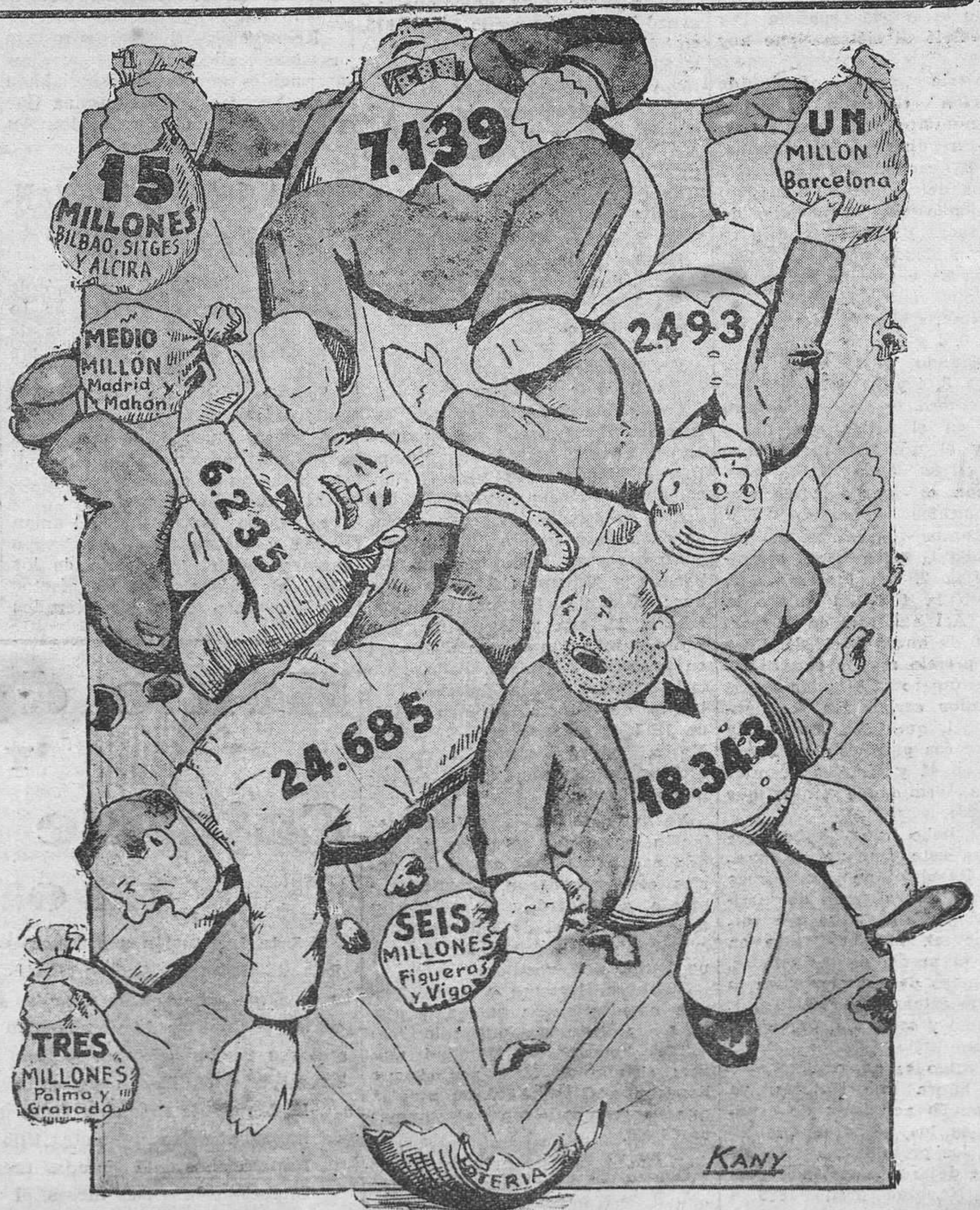
Cantapiedra, ha recogido la "nota" de ayer (el sorteo de la Lotería) en este afortunado punto.

Mantener la consignación para los cuatro profesores de música; la de 2.000 pesetas para el Patronato de San José y la destinada a los artistas que cursan sus estudios en centros oficiales.