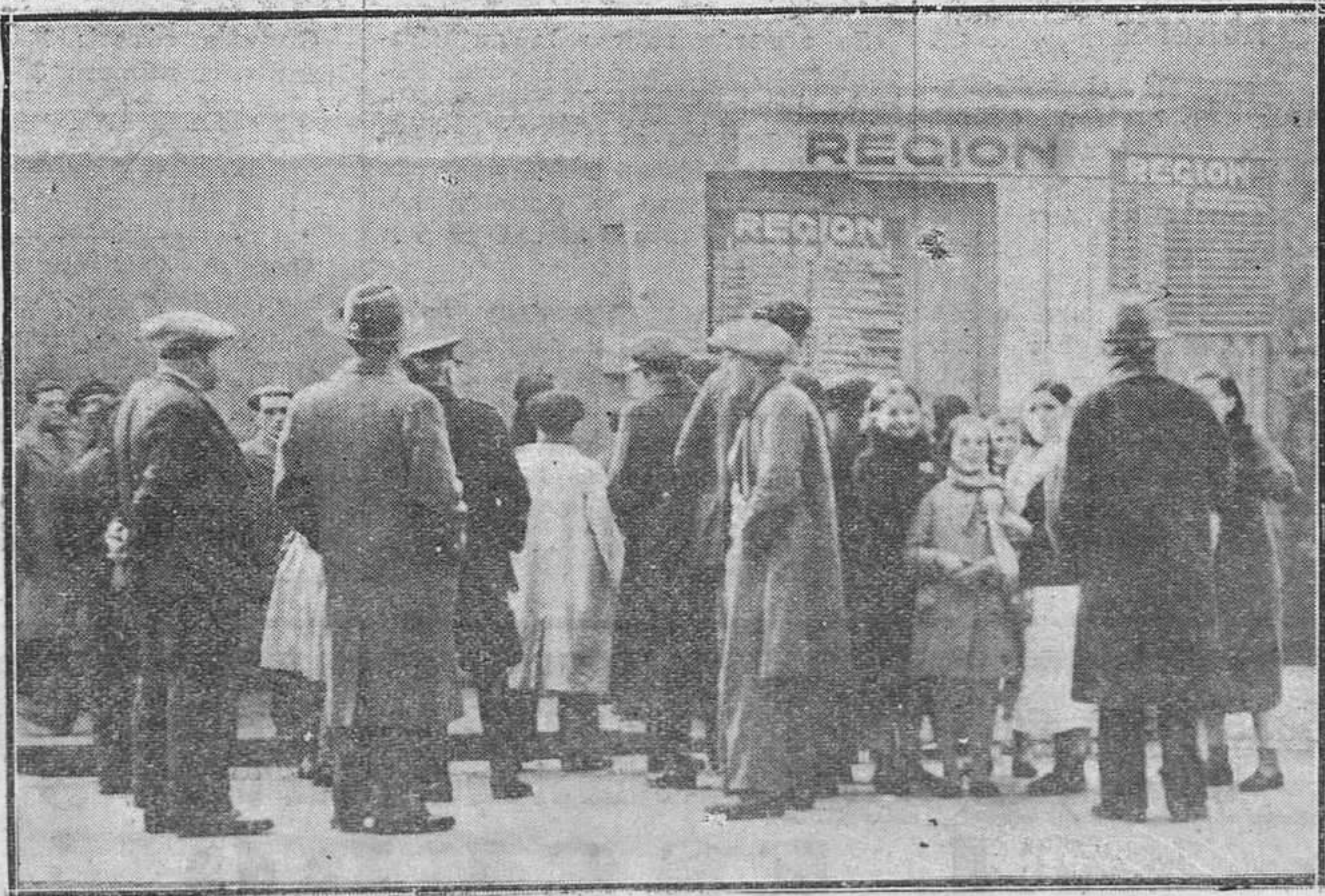
Un momento del desfile de público ante las pizarras de REGION durante el sorteo de la Lotería de Navidad celebrado ayer.

Apósitos. Artículos de goma. Braqueros. Fajas de estómago. Material para Laboratorios y Farmacias. Melquiades Alvarez 6 Teléfono 1179. OVIEDO