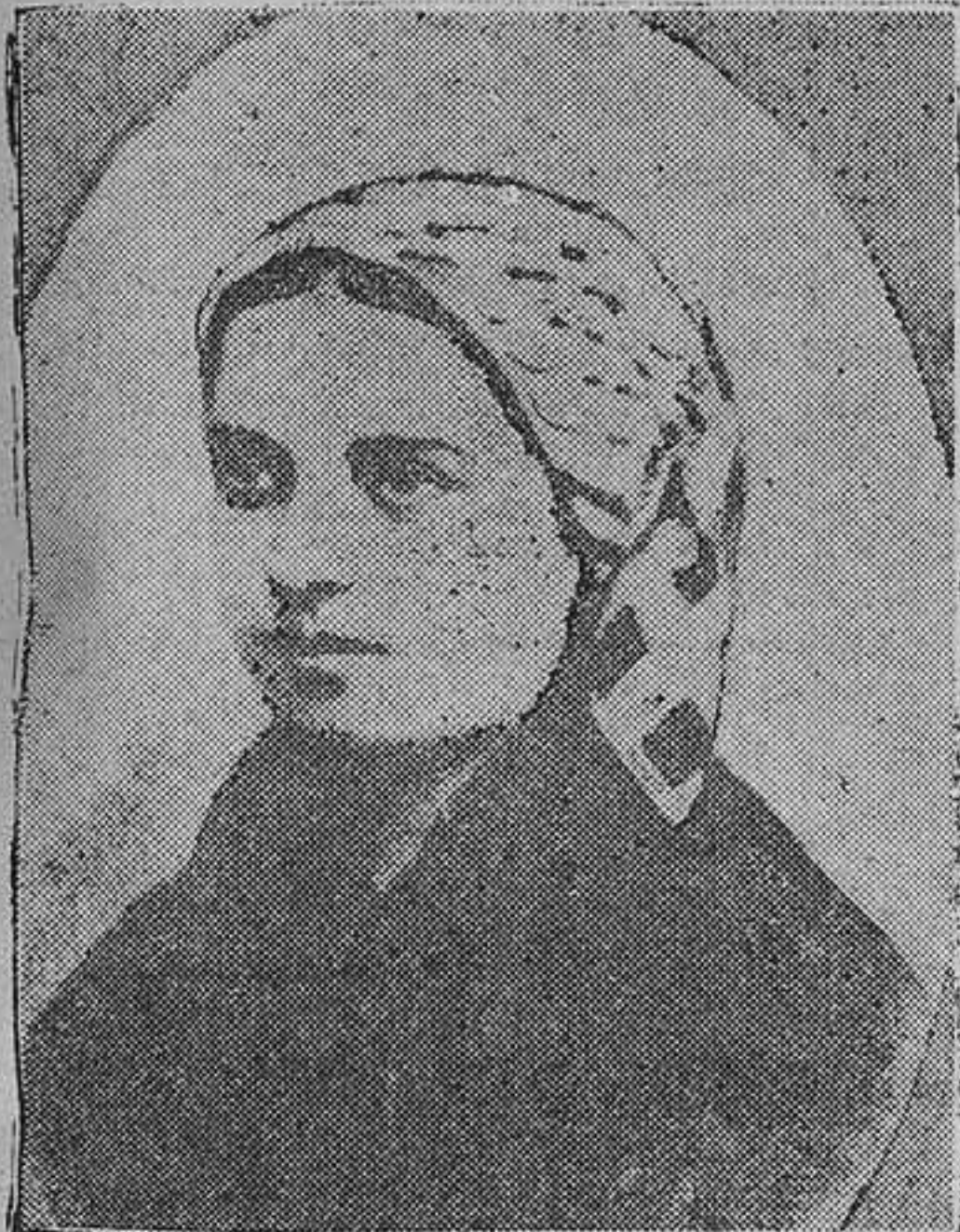
Bernardita Soubirous, la pastoreta de Lourdes.

Todos los años la fiesta de la Inmaculada Concepción de la Virgen atrae la atención de cuantos nos gloriamos de haber recibido de nuestras cálicas madres el incomparable beneficio de la educación católica; pero el próximo viernes hay un acontecimiento, que razonablemente podemos llamar extraordinario: la solemne canonización de la vidueta de Lourdes en la Basílica Vaticana de San Pedro. Francisco Soubirous y su esposa Luisa Castérot recibieron de Dios el 7 de enero de 1844 una niña en su pobre casa—molino de Boly, situado en Lourdes en el barrio de Lapaca. Dos días después era