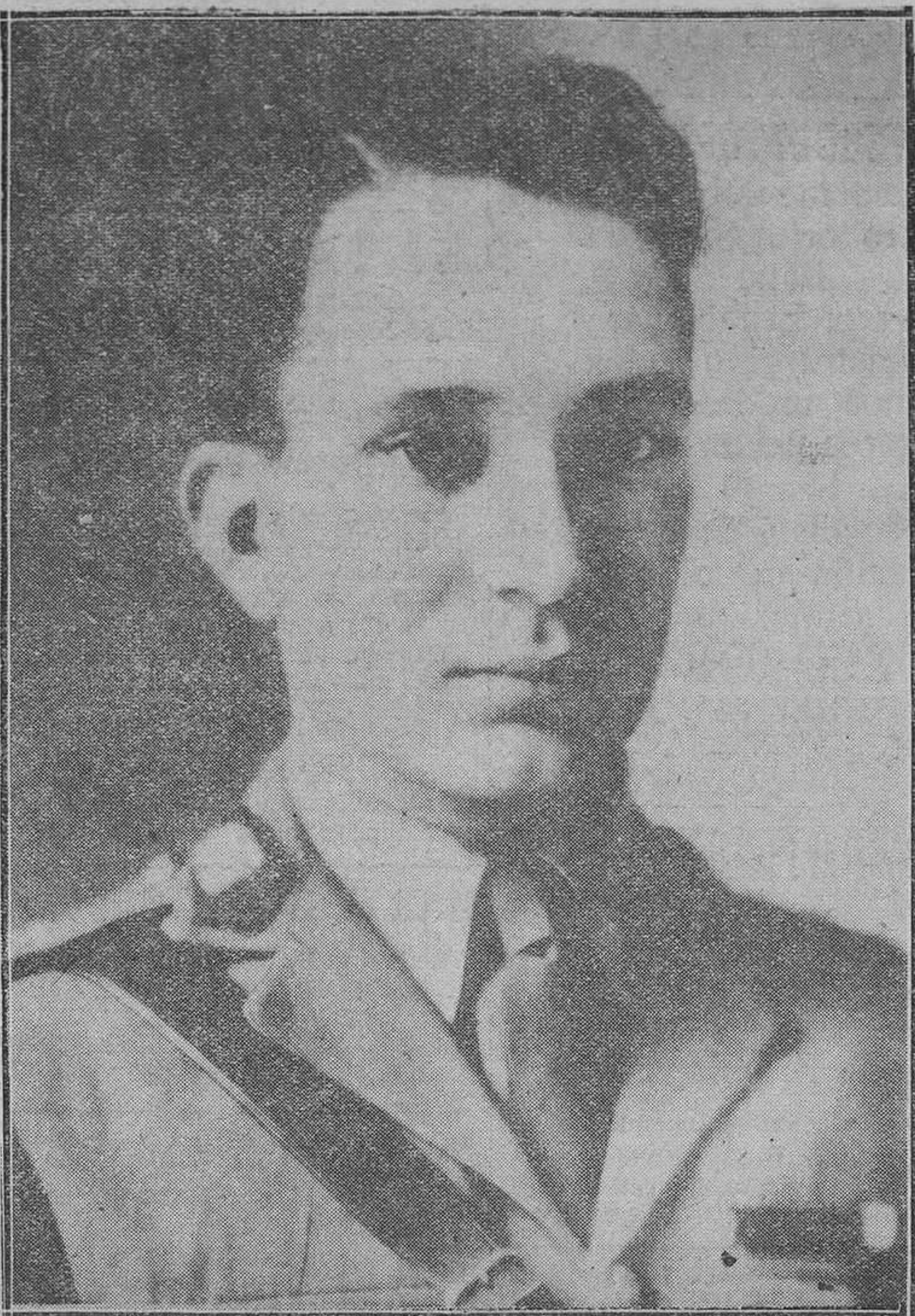
S. M. Ghazi, que ha sido proclamado Rey del Irak, por muerte del Rey Faisal.