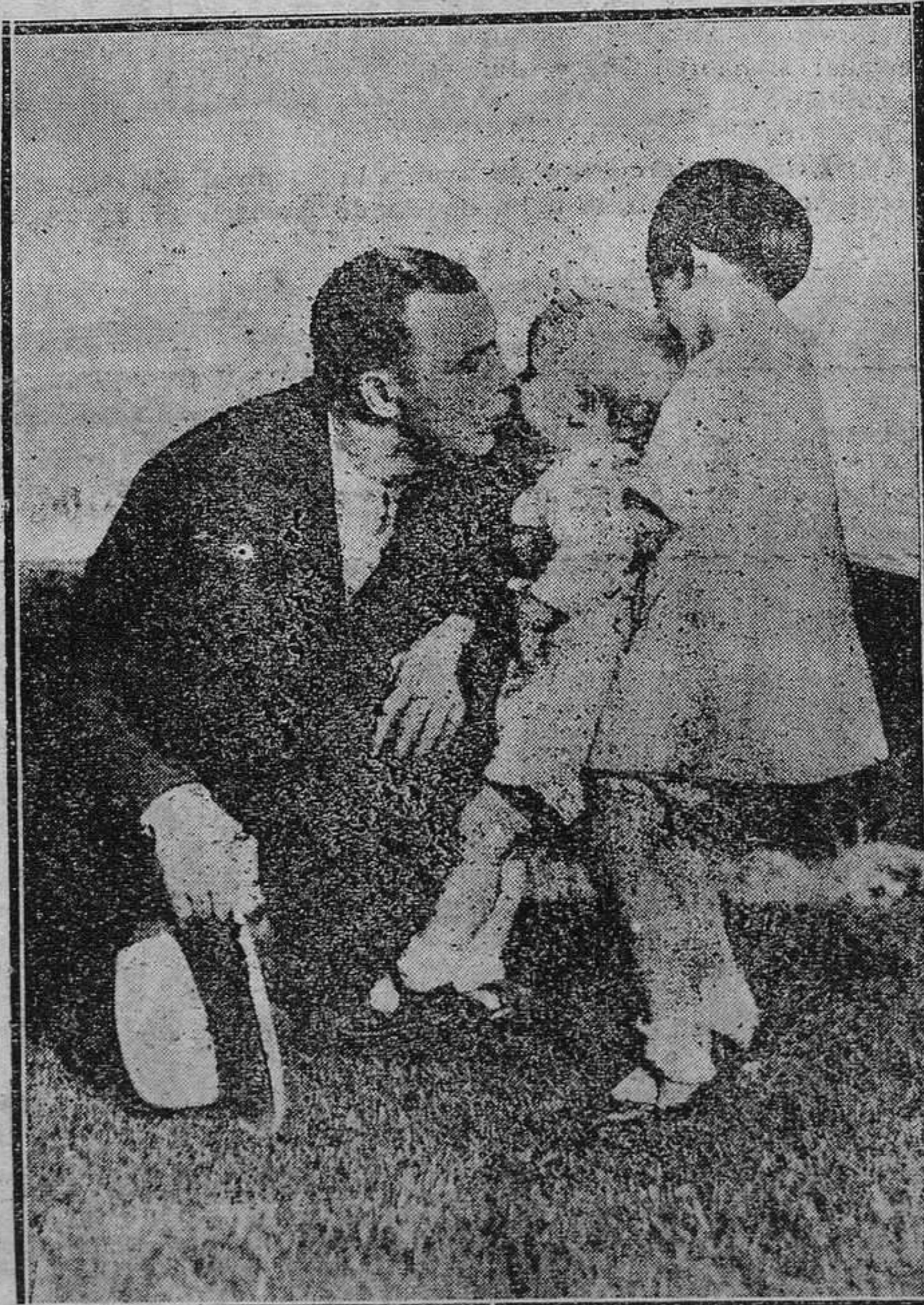
Antes de sensacional combate donde Sharkey perdió el campeonato del Mundo, el ex campeón se fué a Cheslmt Hill, a defender a sus hijos, amenazados de rapto por los "gangsters", por el mismo procedimiento como se raptó al hijo de Lindlberg.