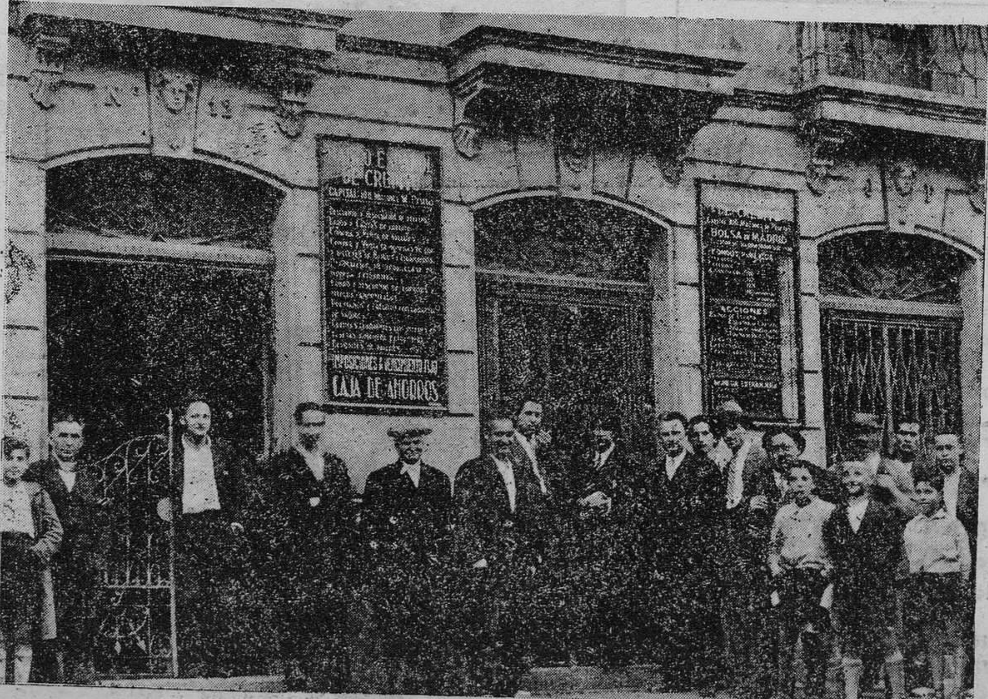
POLA DE LENA.—Del atraco de ayer. Entrada del Banco donde se cometió el atraco.