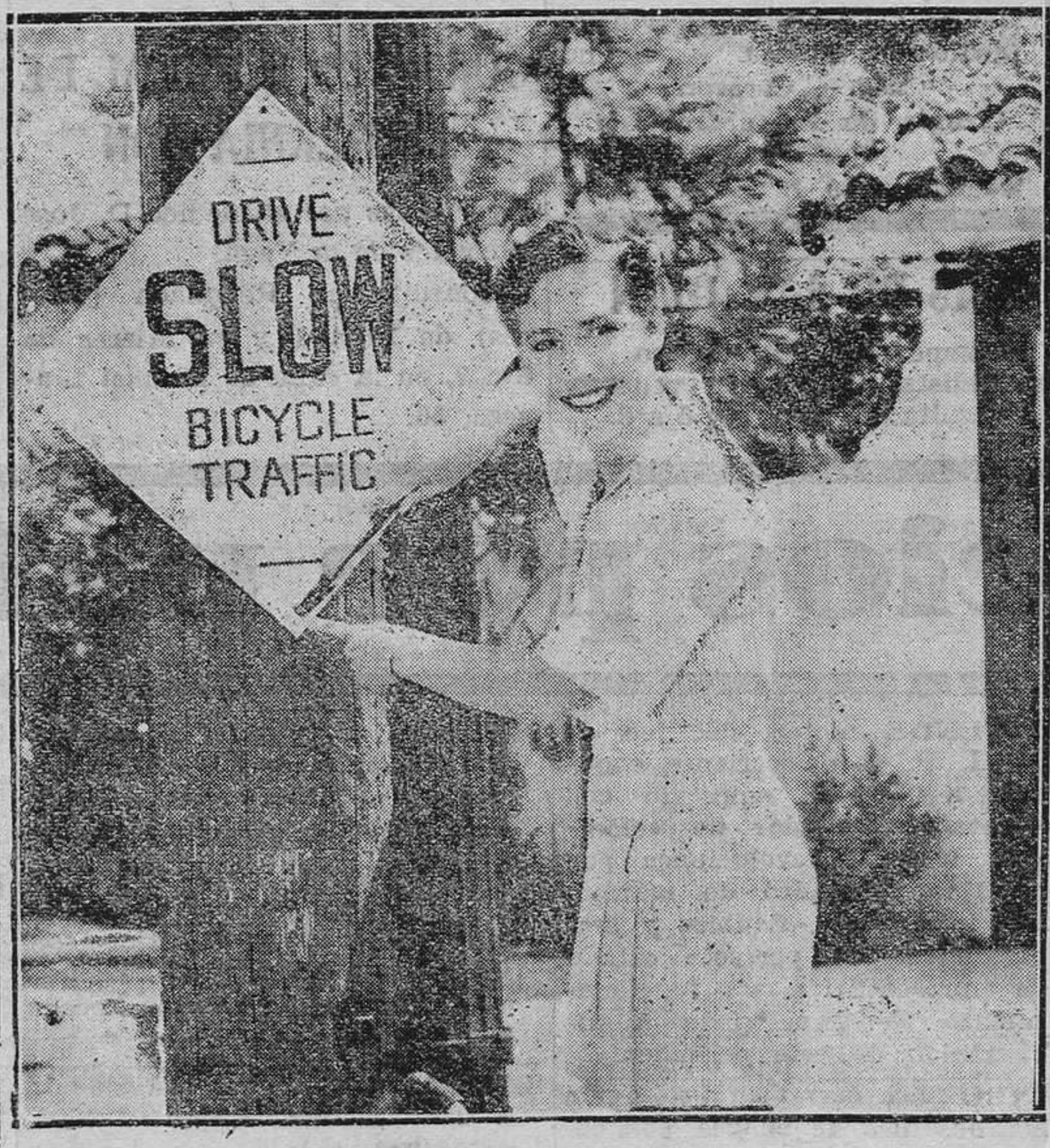
Mae Clarke, gentilísima actriz de la Metro Goldwyn Mayer, entusiasta del ciclismo, ha emprendido una campaña en favor de los que practican ese deporte. Aquí aparece junto a un letrero diseñado por ella misma con ese objeto.

siderándose justa la petición de útiles de trabajo solicitada a la misma empresa por los obreros del cargue.