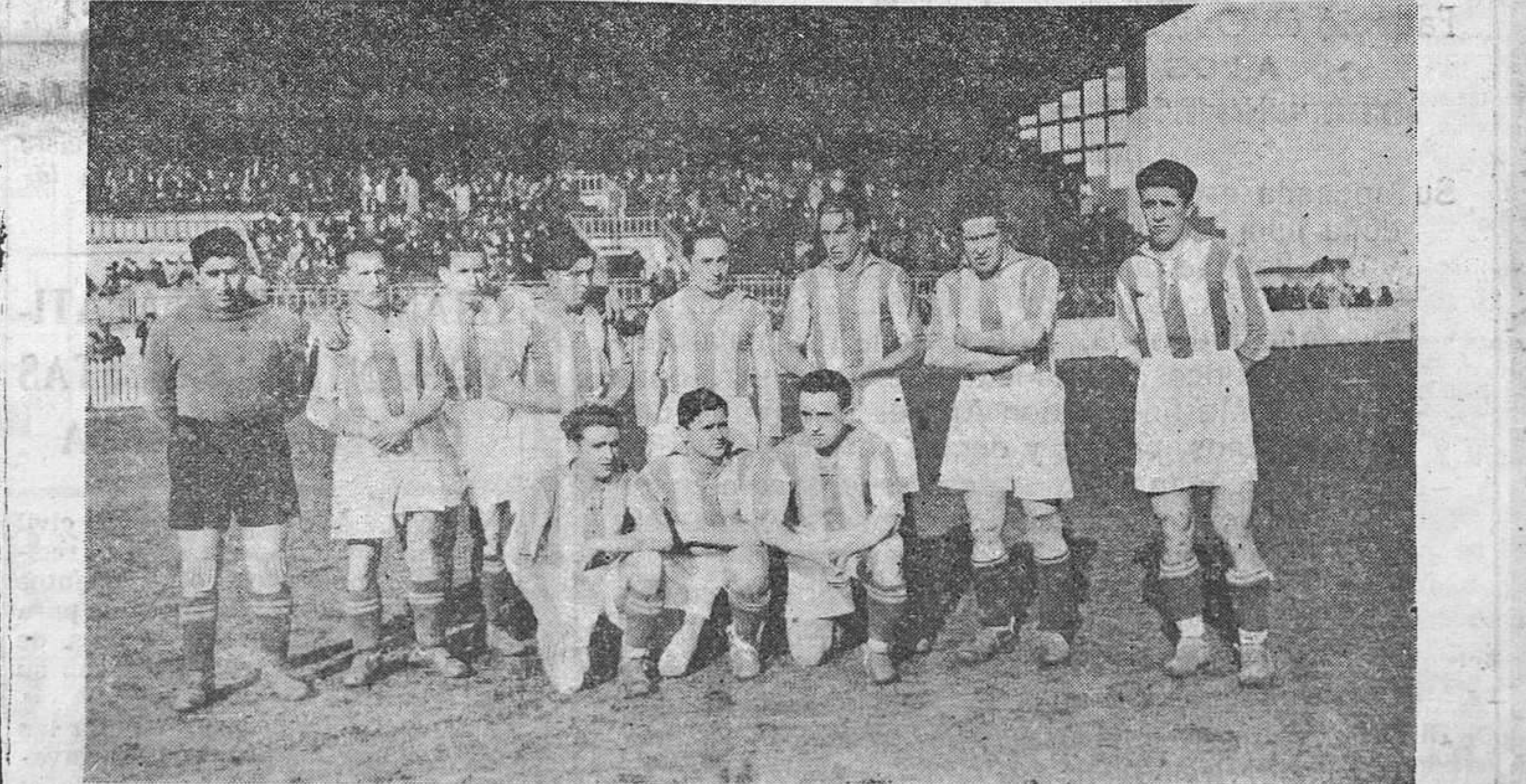
El equipo del Donostia, que el domingo jugará contra el Oviedo en Buenavista. Este encuentro corresponde al campeonato de la Copa de España.