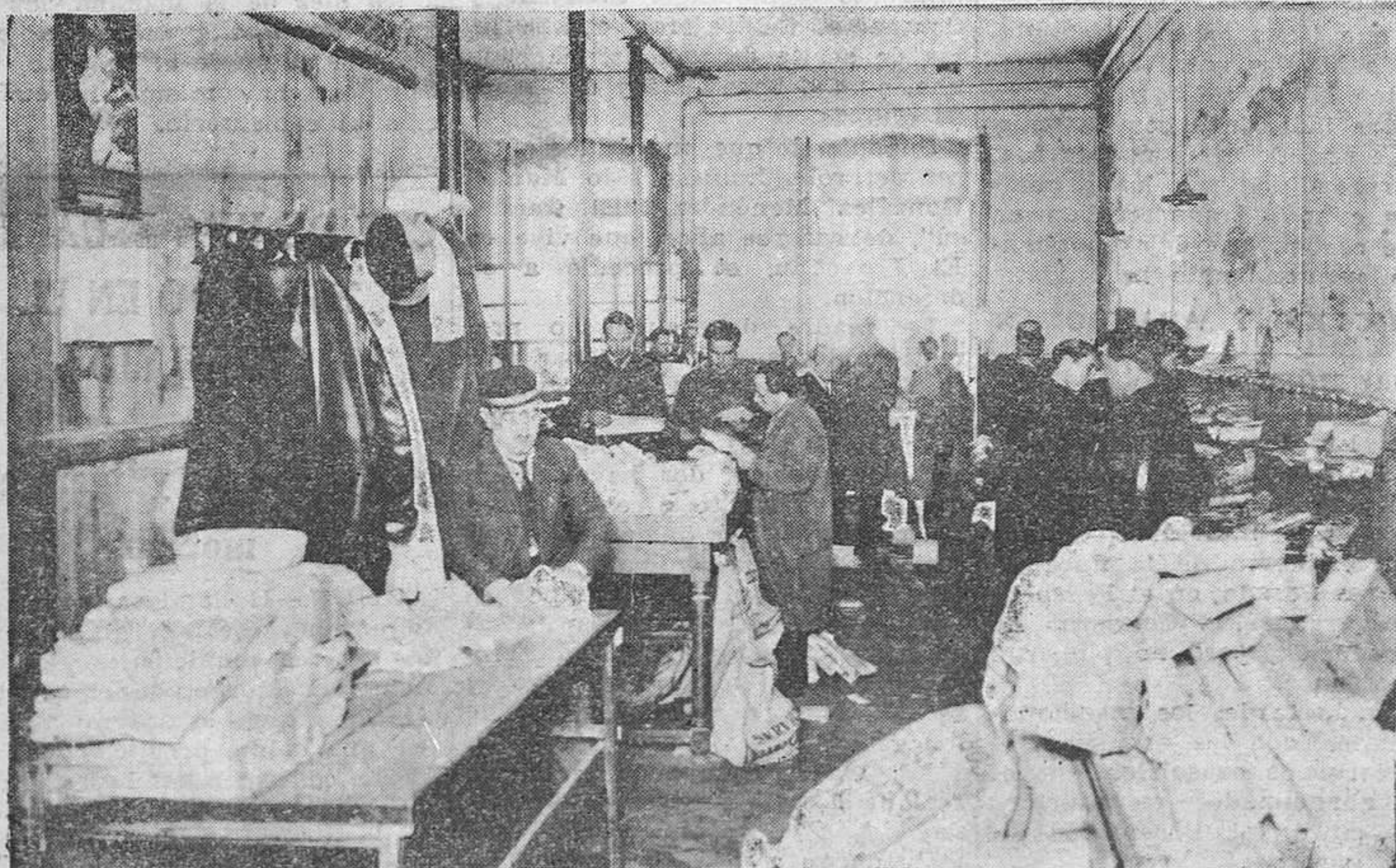
OVIEDO.—Cómo se trabaja en la Administración de Correos.— Ahí, sin espacio para moverse, abajan durante muchas horas varios empleados para distribuir la correspondencia, cuyas sacas se apilan por todas partes, en montones imponentes.

inmediatamente a la sala en que hace la distribución de su contenido, por líneas generales y conducciones. Esta operación sobre todo cuando el tiempo aprmia, cosa que por lo ateriormente expuesto, suele suceder todos los días, debe ser hecha con rapidez vertiginosa, ganando minutos y segundos, para reducir al mínimun las pérdidas de enlaces.