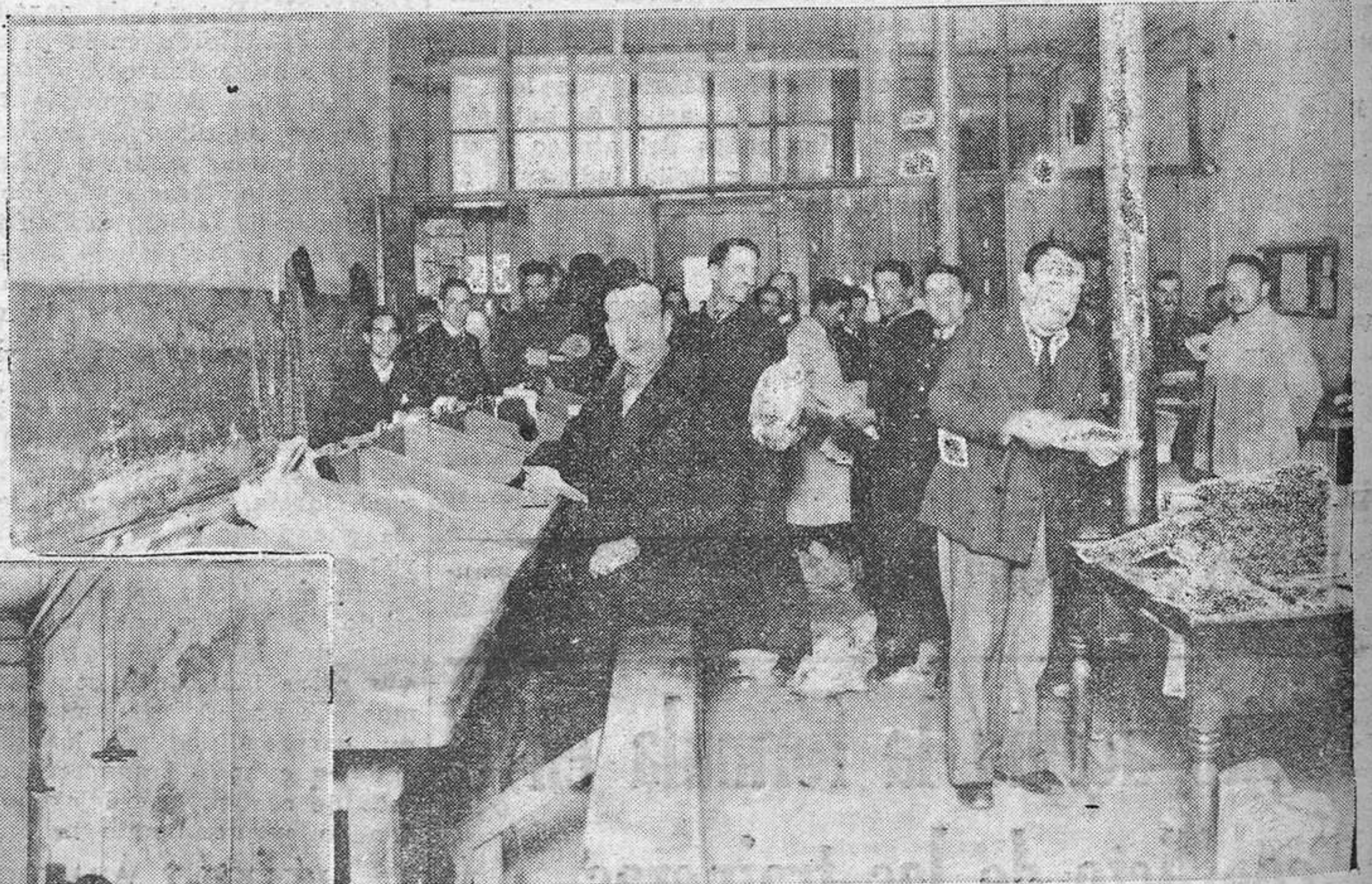
OVIEDO.—Cómo se trabaja en la Administración de Correos.— Parece la cueva del Chapipi, pero es el local donde los carteros distribuyen por calles la correspondencia que van a repartir.