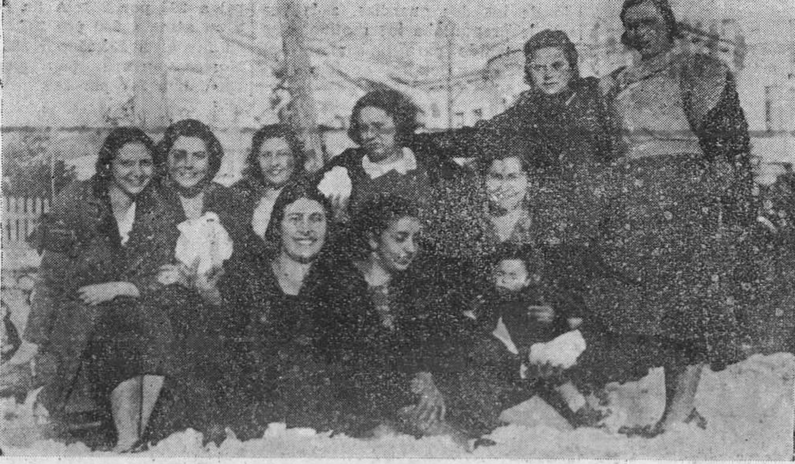
Grupo de distinguidas señoritas de Moreda que acudieron a Felichosa a contemplar los típicos panoramas que ofrecía el pueblo en la última nevada.