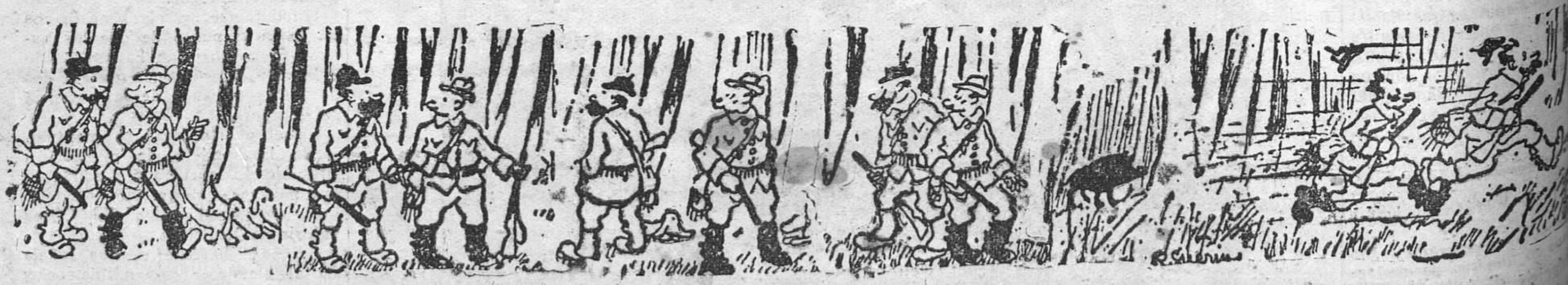
LOS BRAVO SCAZADORES DE JABALIES