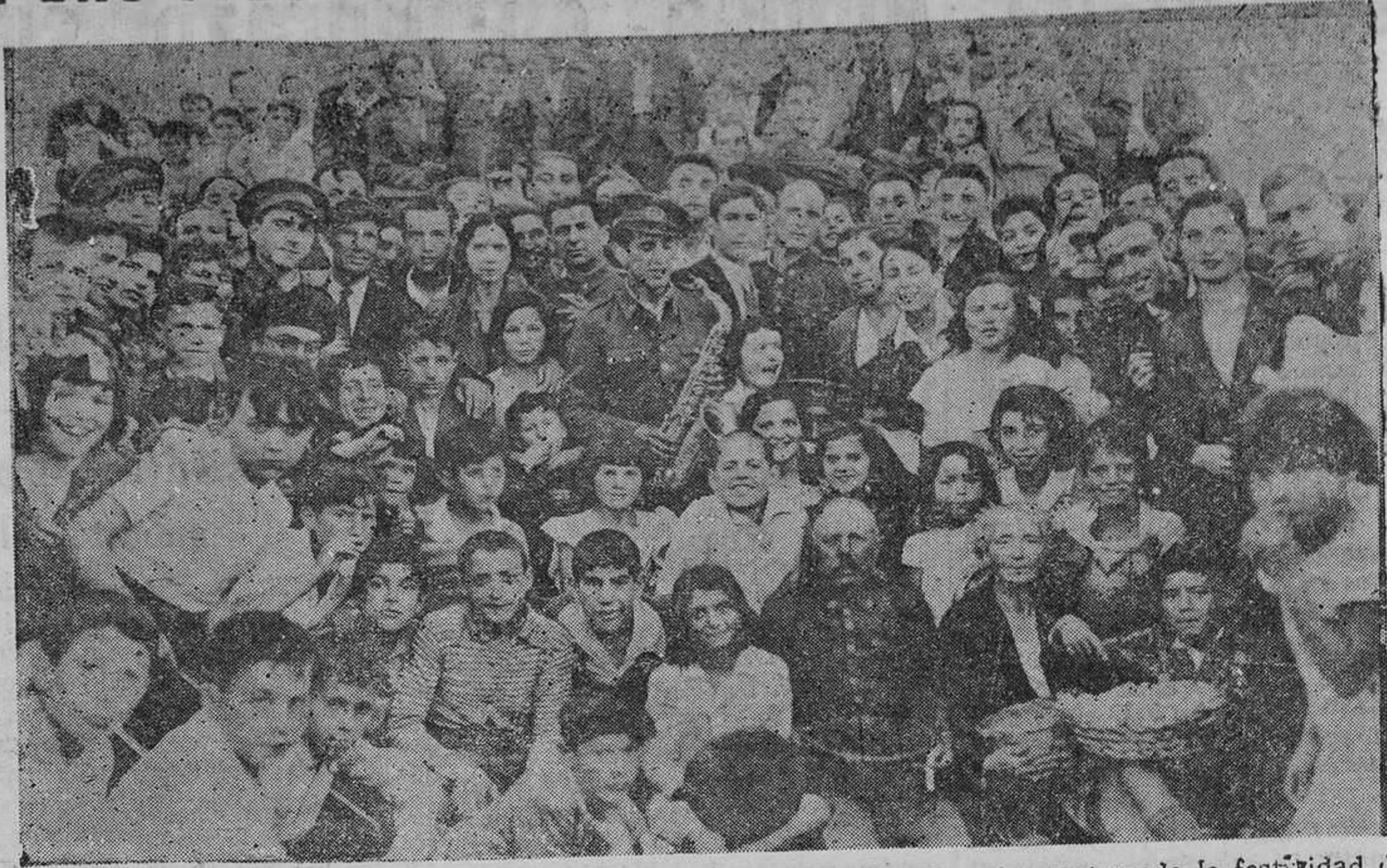
OVIEDO.— Un grupo nutrido de asistentes a la gran romería que, con motivo de la festividad de San Juan, se verificó el domingo en La Corredoria.