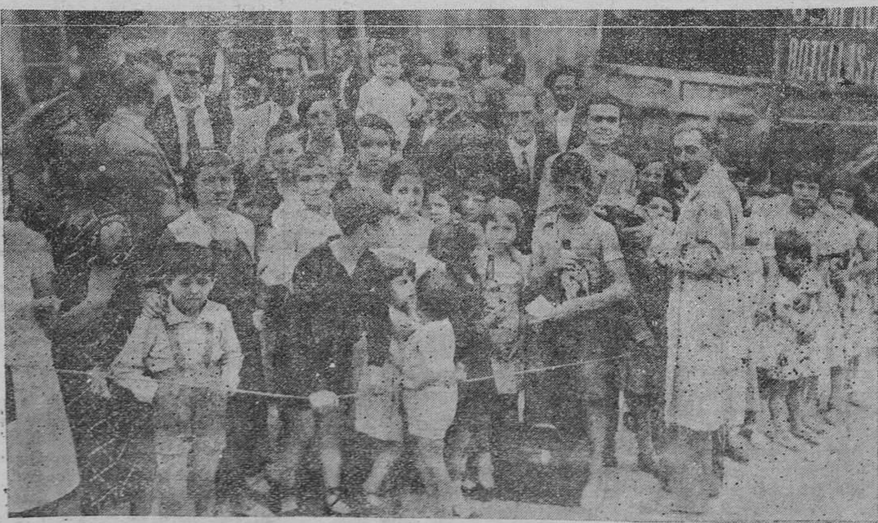
OVIEDO.— El reparto de bolla y vino a los cofrades de la Sociedad San Isidoro, fiesta celebrada el domingo.

Ideal para Hospitales y Sanatorios, así como en habitaciones donde haya enfermos. De venta en droguerías y Productos Dragón, Gijón.