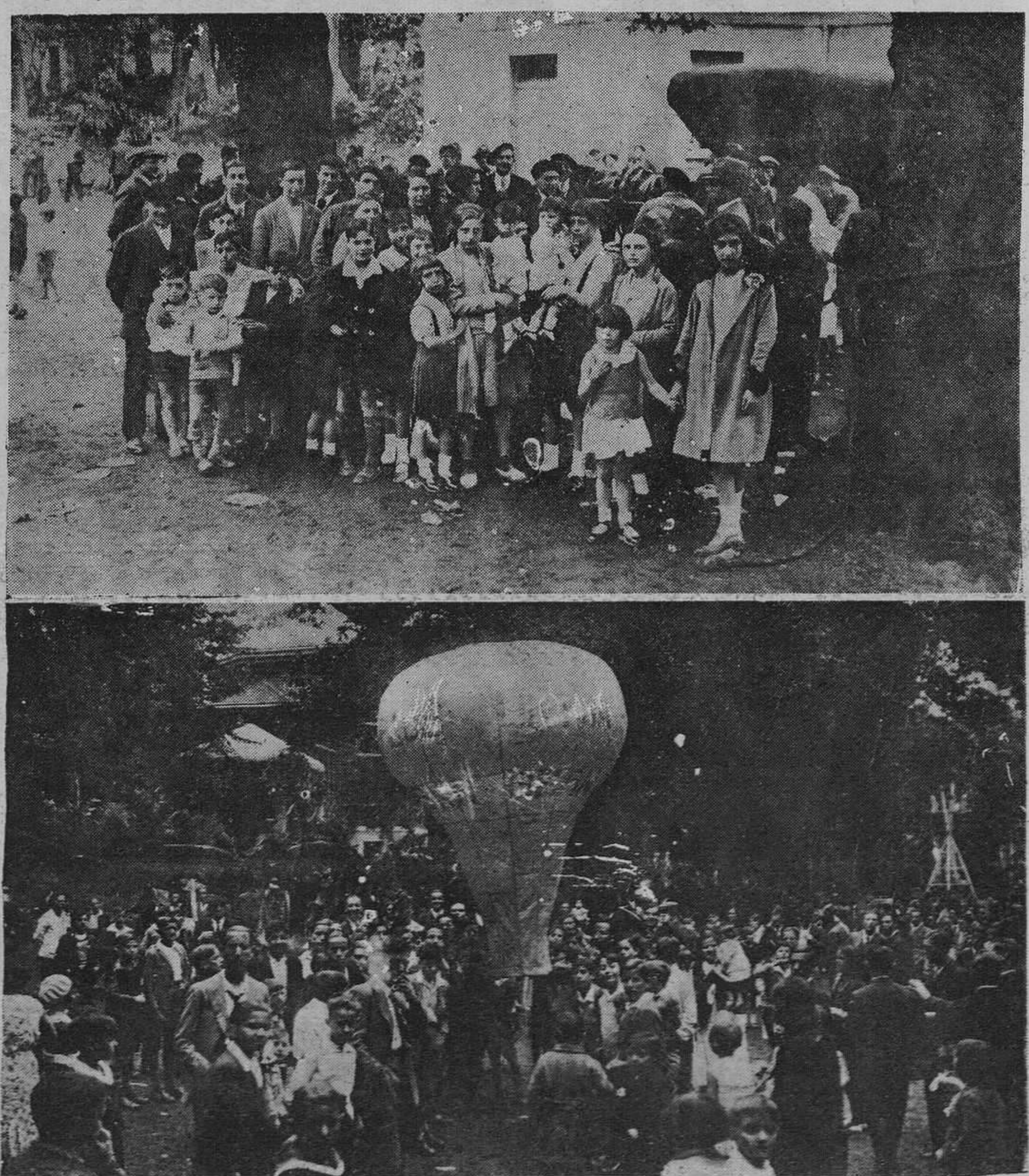
ARRIBA.— Un grupo de asistentes al reparto de l vino. ABAJO: Suelta del tradicional globo.

El tribunal de acuerdo con el letrado, absolvió al procesado.