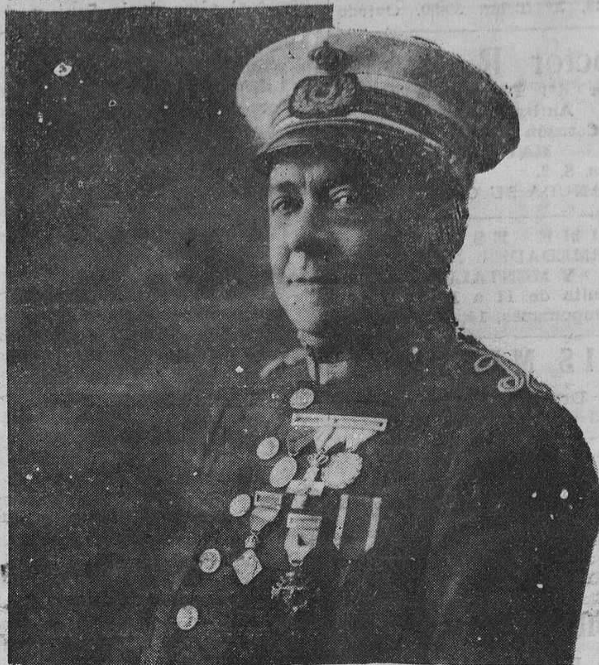
El mes de mayo, director de la Banda Municipal de Madrid, a la que va a rendirse un gran homenaje con motivo de cumplirse el XXV aniversario de su creación.