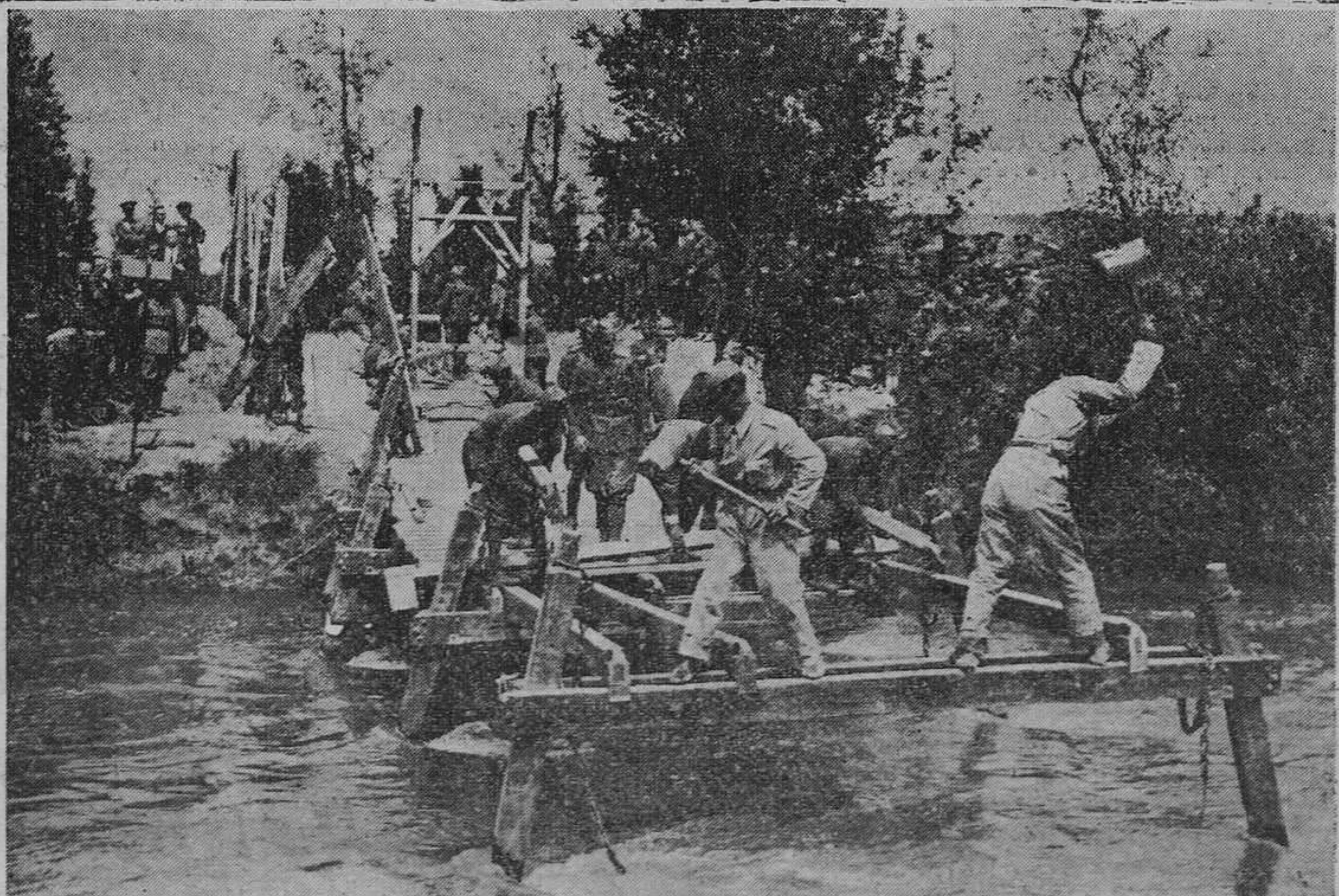
MADRID.— Maniobras del "curso de coroneles" en los alrededores del río Jarama: tendido de un puente.