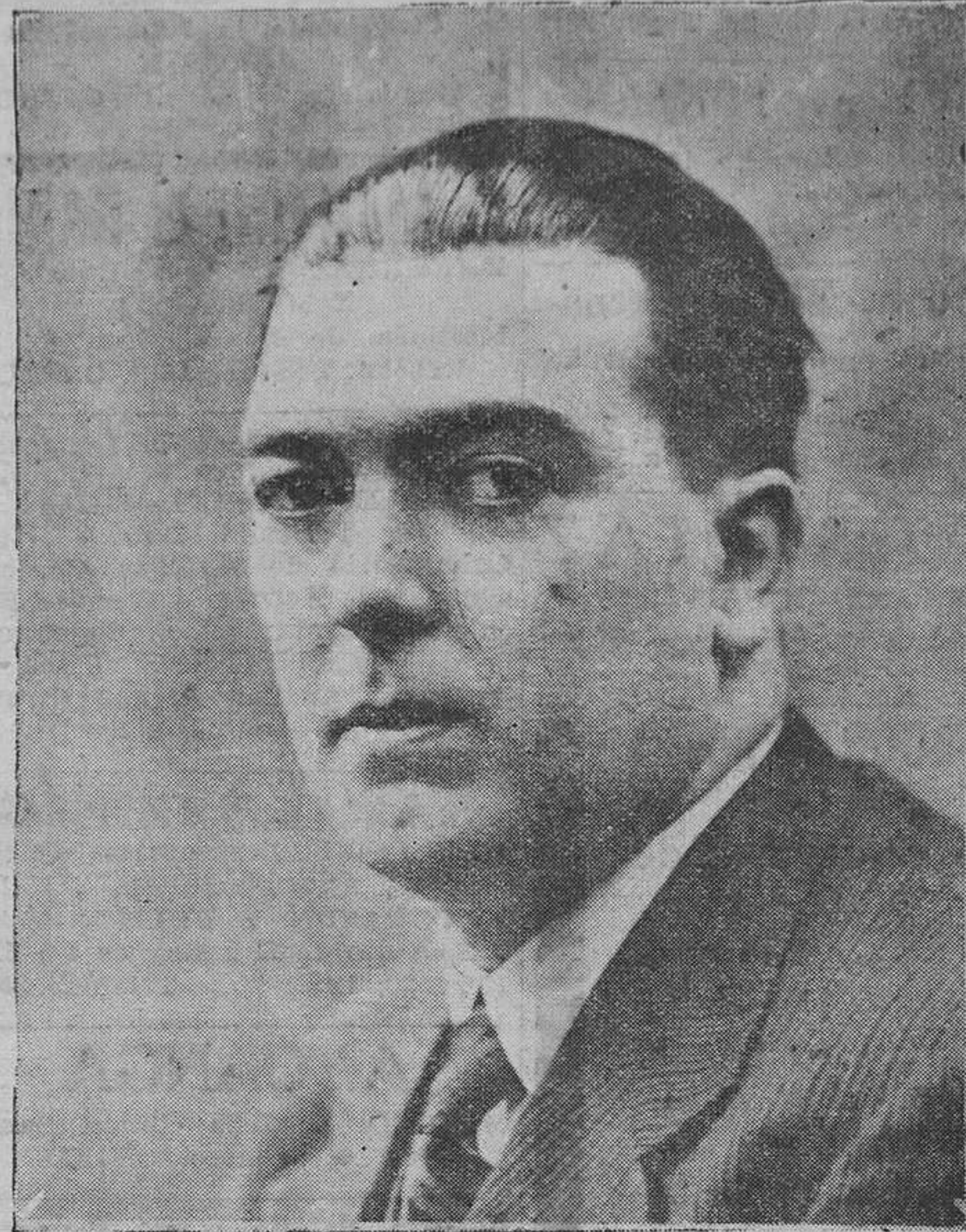
El ministro de Estado, señor Pita Romero, nombrado embajador extraordinario y plenipotenciario cerca de Su Santidad.