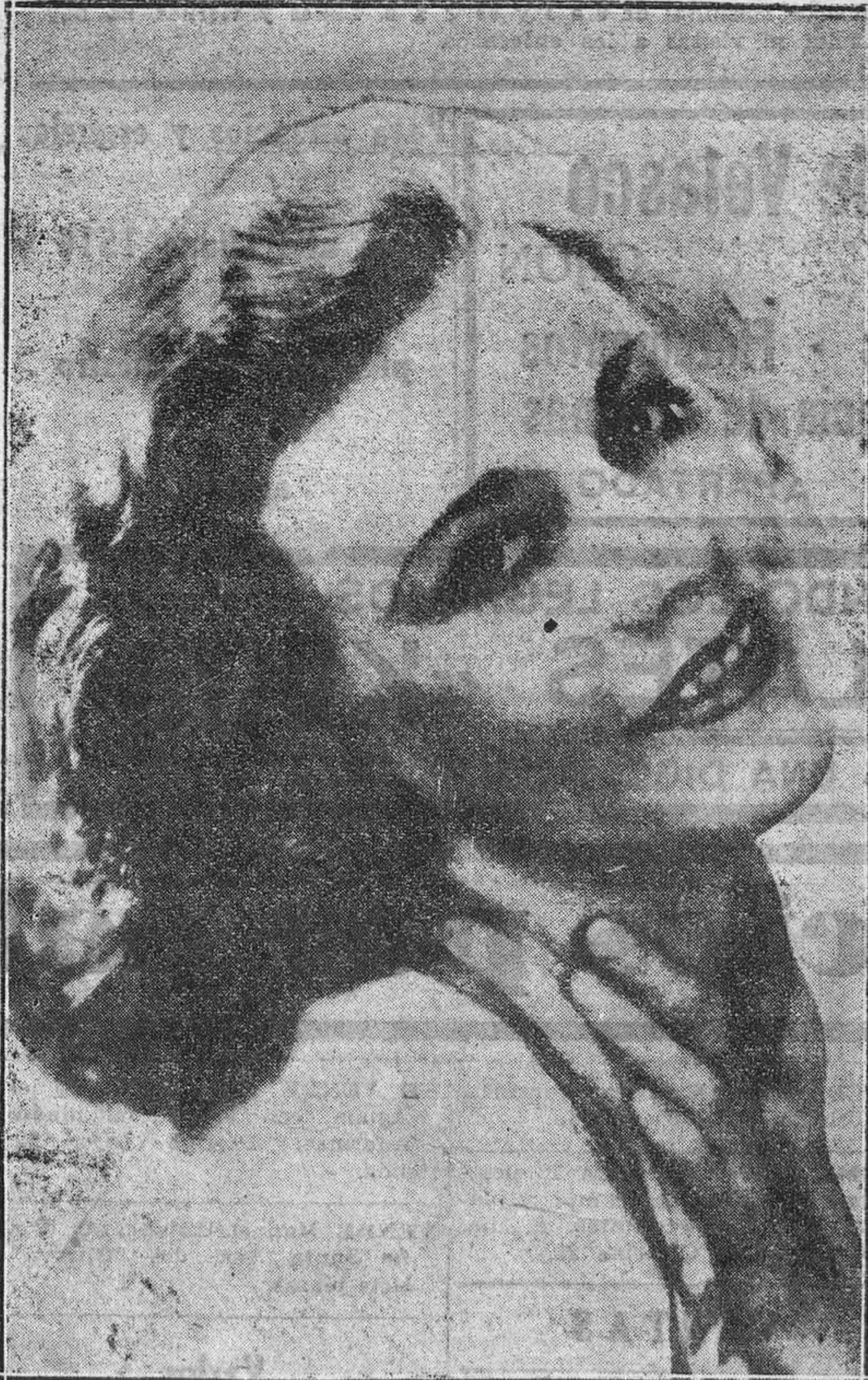
Ginge Rogers, joven estrella norteamericana, protagonista de "La extraña misión del Nordland", película en que desempeña maravillosamente el papel de Sally, bella muchacha de la que están enamorados tres marinos: Bill Boyd, Robert Armstrong y James Gleason. Y, naturalmente, es a Bill Boyd a quien prefiere.