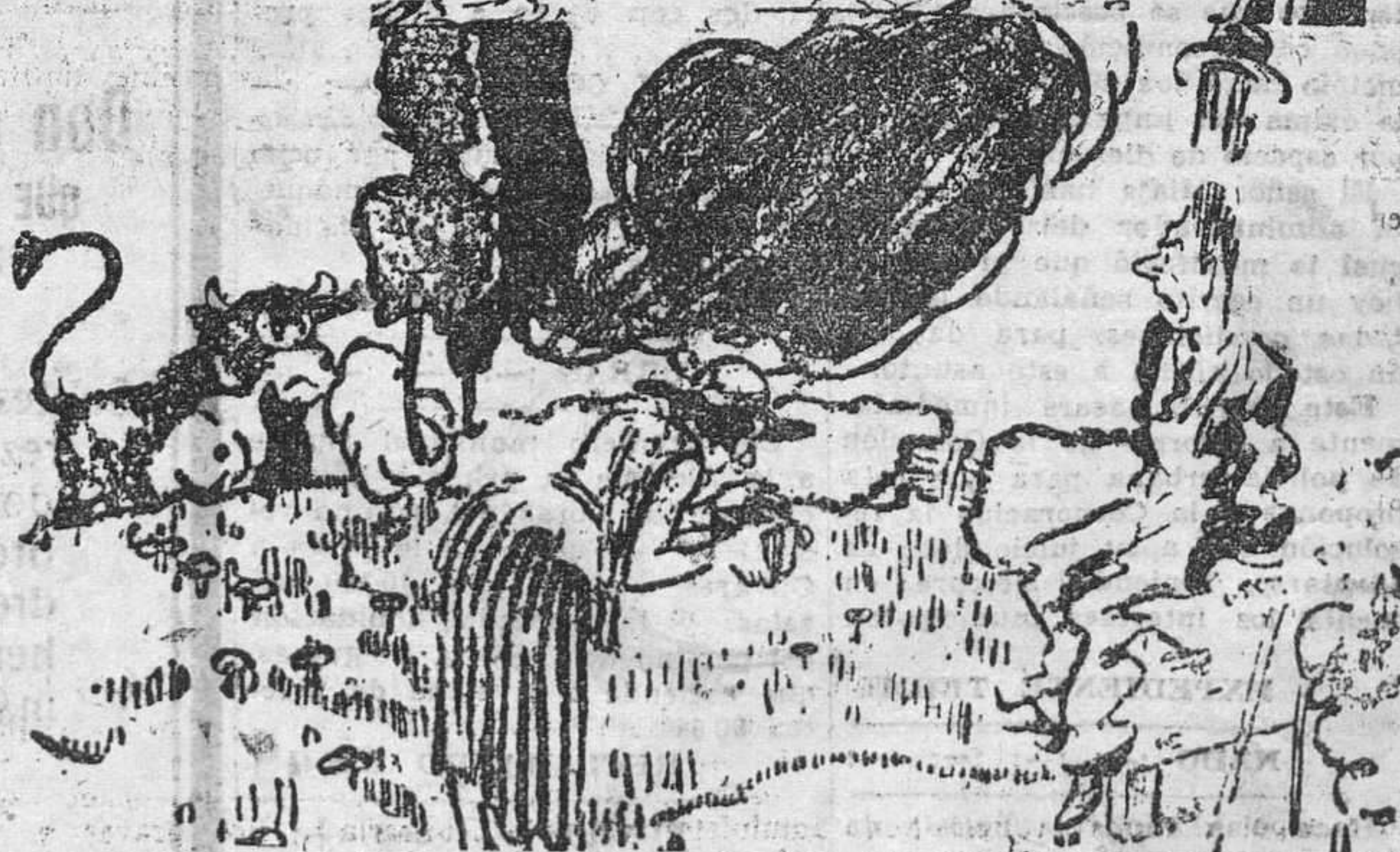
—Le repito que no tengo. —Pero es que la señora me ha dicho que le lleve de todas maneras media cabeza de cerdo. —Pues como no quiera que me parta la mía. (De "Moustique", Charleroi.)