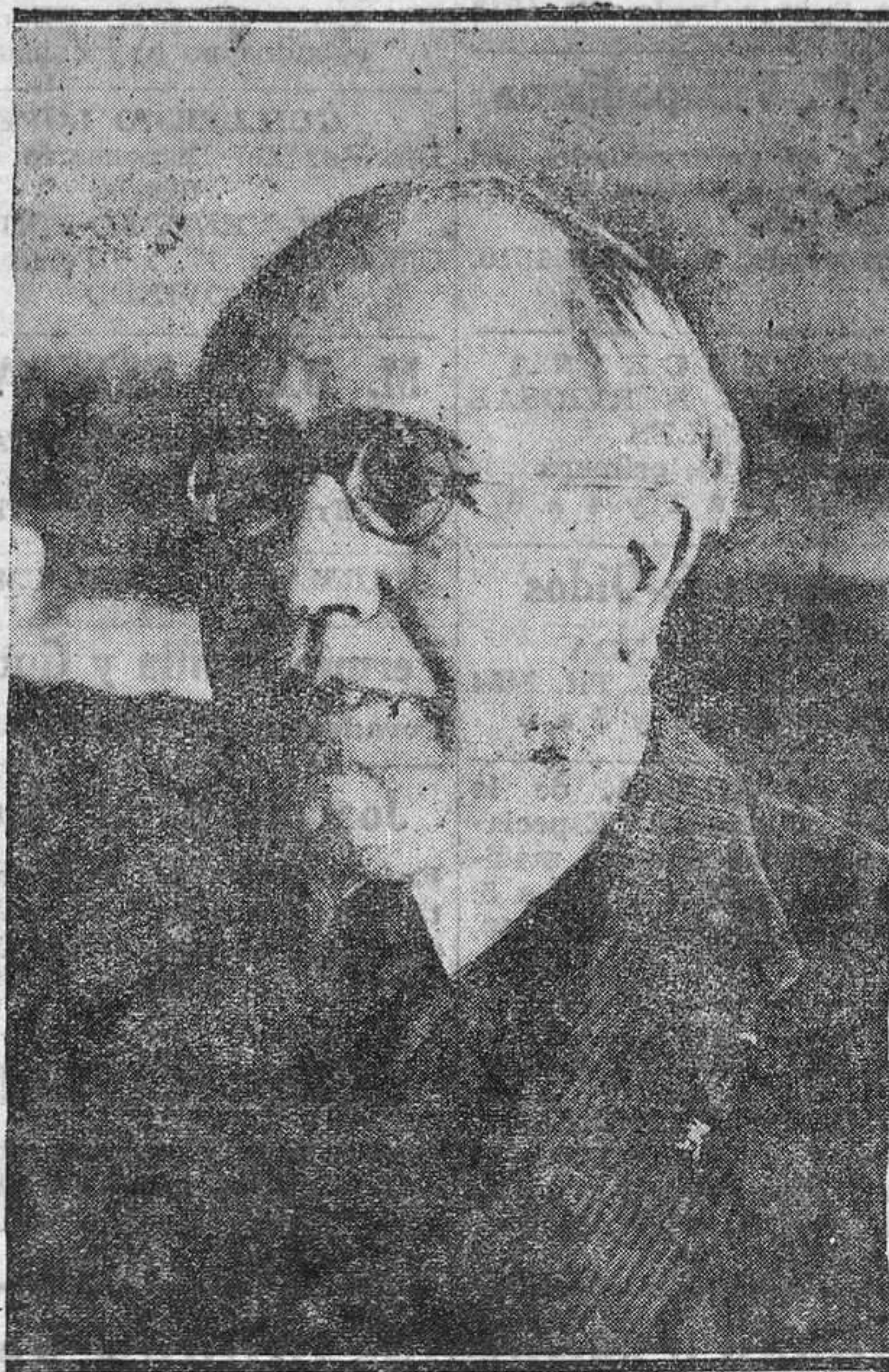
El jefe del Gobierno don Manuel Azaña que ha dado ayer una satisfacción al país, planteando la crisis de fondo.