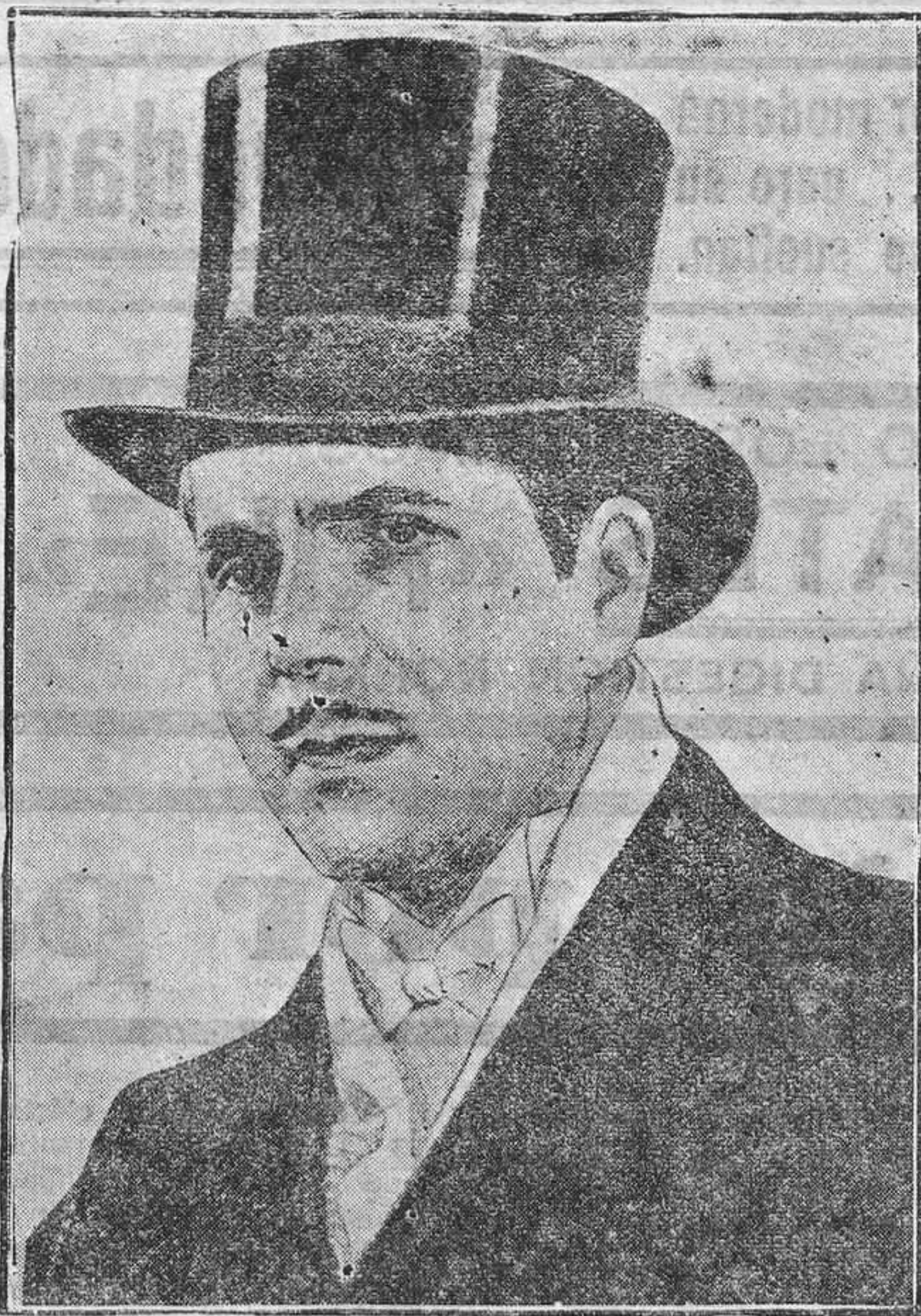
Warner Baxter, uno de los más famosos astros de la pantalla desde su actuación en "Ramona", con Dolores del Río, que recientemente ha conseguido un nuevo triunfo en "Seis horas de vida", con Miyam Jordan.