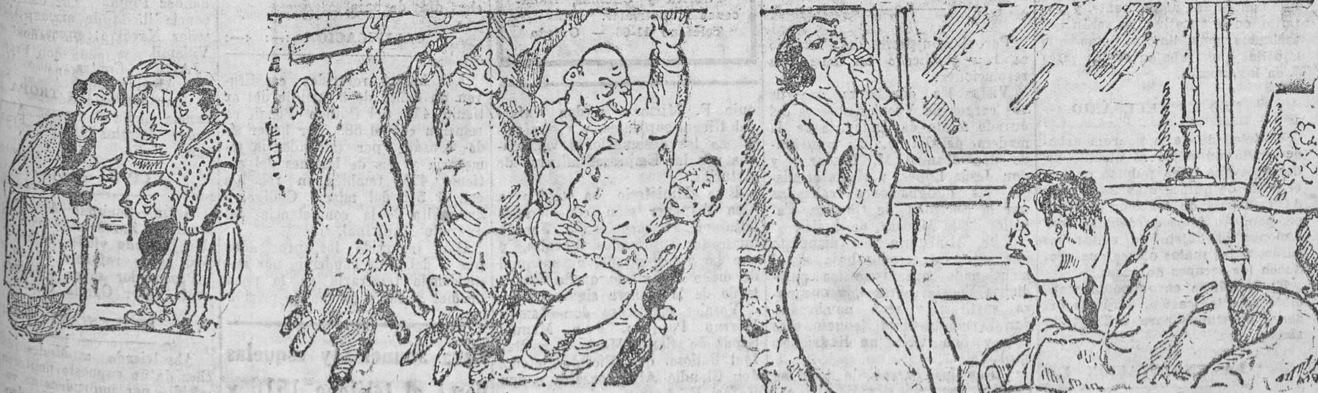
—La tía no volverá a darme un beso mientras tengas la cara tan sucia. —Me alegro saberlo.

Mañana, a las cinco, INFANTIL. A las 7,30 y 10,45, LA SIRENA DEL PALACE. Por Adolfo Menjou.