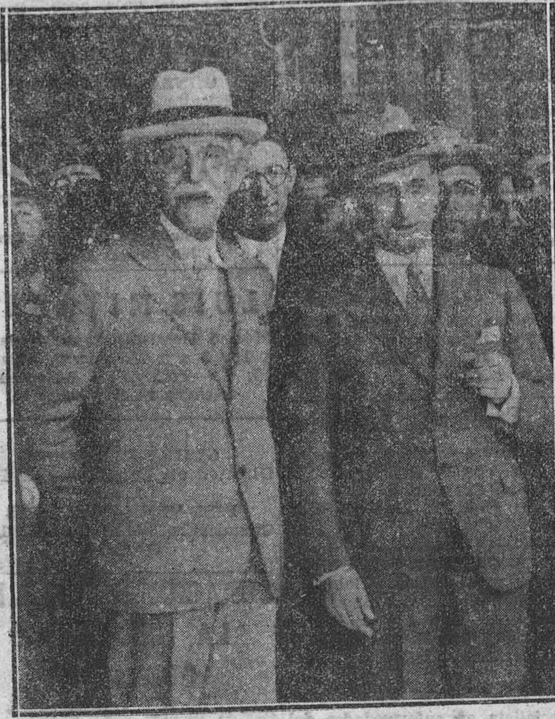
El presidente de la Generalitat de Cataluña, señor Macià, a su llegada a Madrid, siendo recibido en la estación de Atocha por el ministro de la Gobernación, señor Casares Quiroga