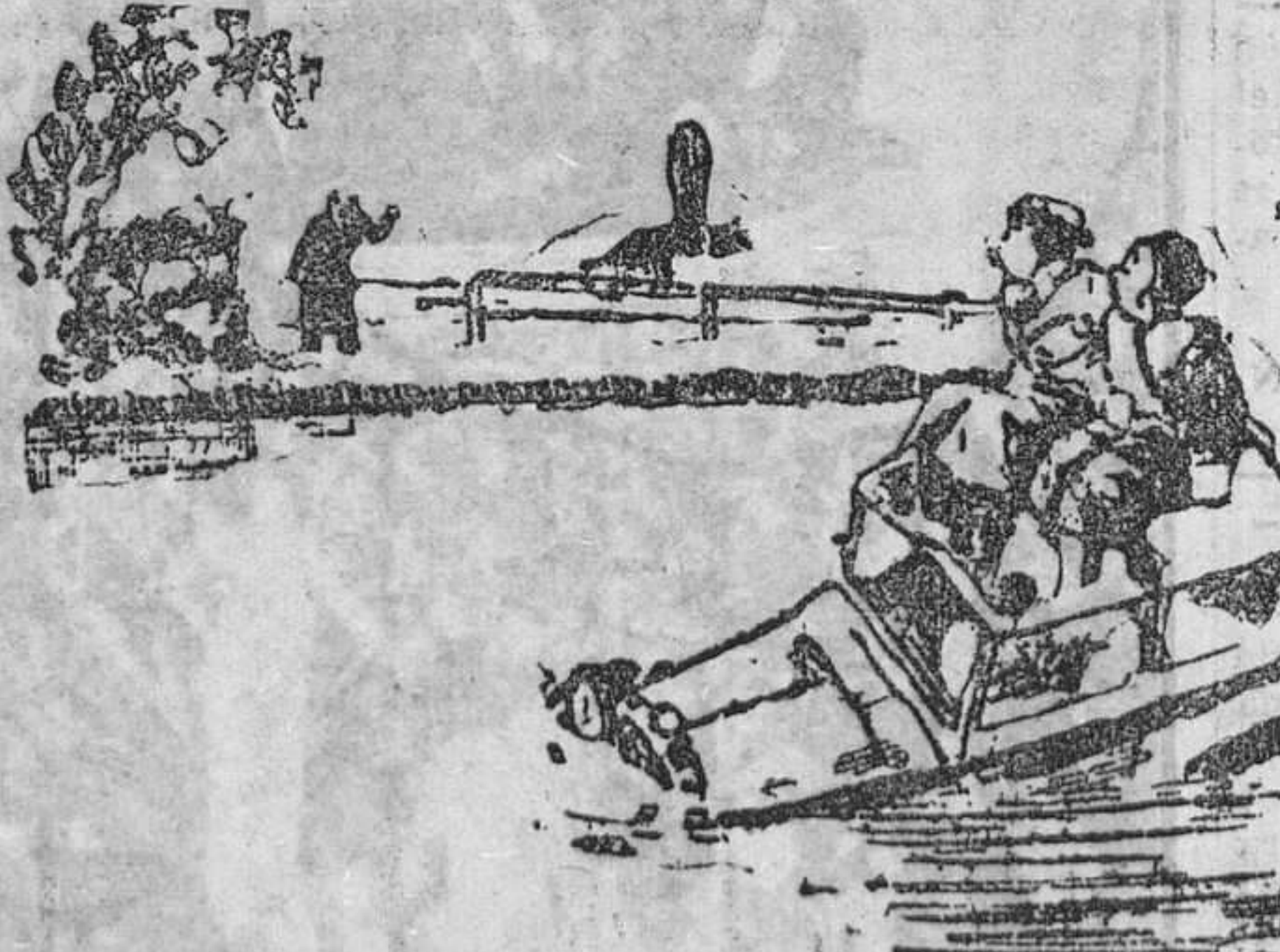
EL AMIGO DICHARACHERO. Si yo creía que no iba a hacer el crucero hasta junio.