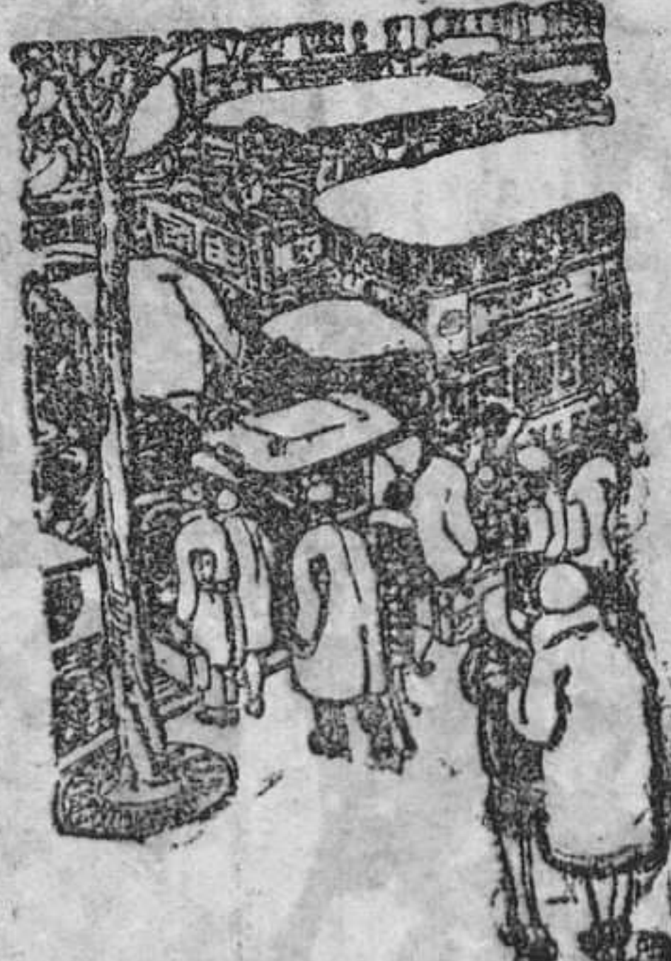
—Adiós, hija mía. Que llegues bien a la acera de enfrente.