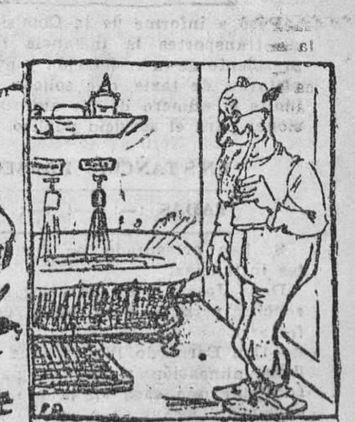
EL PROFESOR DESMEMORIADO.—¿Para qué habré dejado abiertos los grifos?