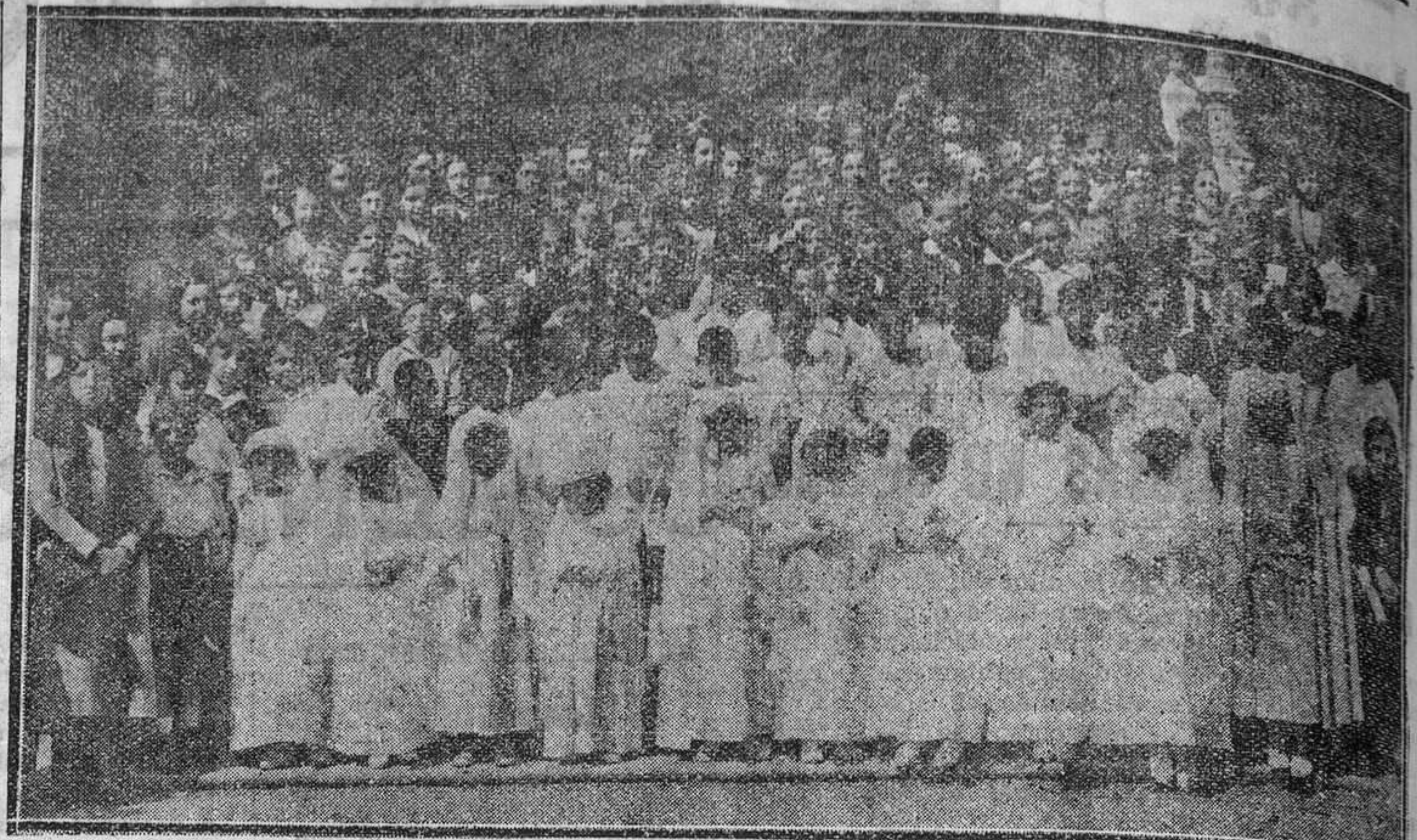
OVIEDO.—Niñas y niños de la Catequesis del Fresno que el pasado domingo hicieron la primera comunión en San Isidoro. (Foto Mena).

(403 m) 18: Para los filatelistas.—18,30: Radiocrónica.— 18,45: Correspondencia hablada de las emisiones Radio-Ginebra.—19: Algunos pasajes de la crónica de Ana Magdalena Bach.—19,20: "Cantata de Bach núm. 106.—19,55: Concierto por la Broadcasting Serenaders.—20,50: Últimas noticias. Boletín Meteorológico.—21 :Concierto.—21,30: Los trabajos de la Sociedad de Naciones.