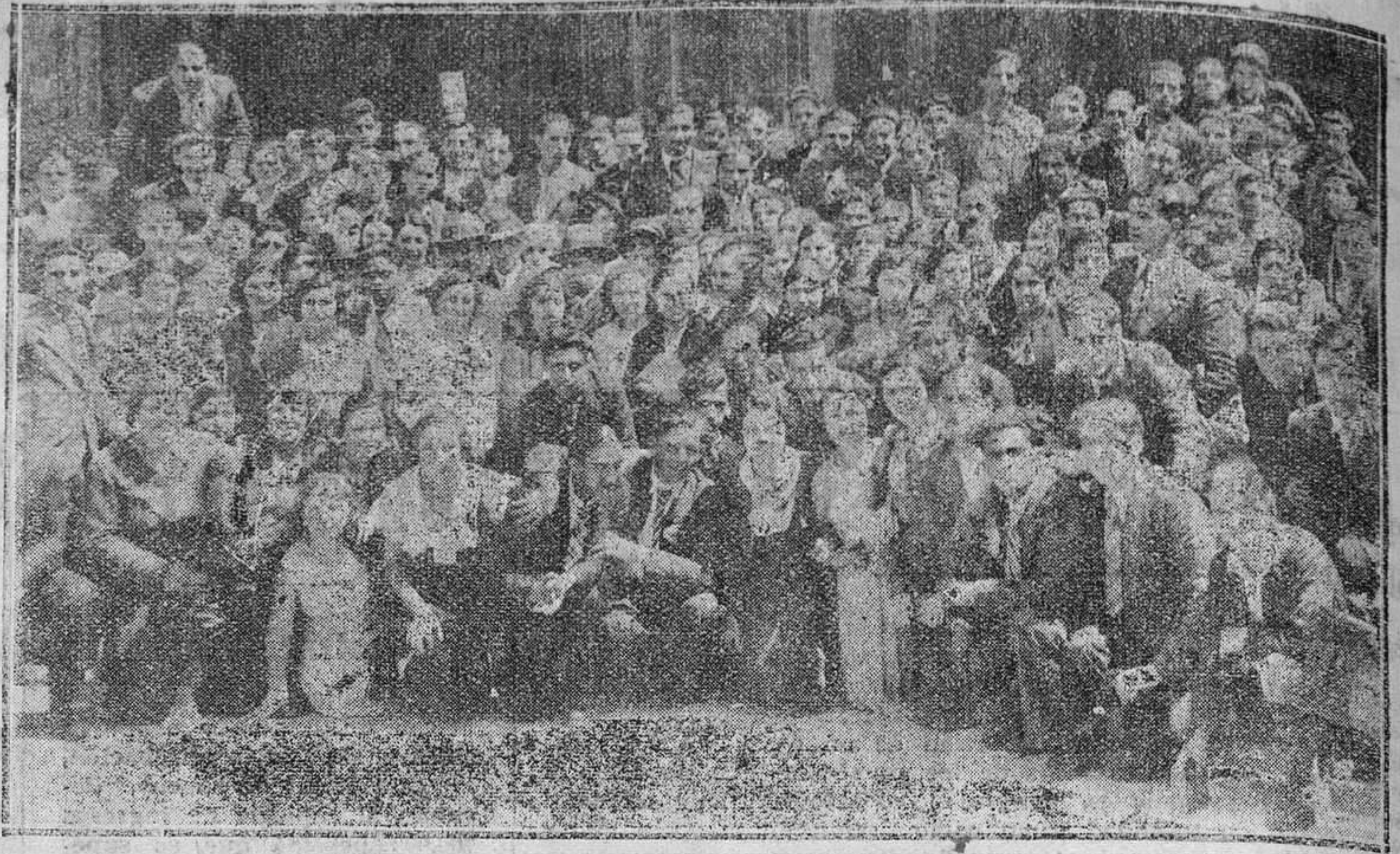
OVIEDO.—Alumnas de la Normal de Maestros de León, durante su visita de ayer a la ciudad.