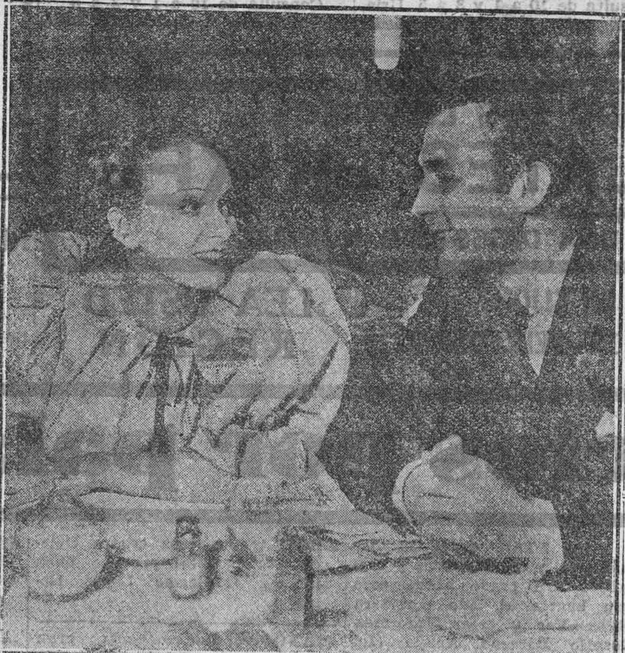
La inquietante Marlene Dietrich, acompañada de Brian Aherne, que por primera vez trabaja para el cine en "The Song of Songs", con la famosa estrella alemana.