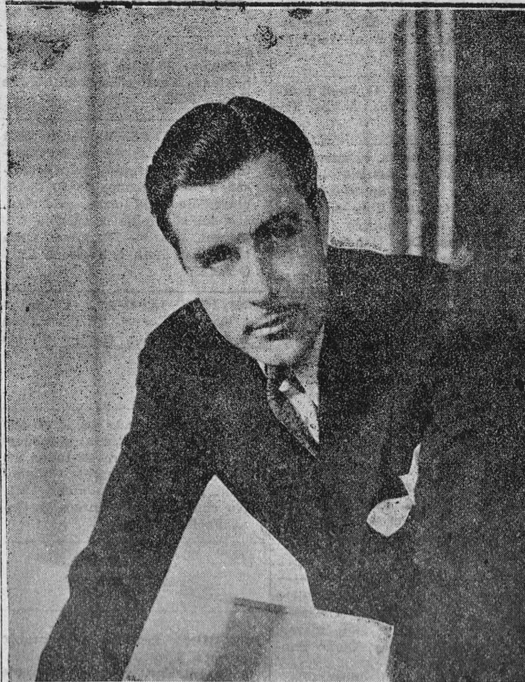
John Boles, actor de magnífica voz, que filma "Mis Labios Engañan" con la famosa estrella europea Lillian Harvey en los estudios de la Fox en Hollywood. Terminada esta producción, Lillian Harvey filmará una película con Henry Garat, célebre galán francés contratado por la misma Empresa.