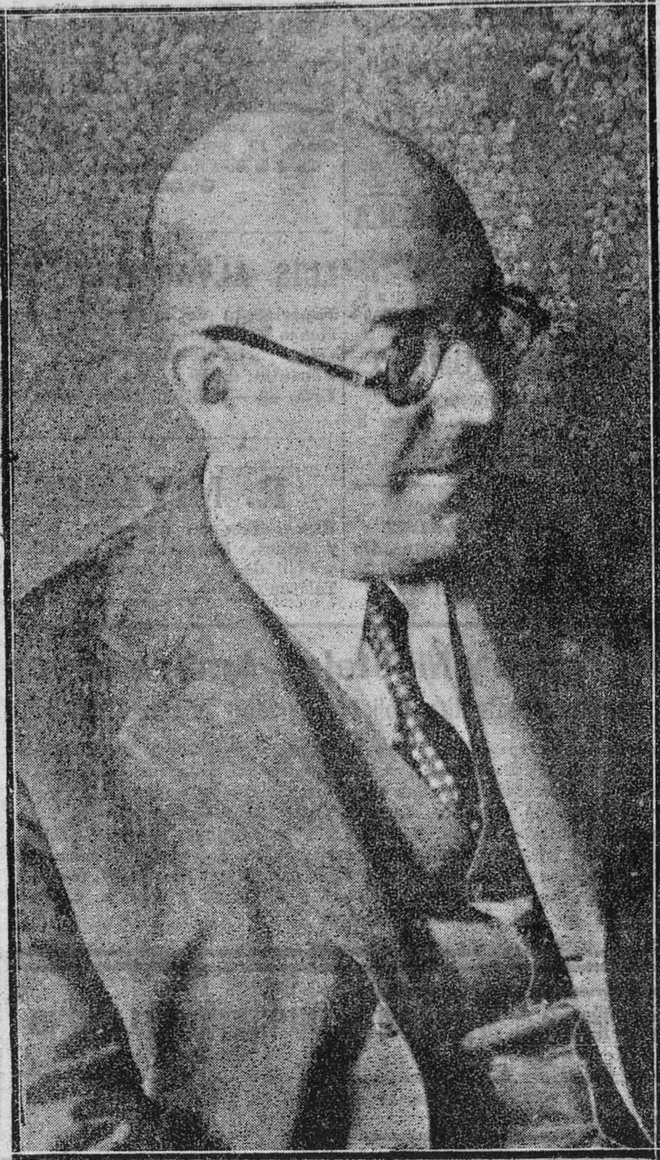
Don José Alonso Mallol, gobernador civil de Asturias, que ha sido designado para desempeñar igual cargo en Sevilla

Esas palabras de Jesús en su despedida de este mundo son una herencia de esperanza, que no ha perdido, ni aun ahora, su virtualidad. La historia de la Iglesia española es una parte, un episodio nada más de la compleja historia de la Iglesia Universal. Esta, si fuera una institución meramente humana, siglos ha que hubiera sucumbido. Pero la Iglesia creemos que es indefectible por la promesa de Cristo avalorada por la inducción de 20 siglos de constante persecución. El reino espiritual de Jesús, como dijo el Ángel a Nuestra Señora, no tendrá fin en el mundo y gloria de España es que sea tan considerable la parte que de él le toca: REINARE EN ESPAÑA Y CON MAS VENERACION QUE EN OTRAS PARTES.