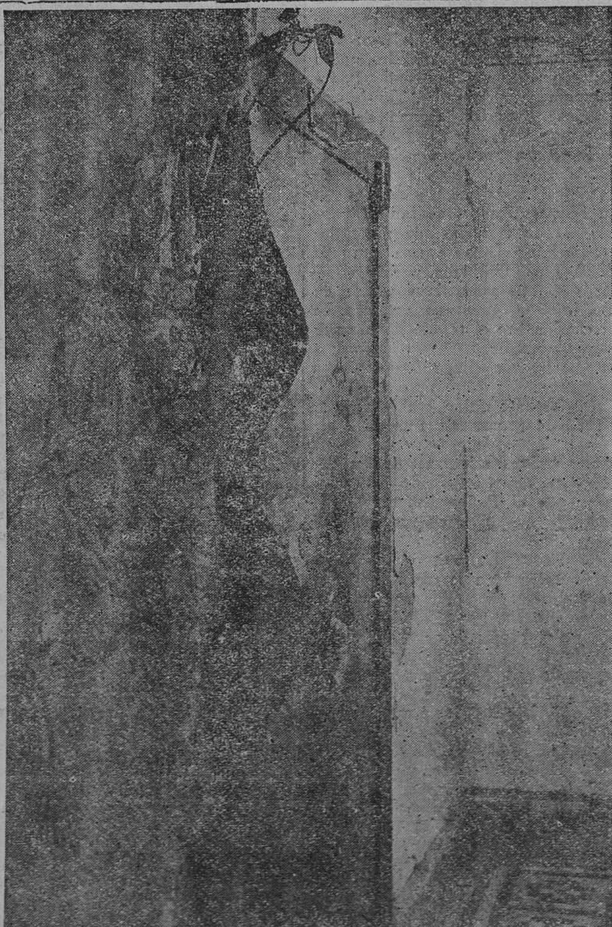
OVIEDO.— Huellas de los intentos de los revolucionarios por forzar el departamento de Caja del Banco Herrero. Tanto en el techo como en la puerta de la caja se ven los destrozos causados.

Los detenidos fueron puestos a disposición del Juzgado militar.