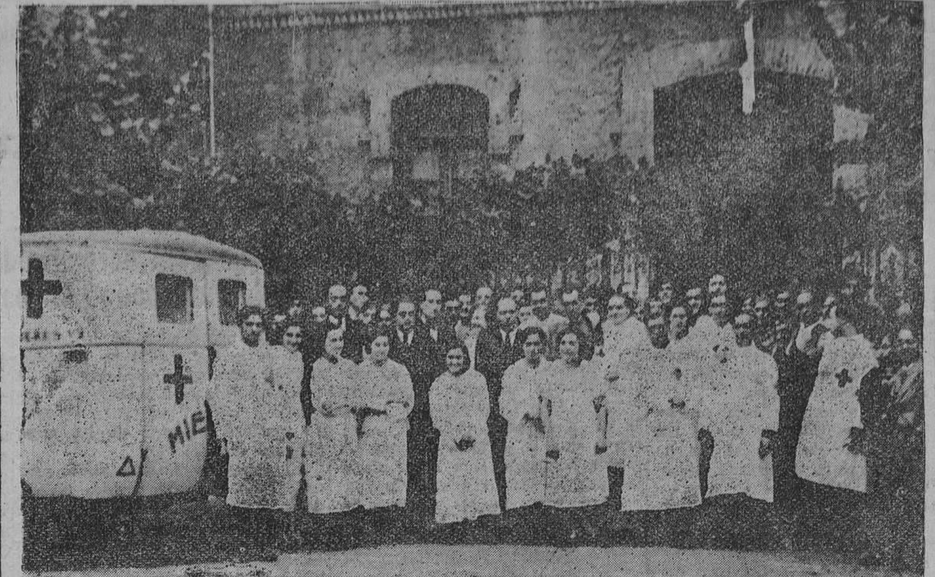
MIERES.— Facultativos y auxiliares de la Cruz Roja, en el hospitalillo instalado en la Escuela de Capataces de Minas.

No puede esta Junta aliviar, como es su deseo, tantas familias necesitadas como acuden a esta