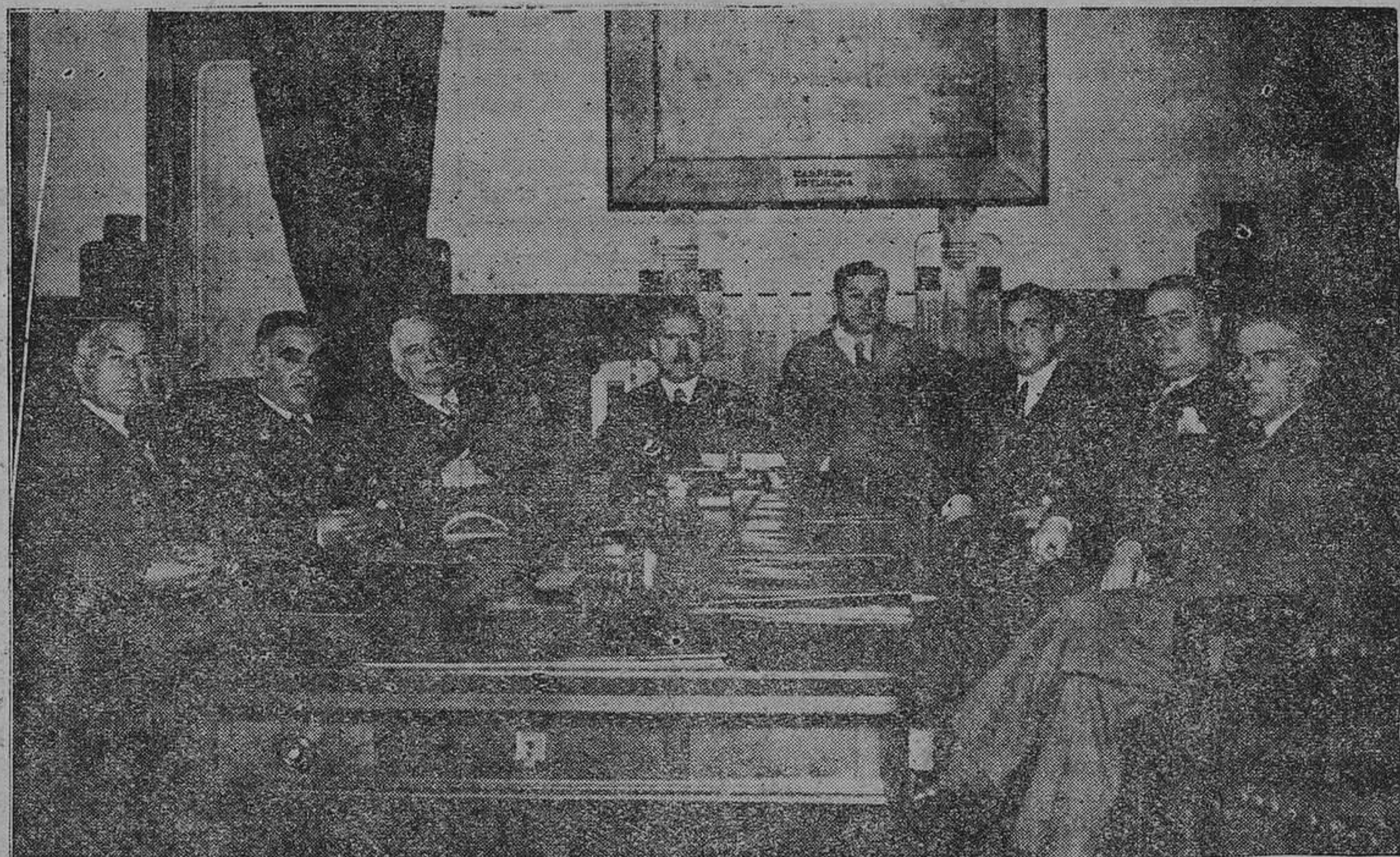
OVIEDO.— La nueva Comisión Gestora de la Diputación Provincial, que ayer tomó posesión.