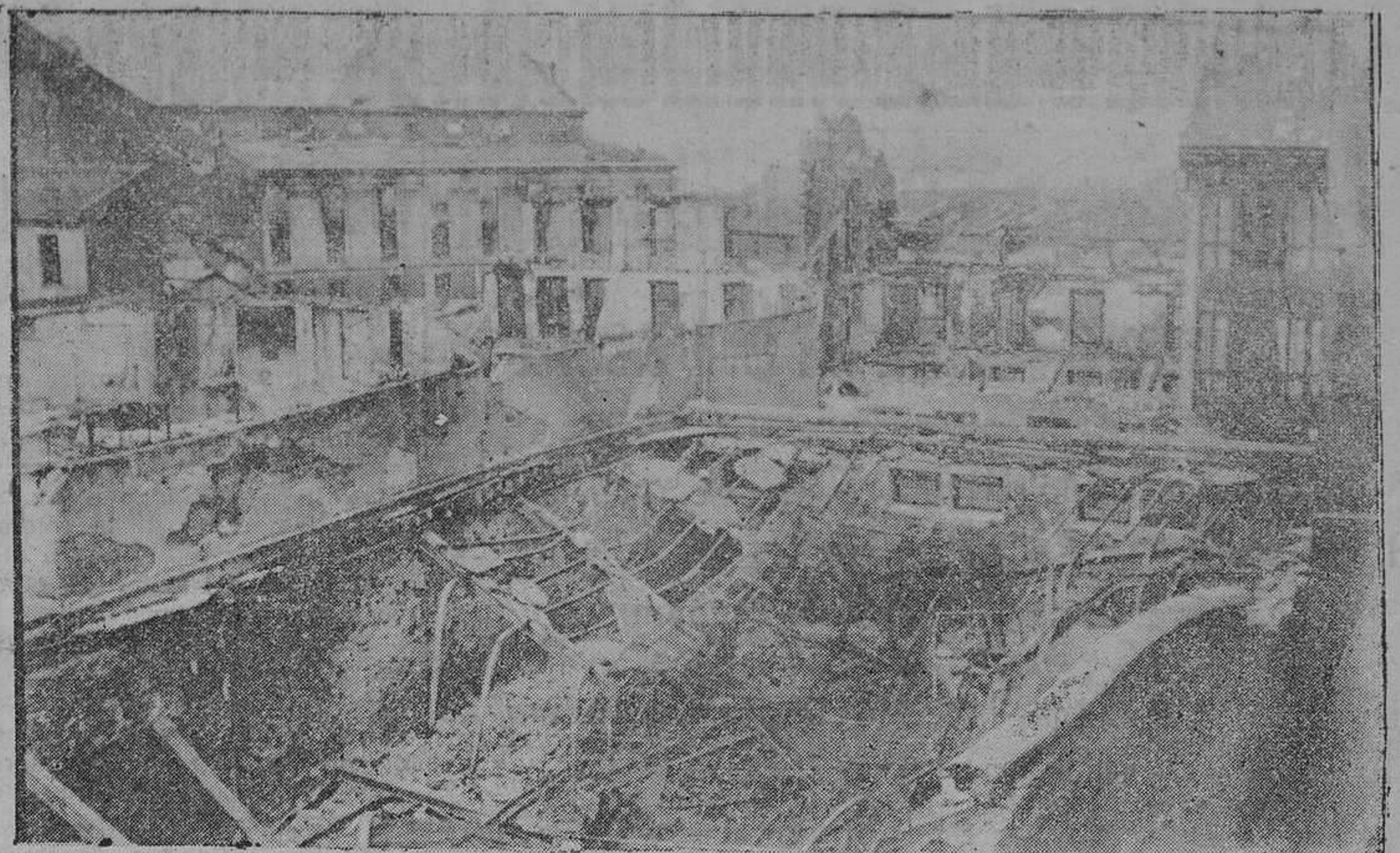
OVIEDO.— Vista general de la manzana de casas de las calles de San Francisco y Argüelles, que fueron incendiadas.

También se han distribuido libretas de ahorro o donativos a obreros y maestros que se han distinguido como fomentadores del ahorro, en el Monte de Piedad y en la Caja de Previsión Social.