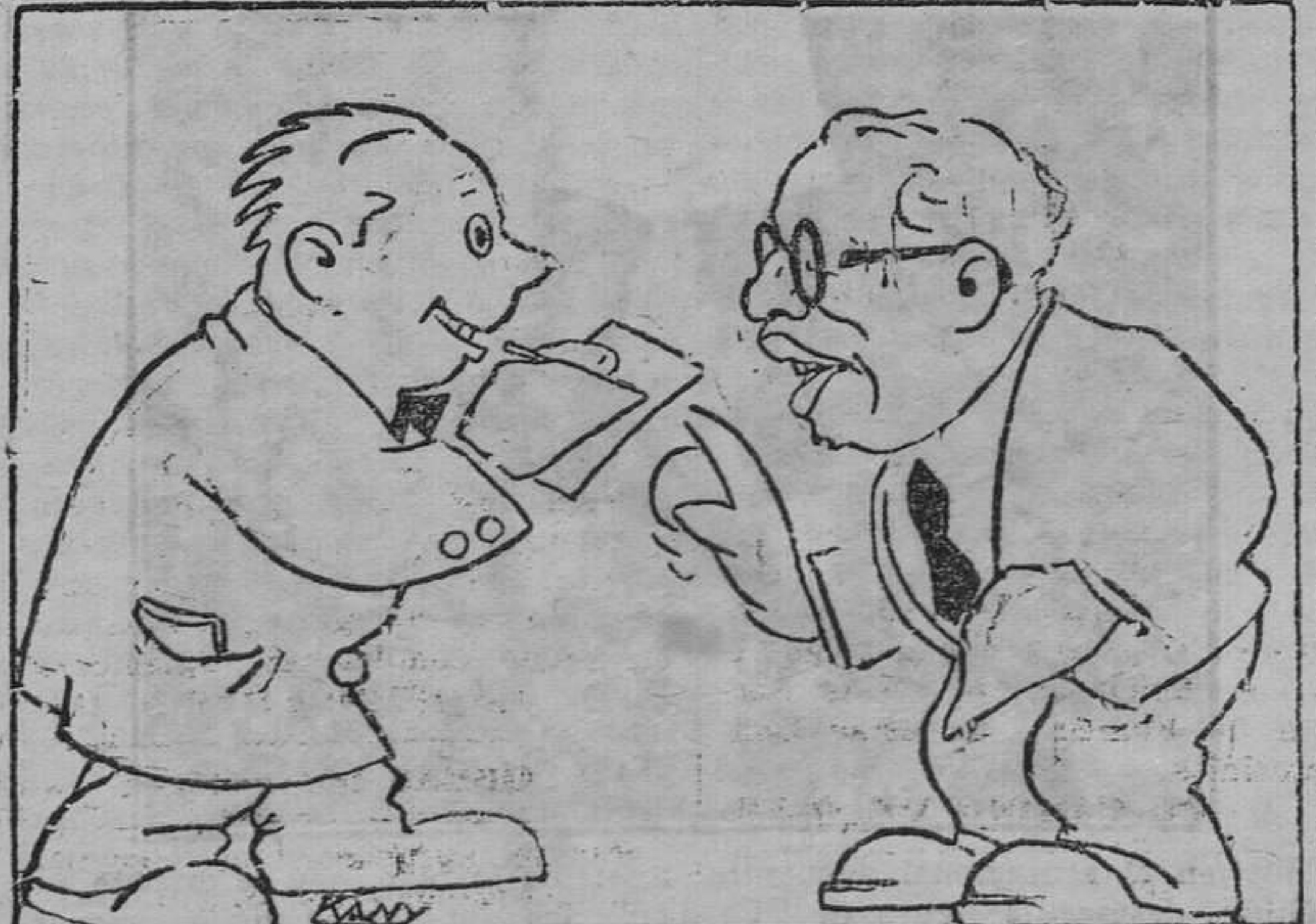
—Señor presidente, ¿habrá crisis? —¿Pero le parece a usted que hay poca crisis?