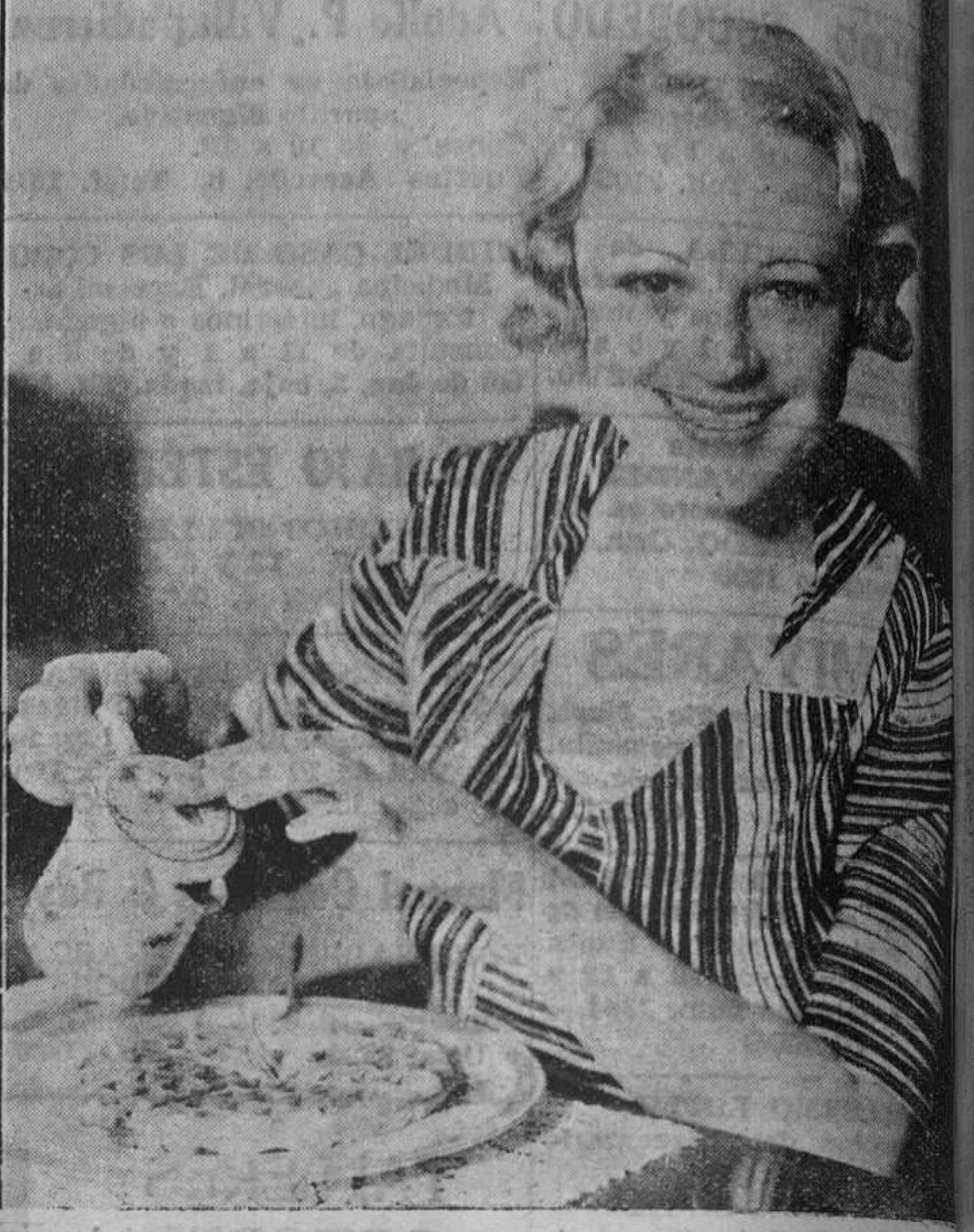
Con la gracia de su sonrisa luminosa, Sally Eilers, la joven estrella de la Fox, aparece aquí como una perfecta mujercita de su casa tan hábil repostera como admirable protagonista de tantas de sus películas.