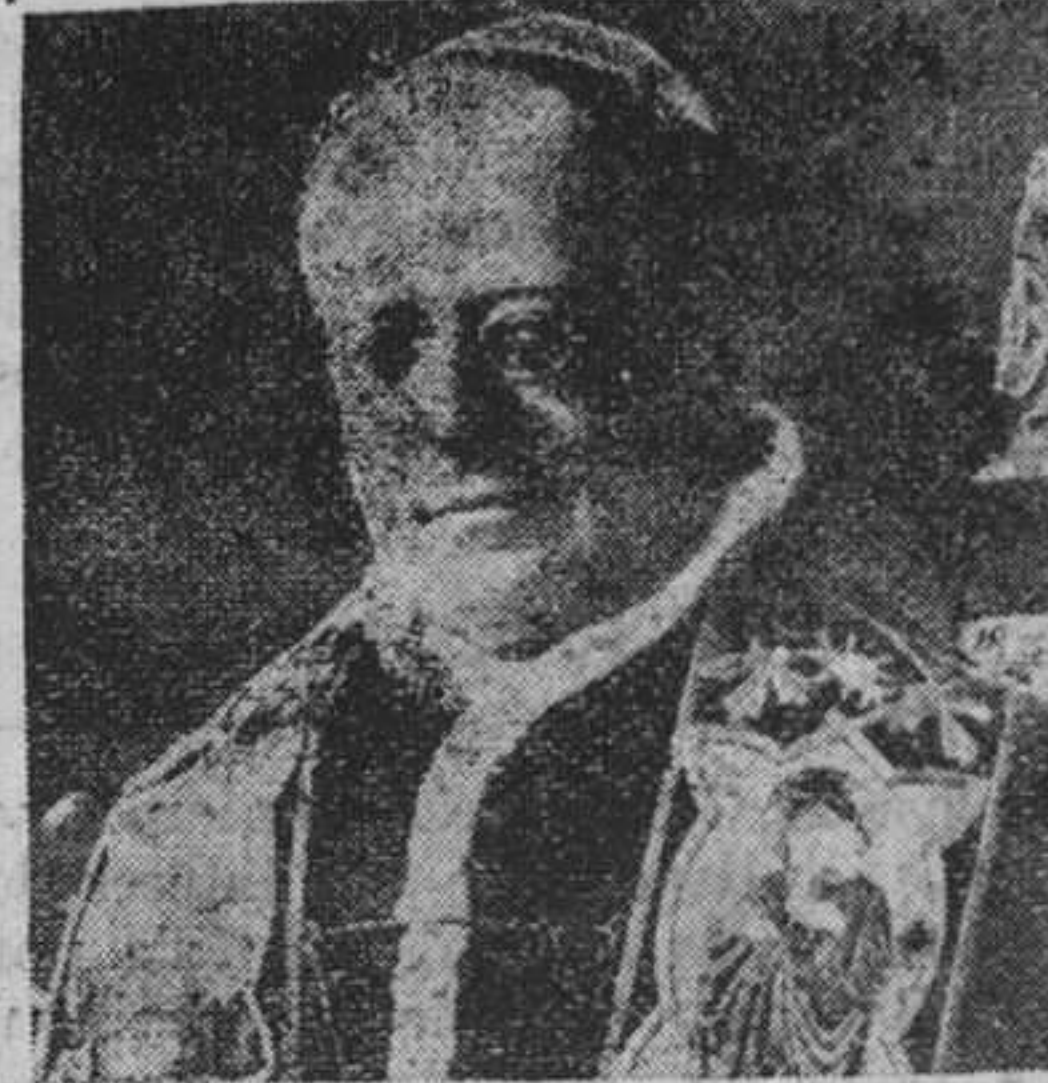
SU SANTIDAD PIO XI