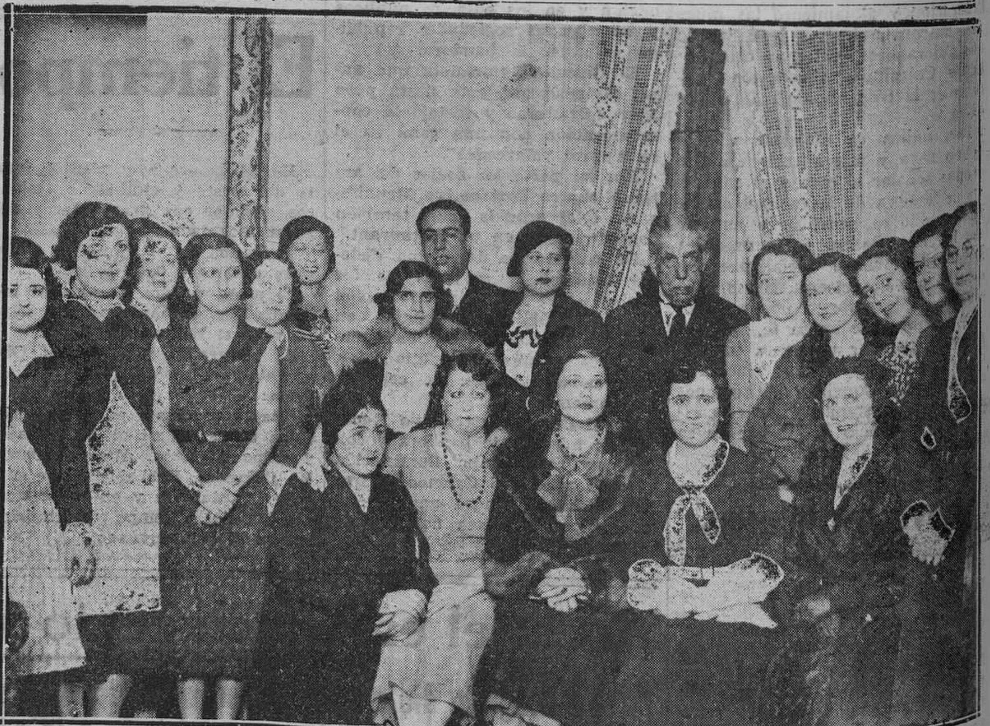
MADRID.— El ex ministro don Francisco Bergamín, rodeado de varias concurrentes a la conferencia que ha dado en "España Femenina".