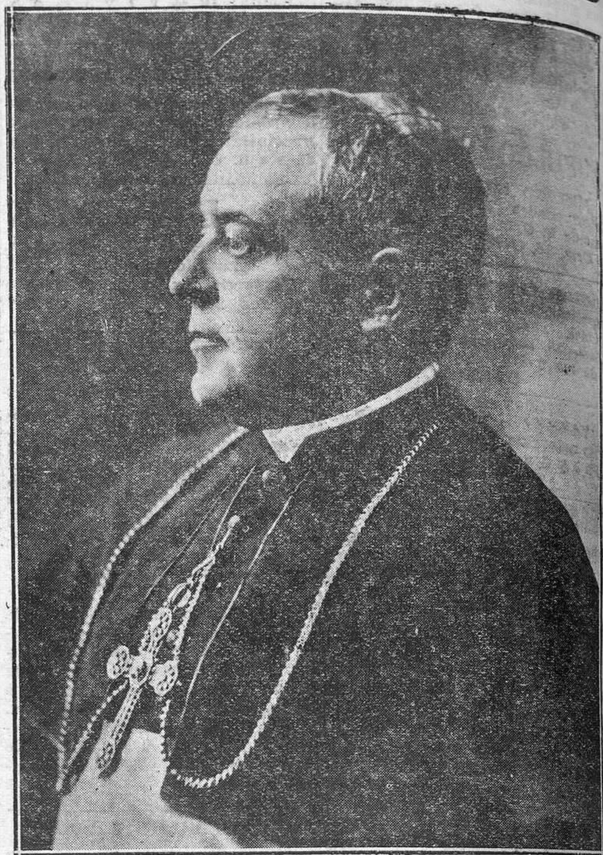
El cardenal Gasparri, que ha sido nombrado miembro de la Academia de Ciencias Morales y Políticas. Fué secretario del Vaticano y tuvo importante intervención en las negociaciones que condujeron al pacto de Letrán.