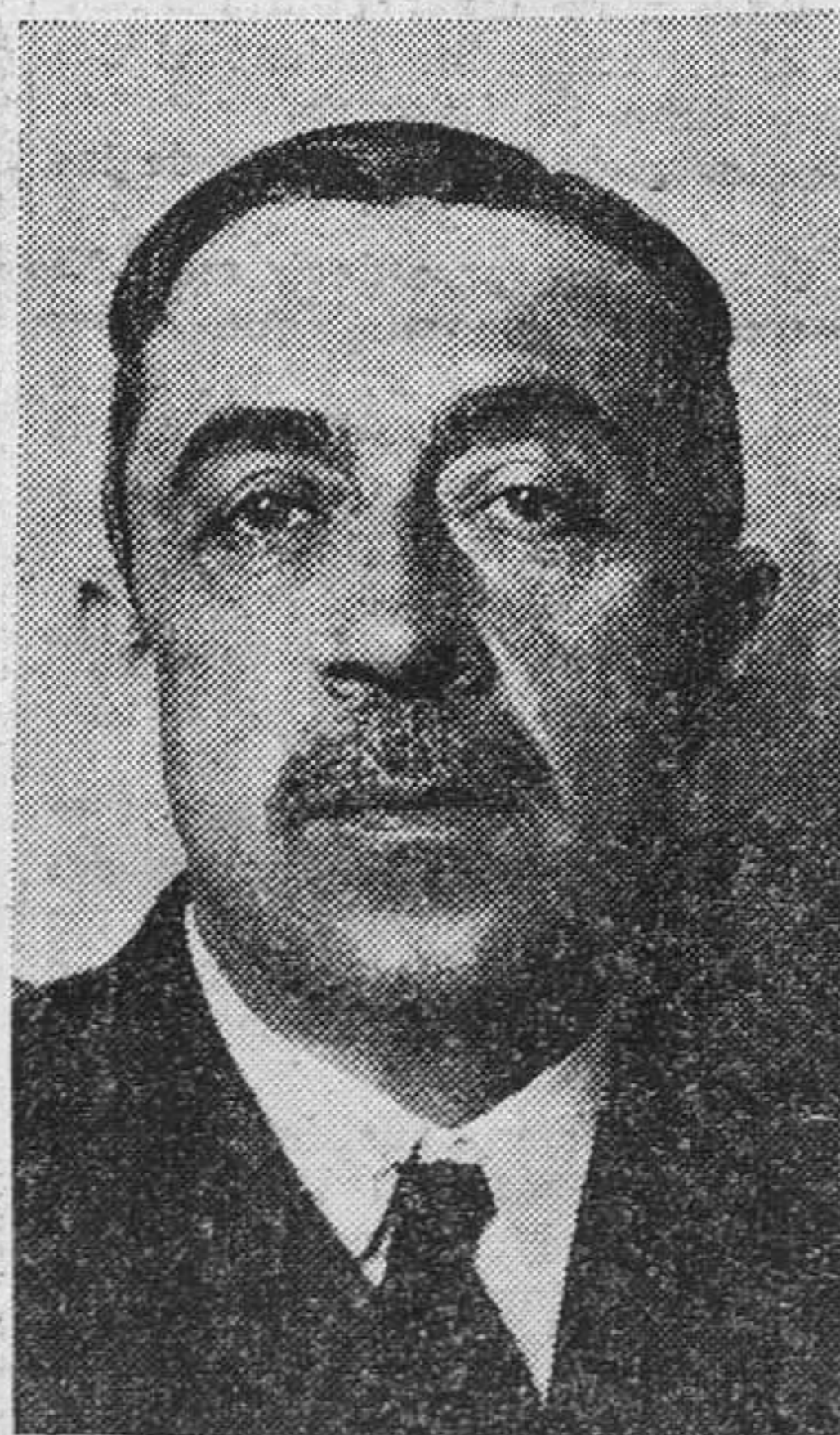
Don Emilio Herrera, que ingresó como miembro de número en la Academia de Ciencias Exactas, Físicas y Naturales