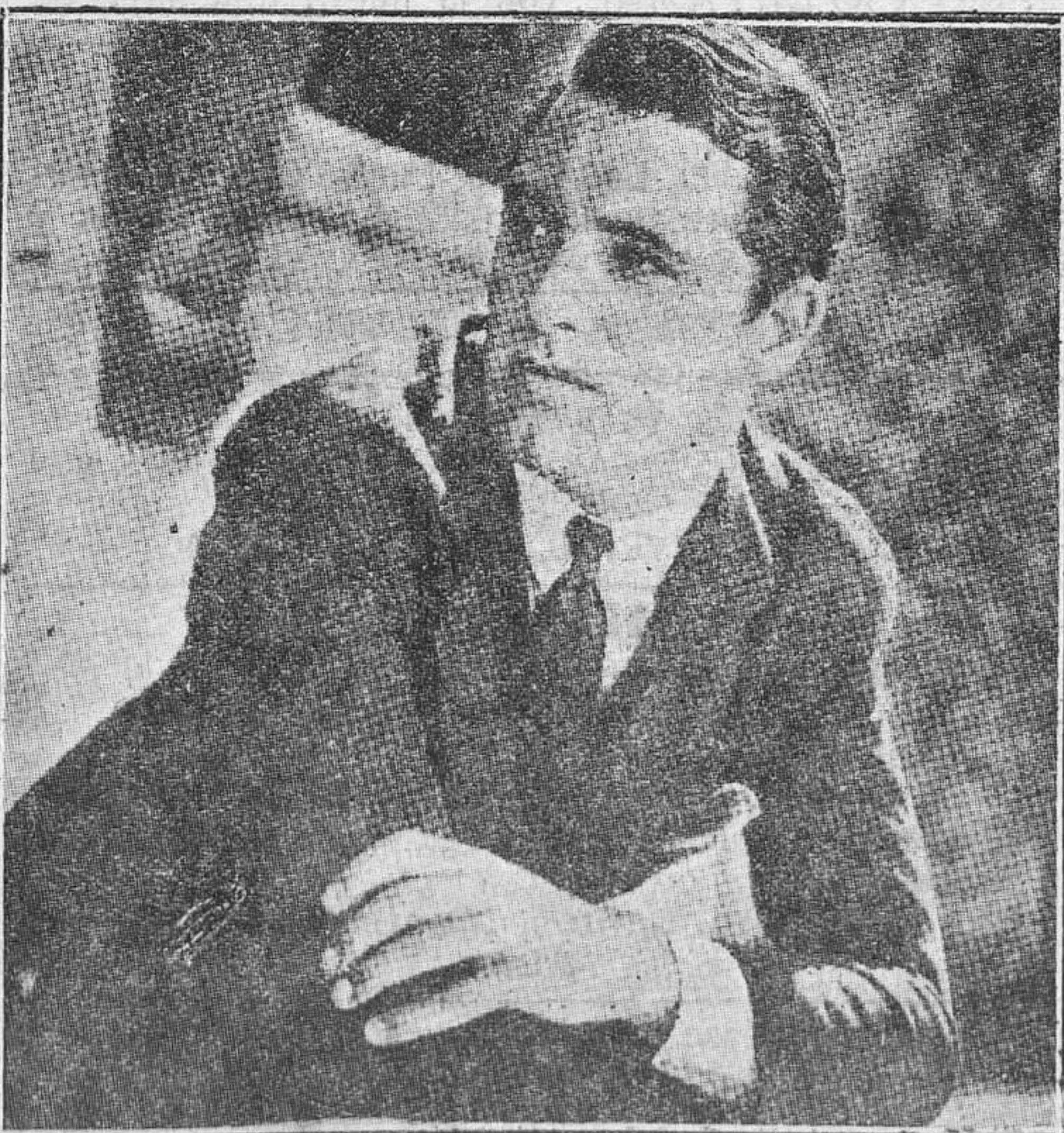
Cary Grant, un actor novel que ha pasado ya el período de aprendizaje y ha ganado el aplauso del público con asombrosa prontitud.