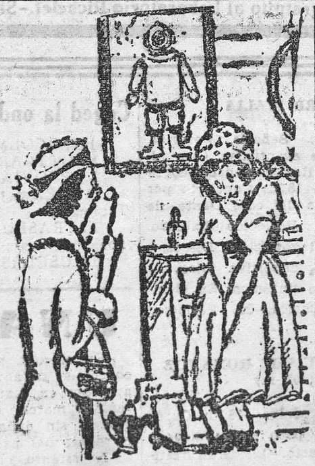
—¿De quién es esa fotografía? —De mi novio en traje de trabajo. ¿Verdad que es muy guapo?