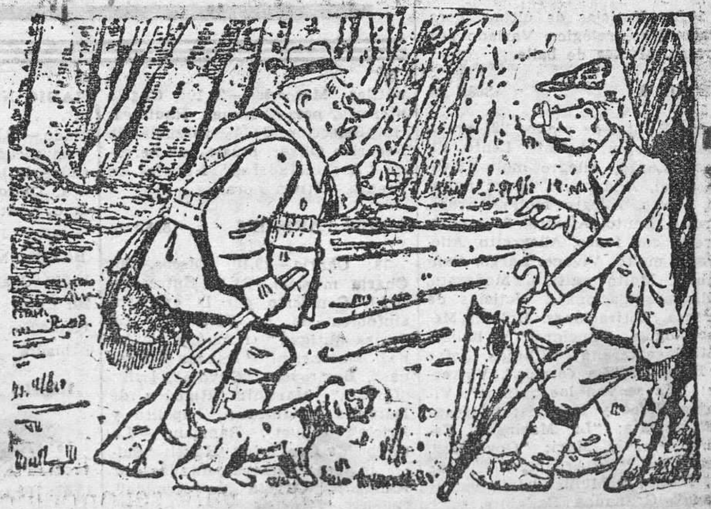
—¿Cómo ha huído el conejo? ¿Es que estaba usted descubierto? —Todo lo contrario. Cuando lo vi llegar abrí el paraguas para que no me viera. (De "Moustique", Charleroi.)