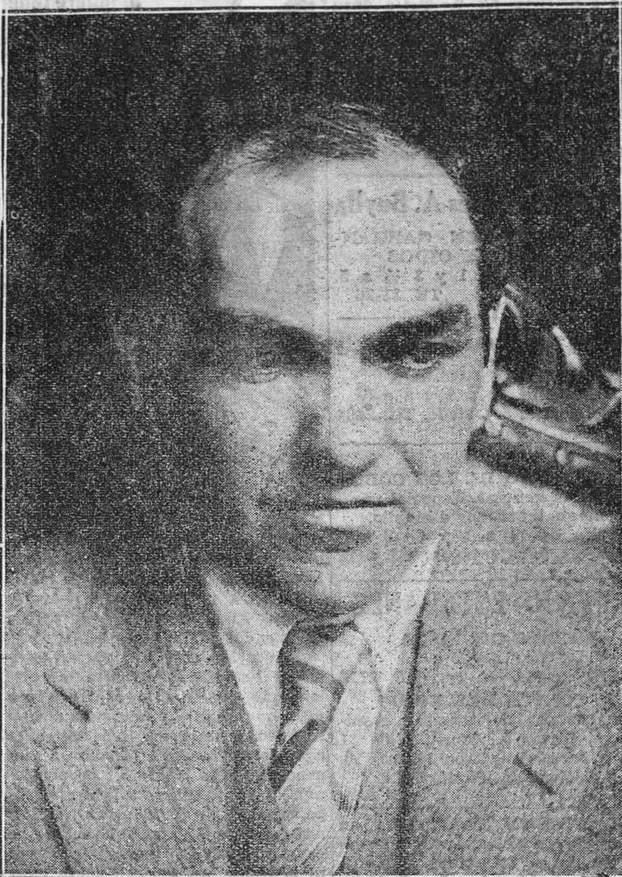
El director general de Sanidad, don Ramón Pascua, que se halla en Asturias resolviendo denuncias presentadas por el Colegio Oficial de Practicantes contra anomalías en centros benéficos de Gijón.