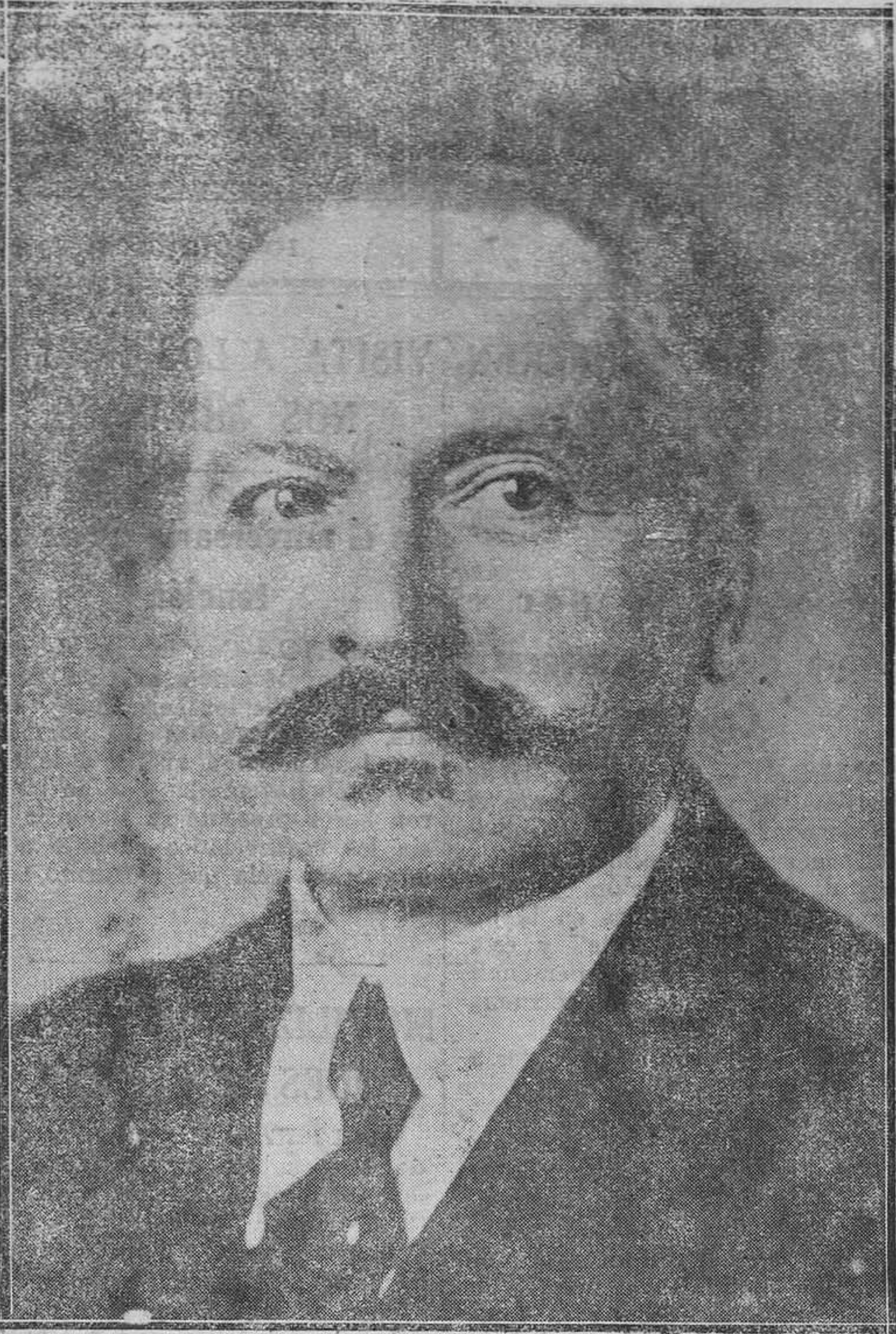
Mr. Lebrun, que ha sido elegido para la Presidencia de la República francesa, sustituyendo a M. Doumer.

No dudamos —terminan diciendo— de que la justicia de la petición encontrará eco en breve en las autoridades académicas, que traerán así la paz a la comunidad escolar. Van propicia, en caso contrario, ante la persistencia del injusto monopolio, a luchar eficaz y prontamente para destruirlo.