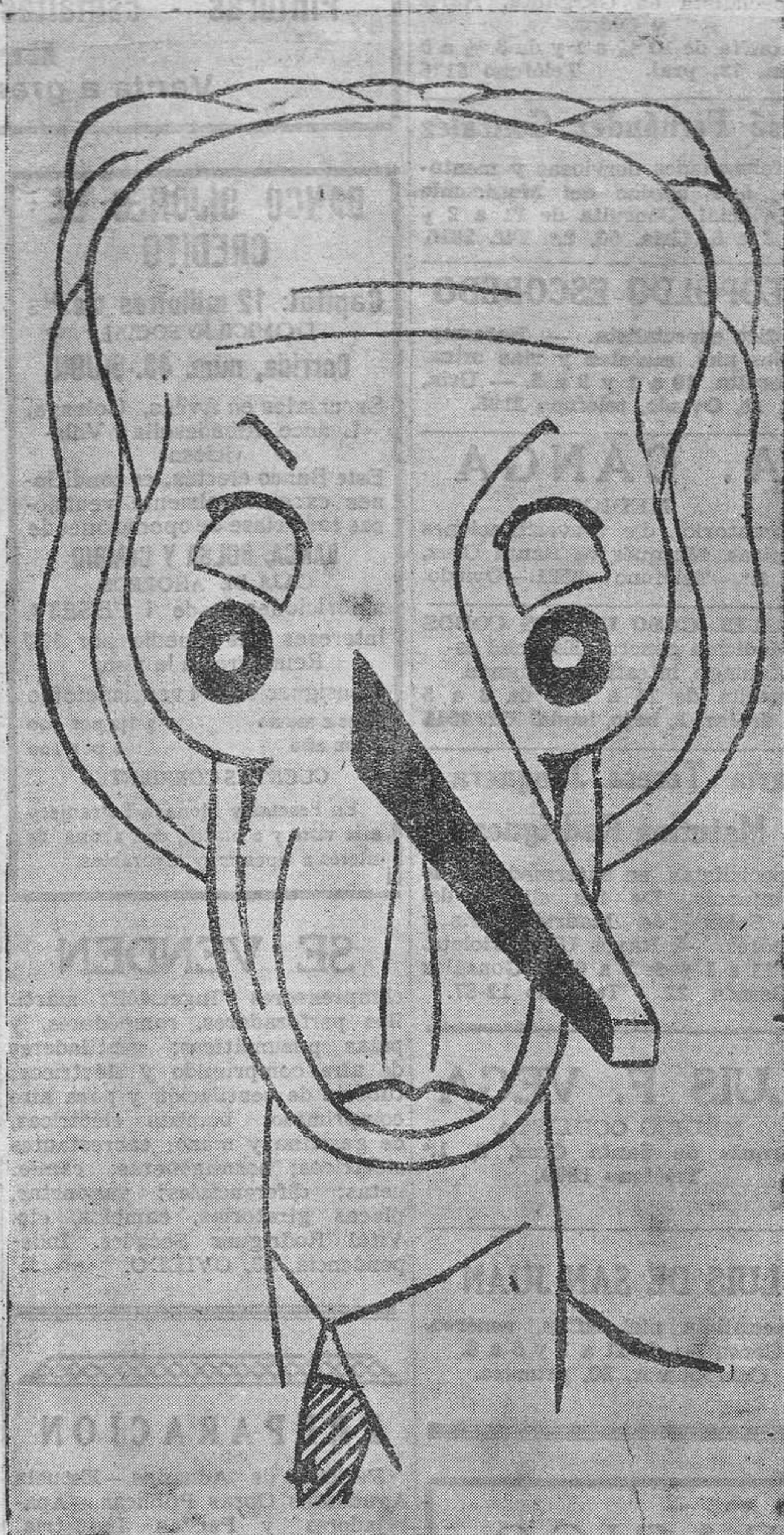
EL MINISTRO DE JUSTICIA, DON ALVARO DE ALBORNOZ.