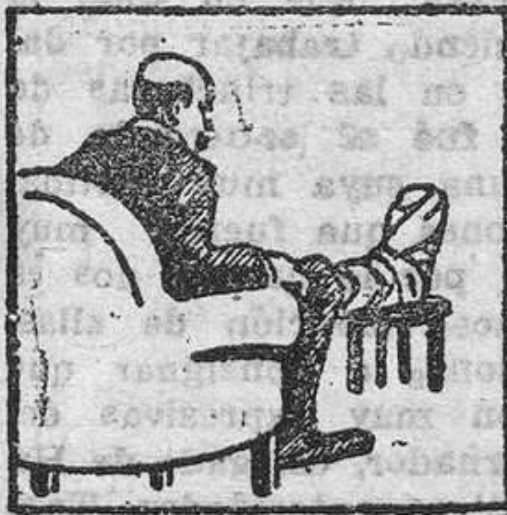
Gota - Dolores