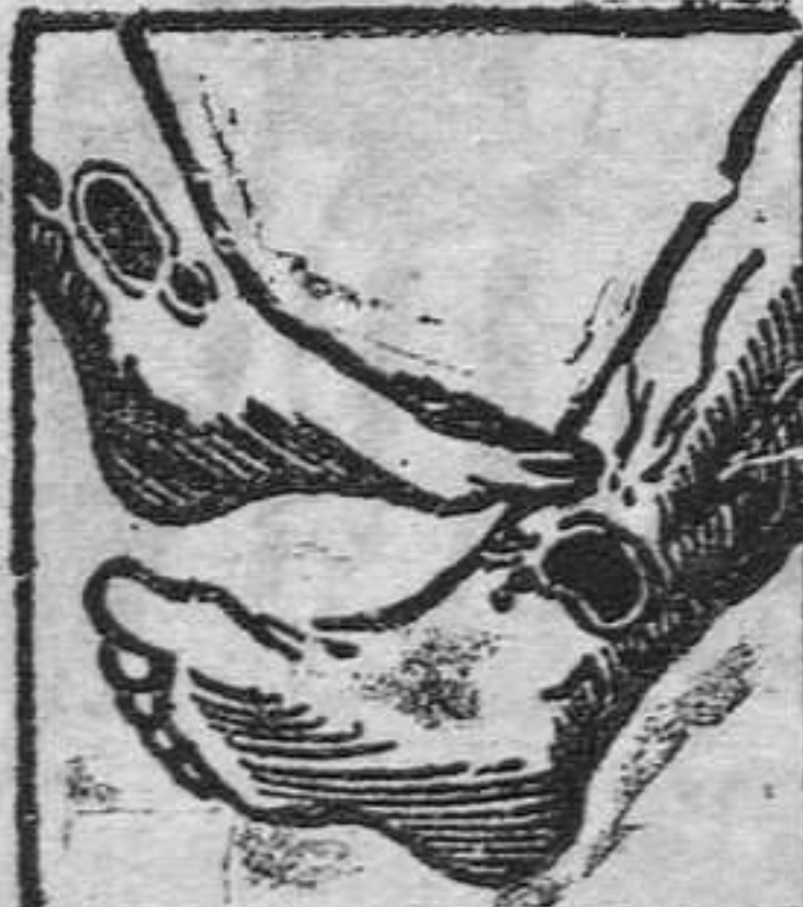
Males en las piernas

Tengo tambien de los consumidores de España frecuentes testimonios de curaciones maravillosas obtenidas con el uso de mi Depurativo. No los publico sin embargo por sujetarme al deseo expresado por los mismos de no dar a conocer sus nombres respetando asi su natural reserva. Pida Vd hoy mismo un folleto gratuito al Laboratorio Richelet, San Sebastian, 22, San Bartolomé.