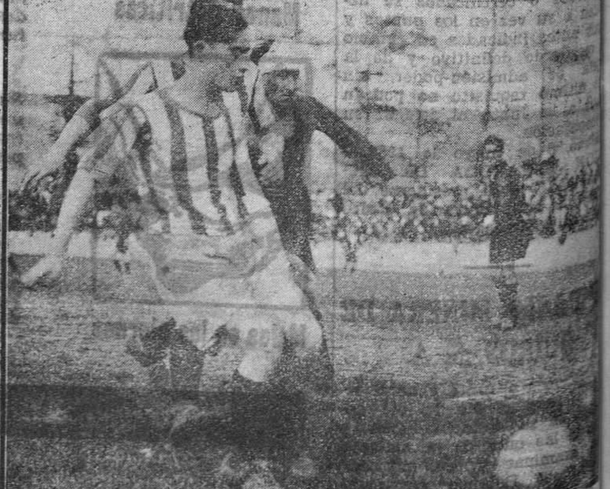
BILBAO.—Otro momento de los esfuerzos de Yermo, que nuevamente frustran los sportinguistas. (Foto Gil del Espinar).