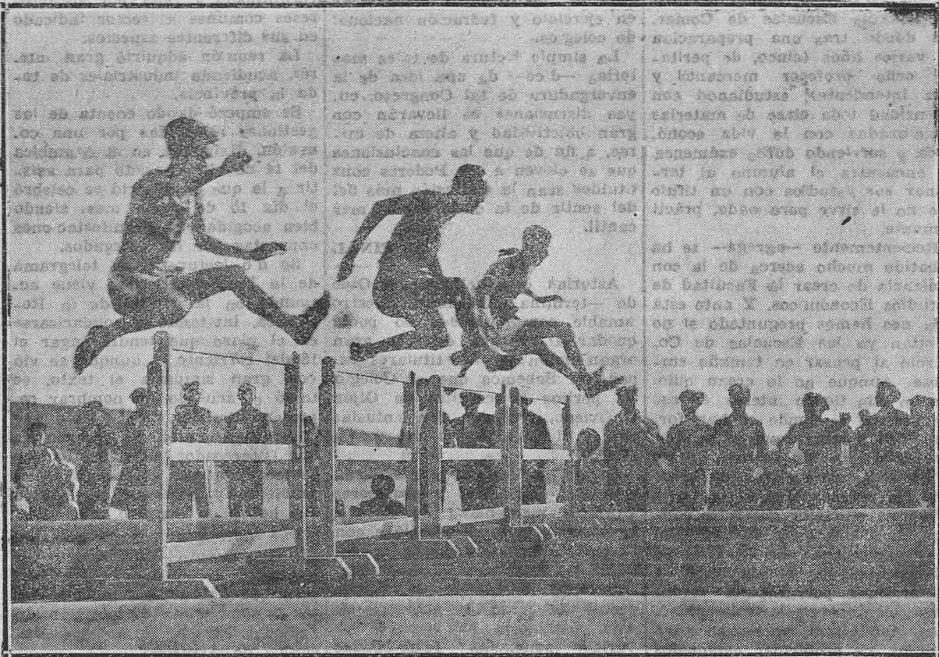
MADRID.—Campeonato universitario de Atletismo. Un momento de la carrera de 400 metros con valla.

A verlo ganar, no acudieron a Riazor los más desafortunados "lincheros". Dos muy optimistas auguraban un empate. A lo que poco a poco se fué uniendo a Riazor, fué a ver cómo el Madrid, con esa línea delantera, al parecer excesivamente buena se pa-