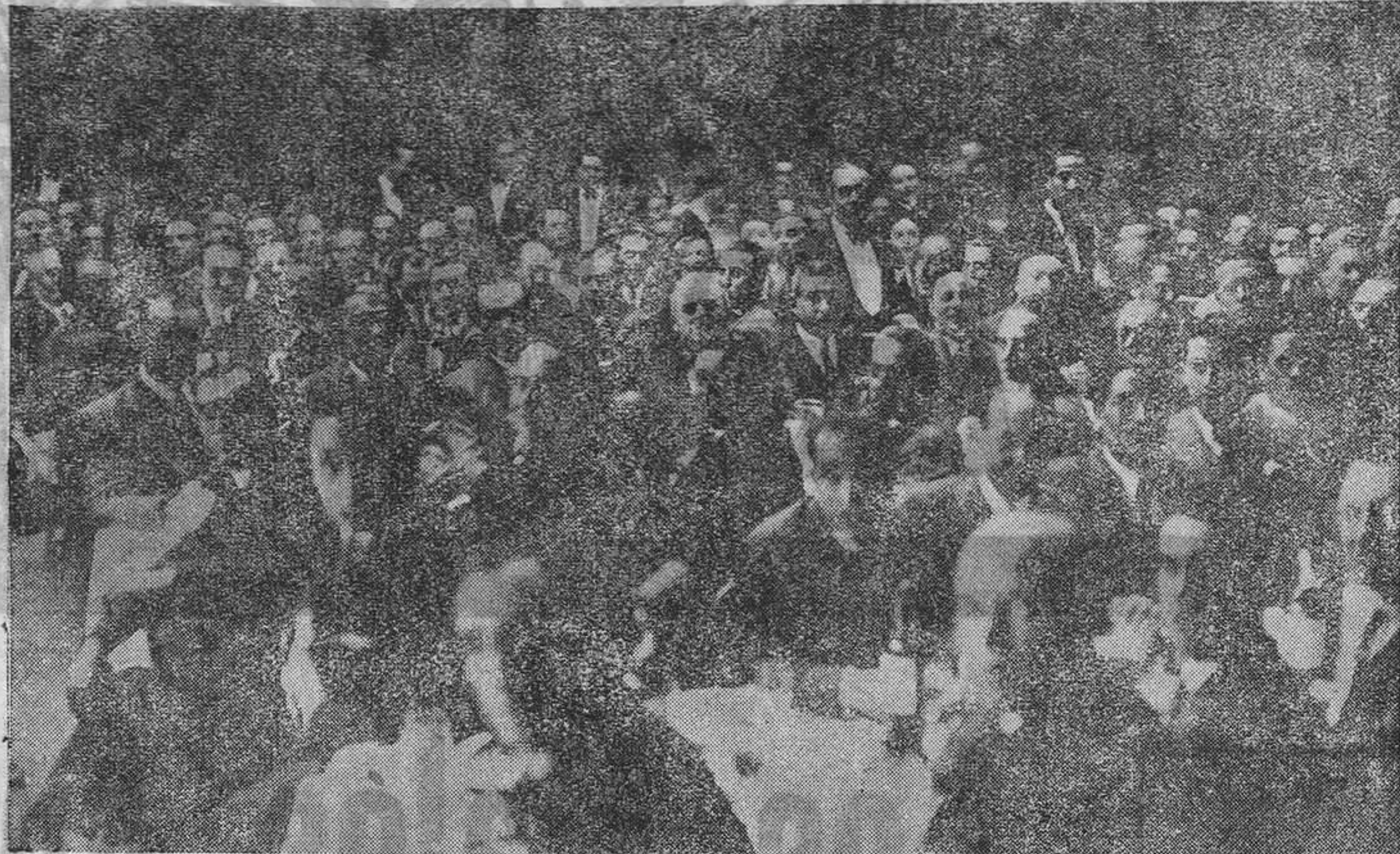
OVIEDO.—El banquete celebrado el domingo en honor de los directivos del Oviedo.

El muy amplio comedor del hotel en que se celebró el banquete, se llenó hasta rebosar al extremo