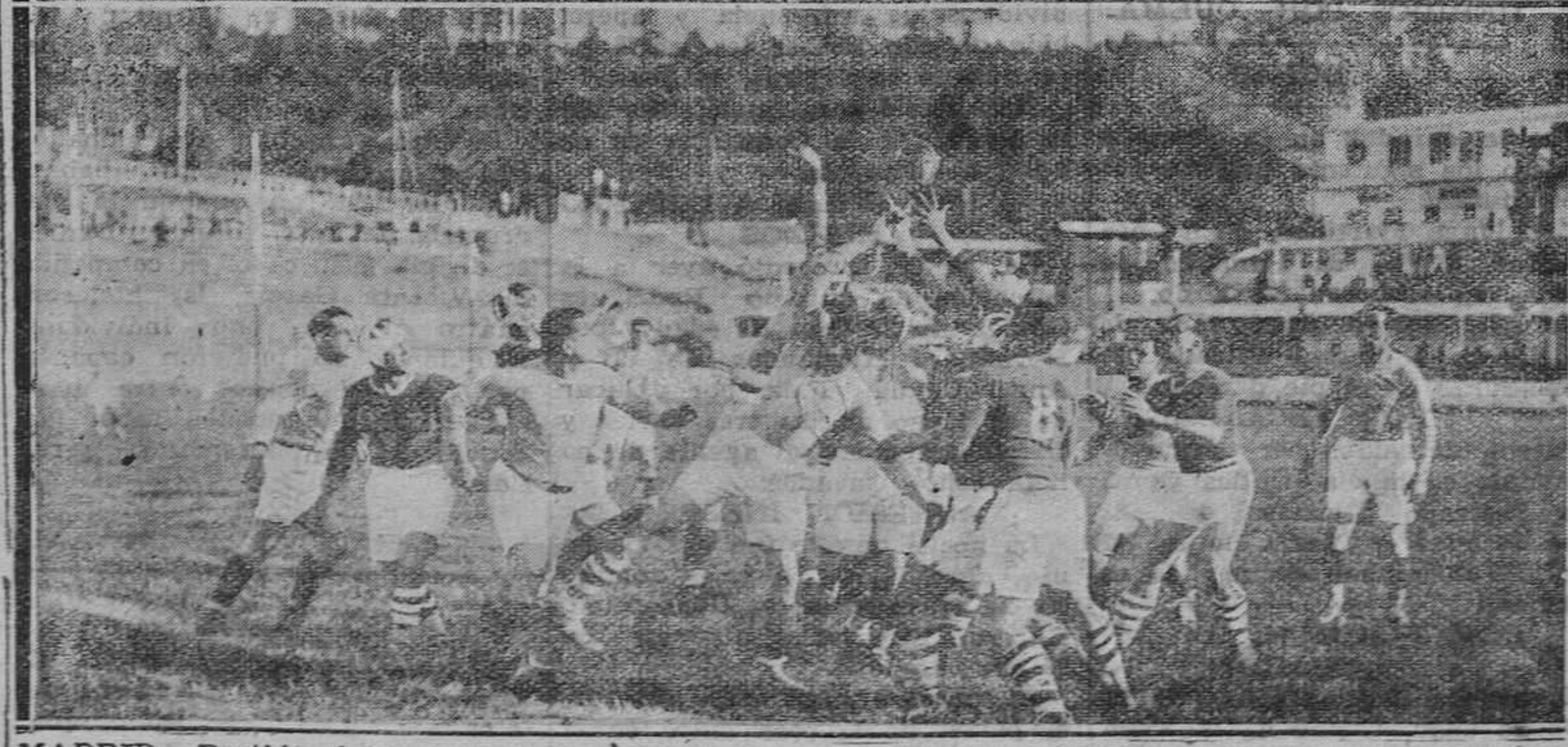
MADRID.—Partido internacional de rugby entre las selecciones francesa (Marruecos) y española, Arriba; El presidente de la República presenciando el partido. Abajo: Un momento del encuentro. (Fotos Vidal).

Avanzada ya la tanda, Emilín se escapa, pasa a Saro que manda a Yermo el cual se encuentra mano a mano con Oscar, la salida valentísima del ovetense, que se ganó un enorme porrazo, no pudo impedir el segundo gol arenero.