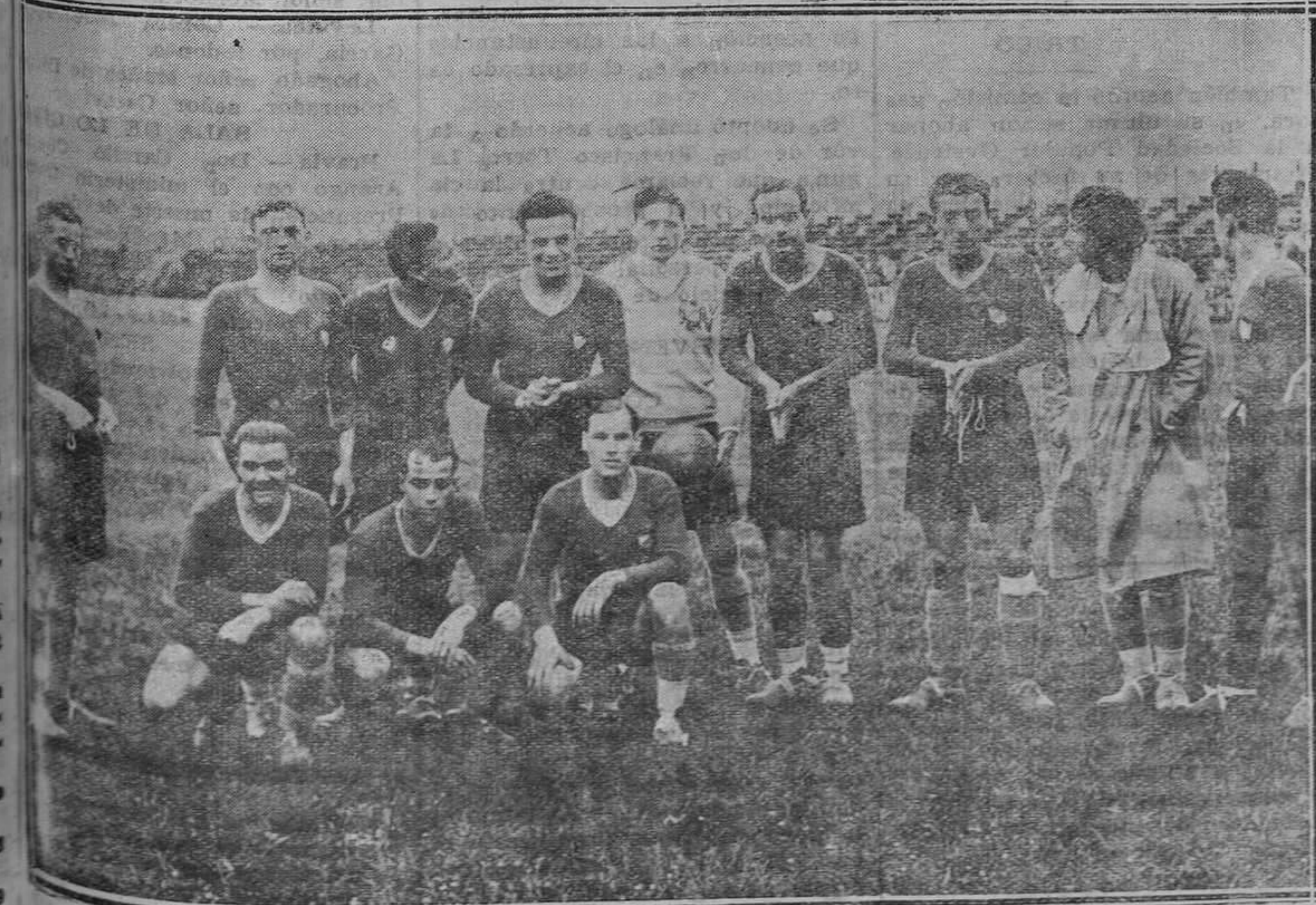
GIJON.-El equipo "Imperial", que jugó el domingo contra el Sporting.

La comisión, propone una terna entre los aspirantes que, a su juicio, reúnan mejores condiciones y la corporación resolverá a quién se ha de conceder la plaza.