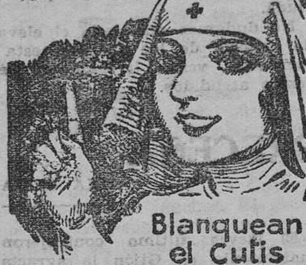
Blanquean el Cutis

Las Enfermeras saben que la Crema Tokalon, Color Blanco (sin grasa) contiene ahora crema de leche y aceite de olivas predigeridos, combinados con elementos astrigentes y tónicos que blanquean el cutis. No solamente la recomiendan, sino que la usan ellas mismas con objeto de blanquear, suavizar y embellecer el cutis. La Crema Tokalon penetra instantáneamente, calma la irritación de las glándulas cutáneas, aprieta los poros dilatados y disuelve las espinillas hasta que desaparezcán. Por seca que sea la epidermis, la mantiene delicadamente fresca y lisa. Quita el brillo que tenga un cutis aceitoso o grasoso. Las arrugas de cansancio desaparecen con una sola aplicación. La Crema Tokalon (Color Blanco) alimento del cutis, procura a éste, en 3 días, una belleza y un frescor nuevos e indescriptibles—en grado tal que es imposible obtenerlos de otro modo. Póngasela todos los días.