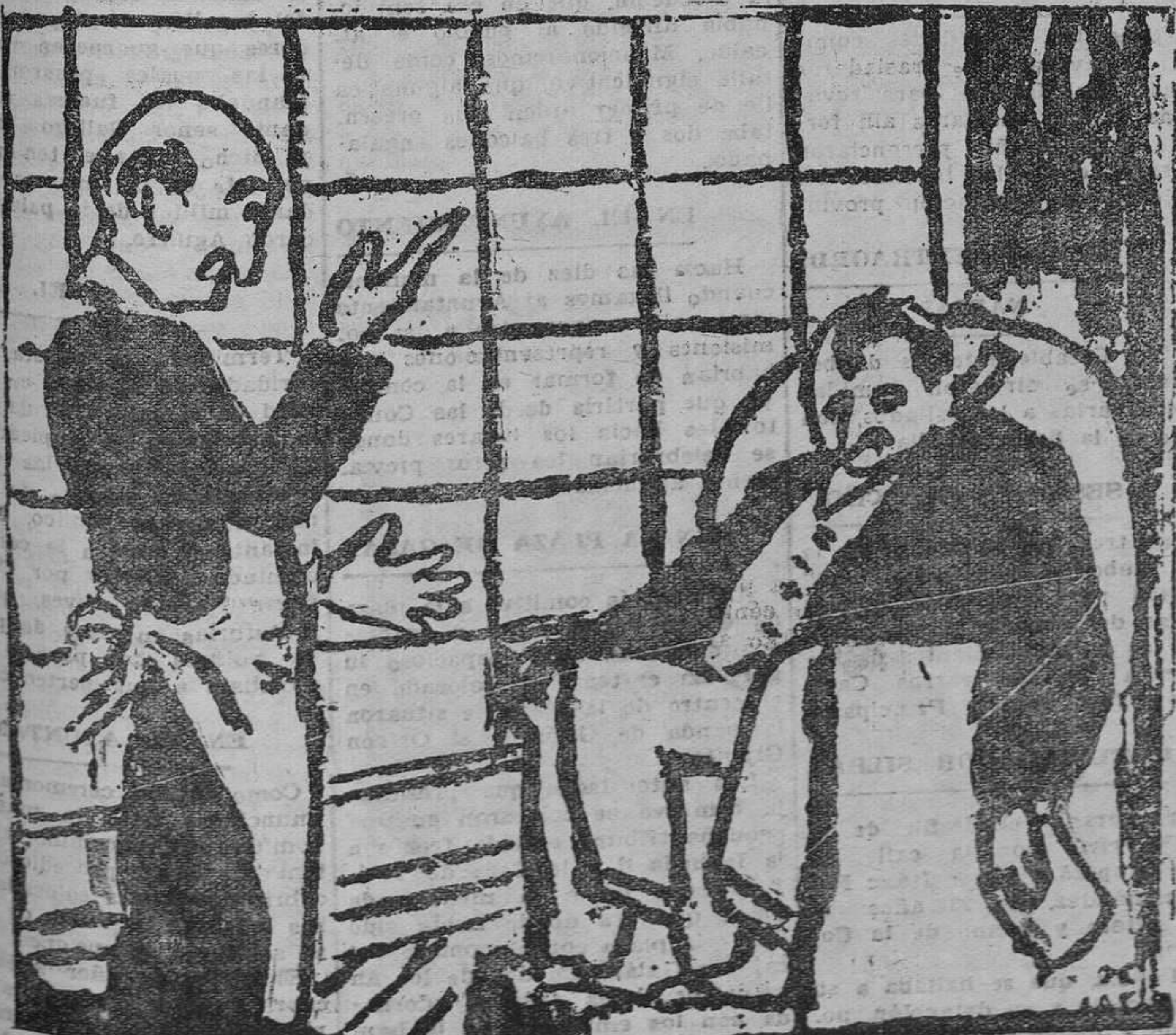
—Si el señor se encuentra mal iré a buscar al médico. —Sería inútil. Es su cuenta lo que me ha puesto malo.