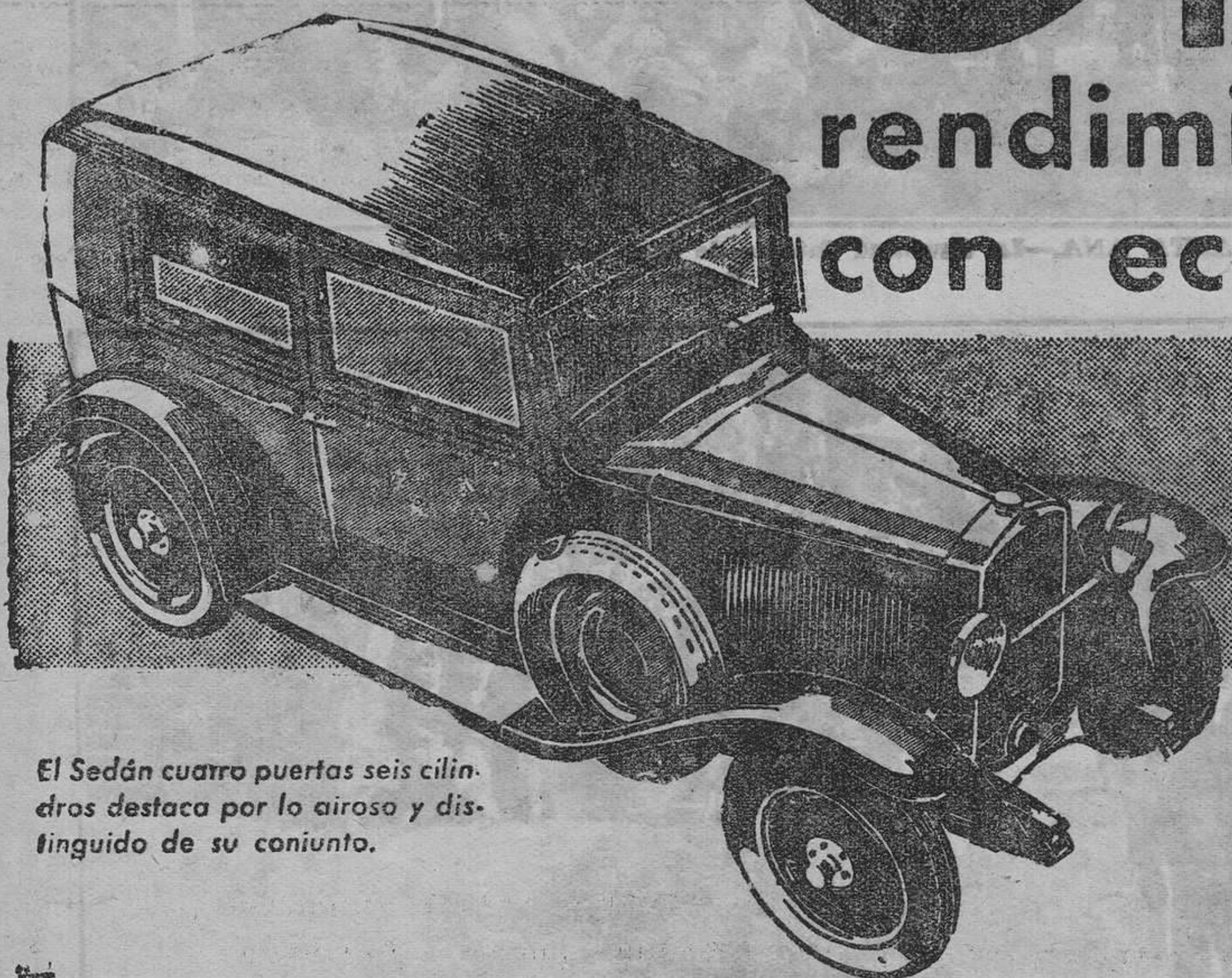
El Sedán cuatro puertas seis cilindros destaca por lo airoso y distinguido de su conjunto.

rendimiento americano con economía europea