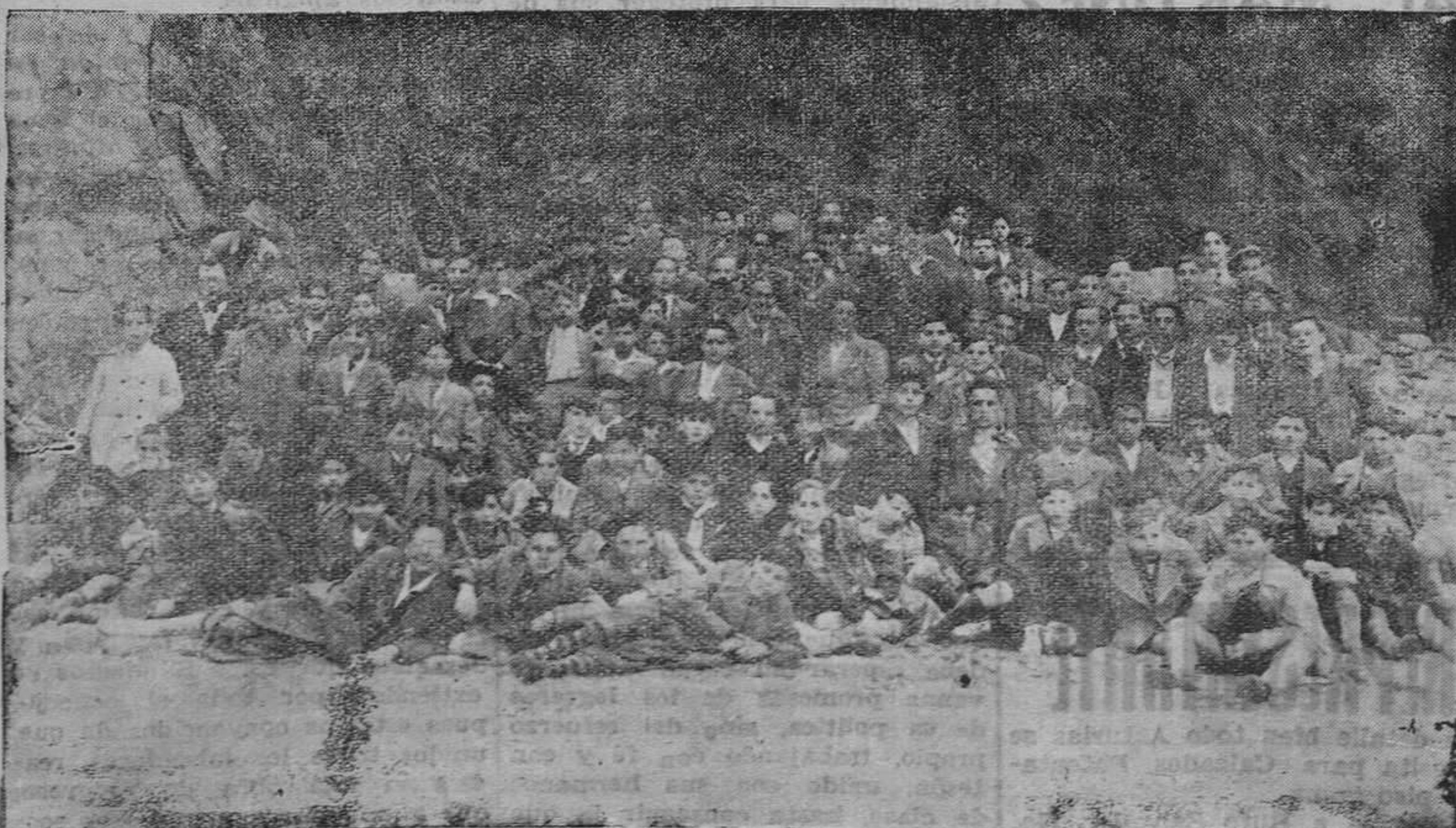
OVIEDO.—Escolares ovetenses durante una excursión, en un breve descanso en Luarca.

Los católicos de aquel pueblo, han abierto una suscripción entre todos los vecinos para pagar la multa que se le impuso al párroco.