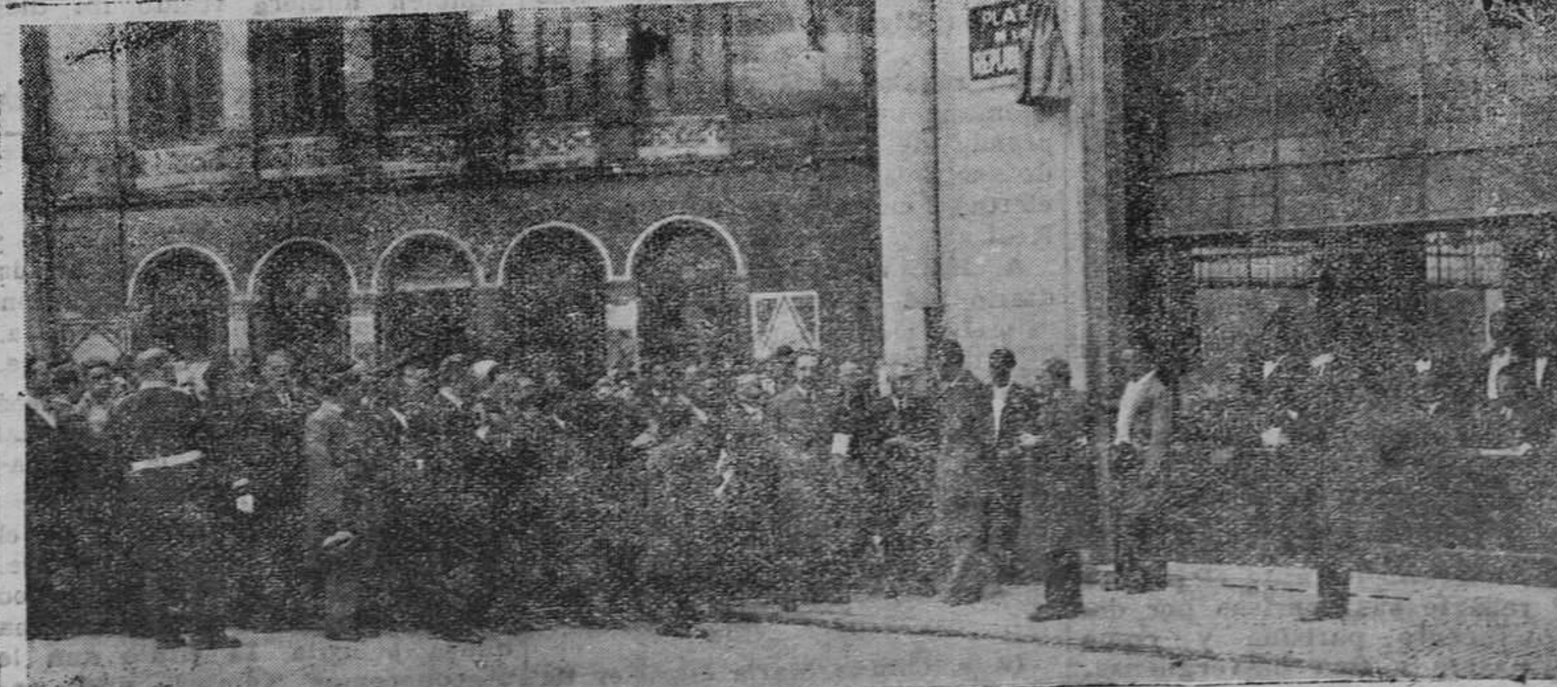
GOBIERNO.—El descubrimiento de la placa en la plaza de la República. En la foto están todos los que han asistido.