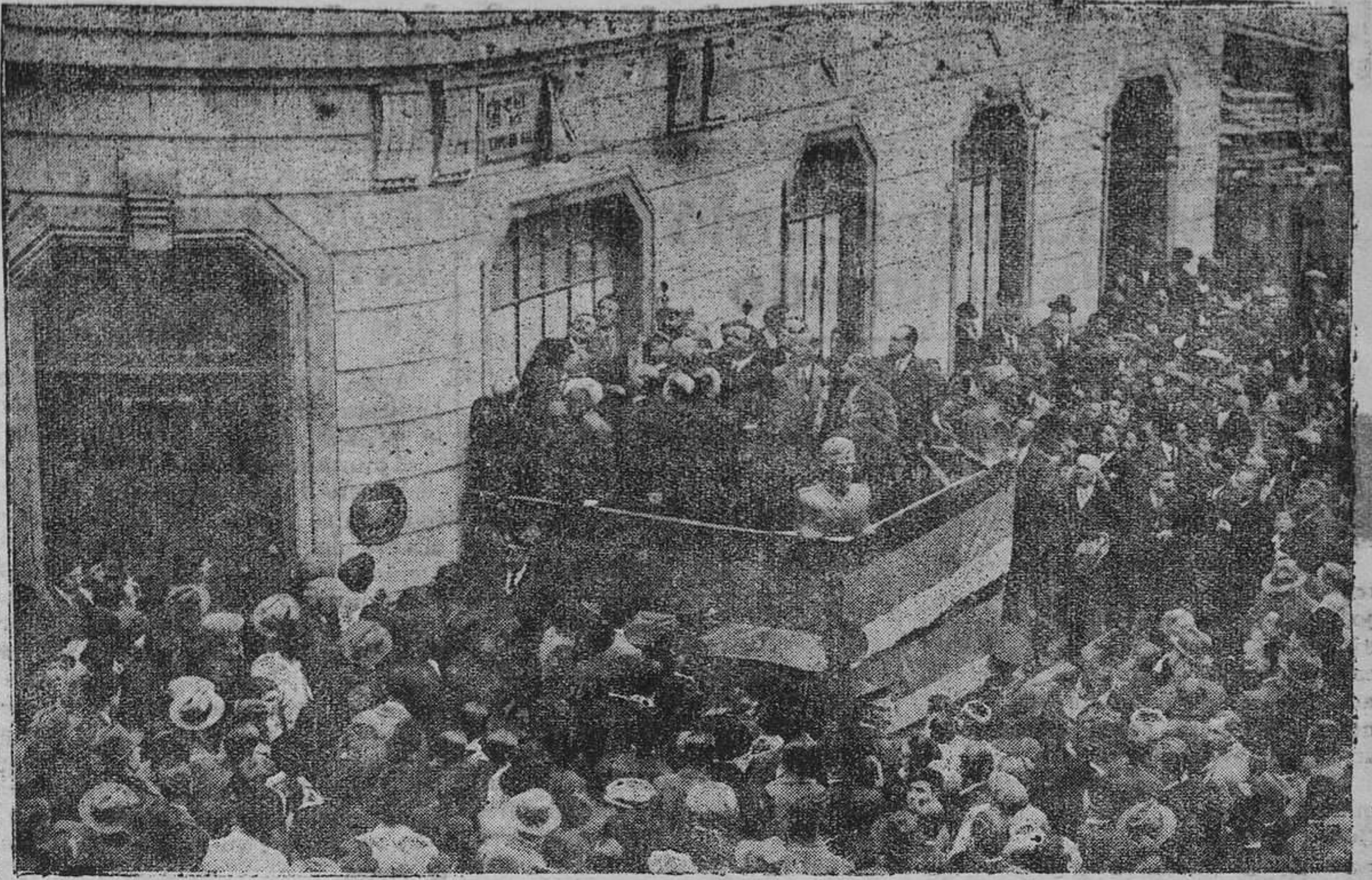
GIJÓN.—El acto de descubrir la plaza en la plaza de Galán.

Por la noche se recibió un aviso en la Comisaría diciendo que el carro había aparecido.