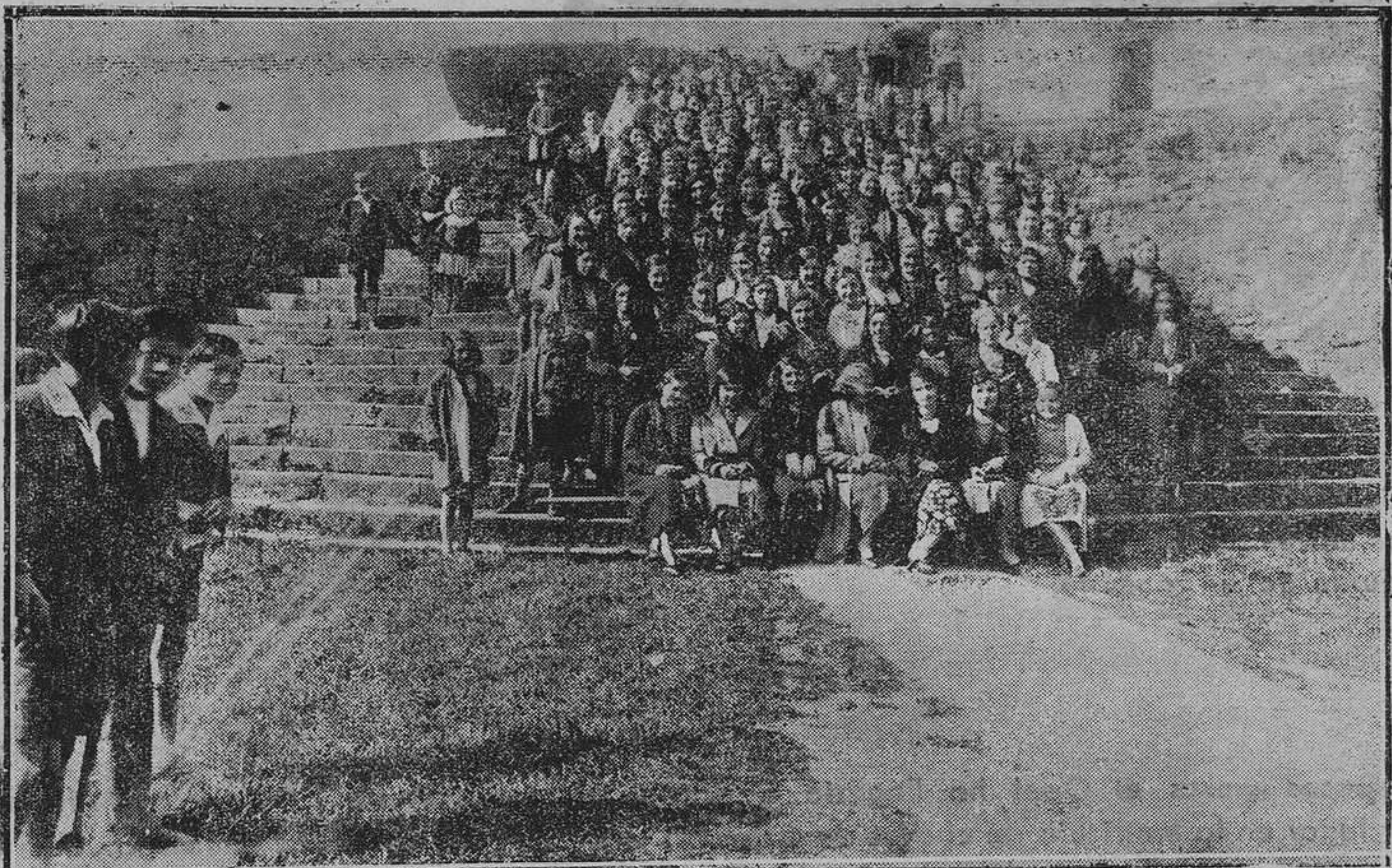
CIASO SANTA ANA.—La sección femenina de las Juventudes Católicas después de la comunión general, celebrada el domingo último.