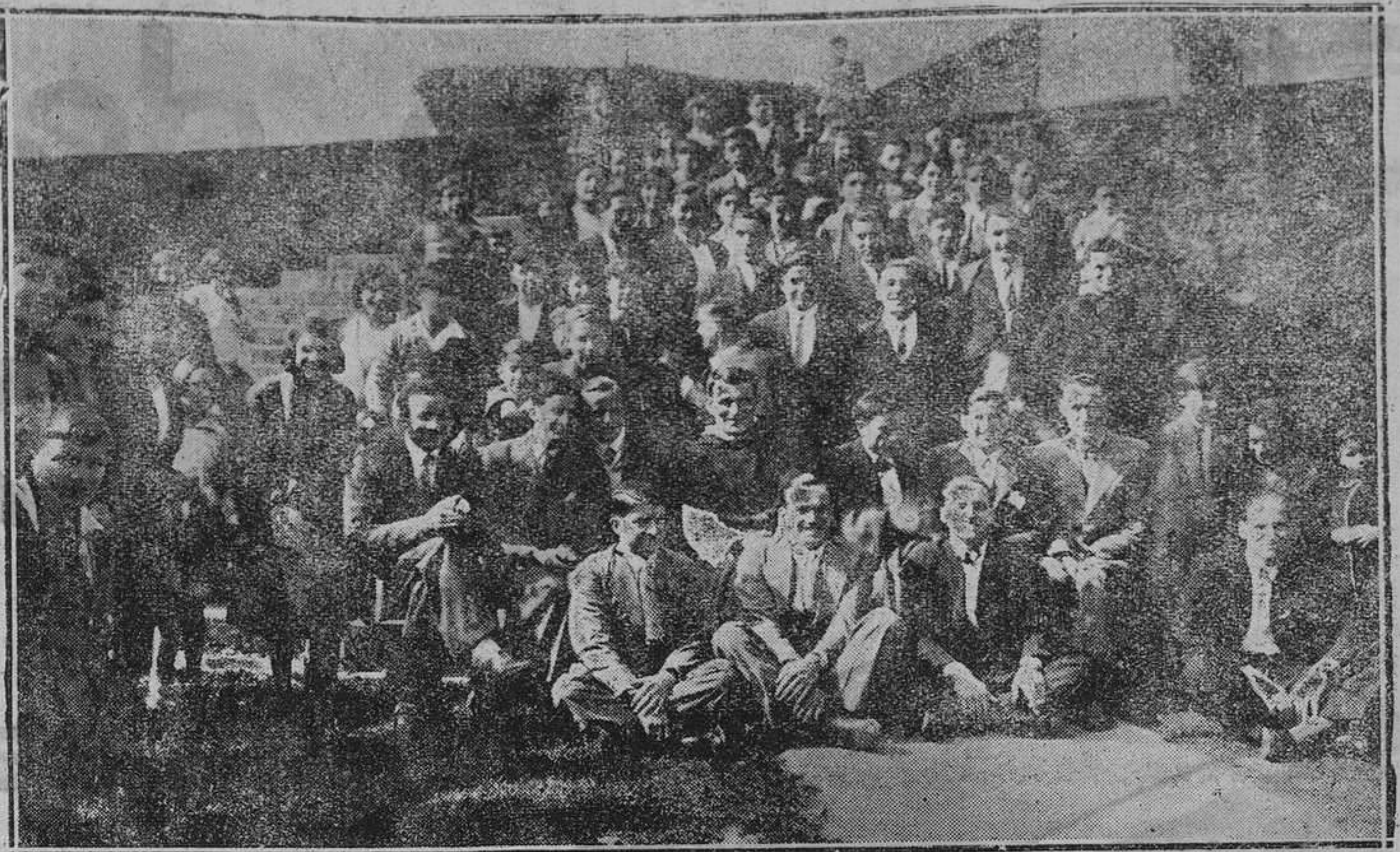
CIASO SANTA ANA.—La Juventud Católica de Entrego después de su comunión general.

y los maestros normales procedentes de la suprimida escuela de Estudios Superiores del Magisterio. En el plazo improrrogable de veinte días, a contar del 12, quienes aspiren a ser admitidos como opositores, presentarán sus instancias en el Ministerio de Instrucción pública, acompañadas de la documentación que acredite reunir las condiciones antes citadas y de la certificación del Registro de penados los que no estén en la actualidad en el servicio activo de la enseñanza. Harán asimismo entrega de cincuenta pesetas en la habilitación del Ministerio para cubrir los gastos recibiendo un recibo que se habrá de presentar en el mismo plazo de los veinte días concedidos en el Registro general del Ministerio. Los maestros nacionales acompañarán una memoria explicativa de su labor en la enseñanza primaria y uno o varios informes de la Inspección profesional que bajo su responsabilidad de testimonio de los extremos que comprenda la memoria. Se podrán presentar también los trabajos que deseen sean tenidos en cuenta. Terminados los ejercicios, el tribunal formará la lista de aspirantes por orden de méritos debiendo abstenerse de incluir mayor número que el de plazas anunciadas, no pudiendo formularse reclamación alguna de derecho por la aprobación de alguna o algunas de las partes de estas oposiciones.