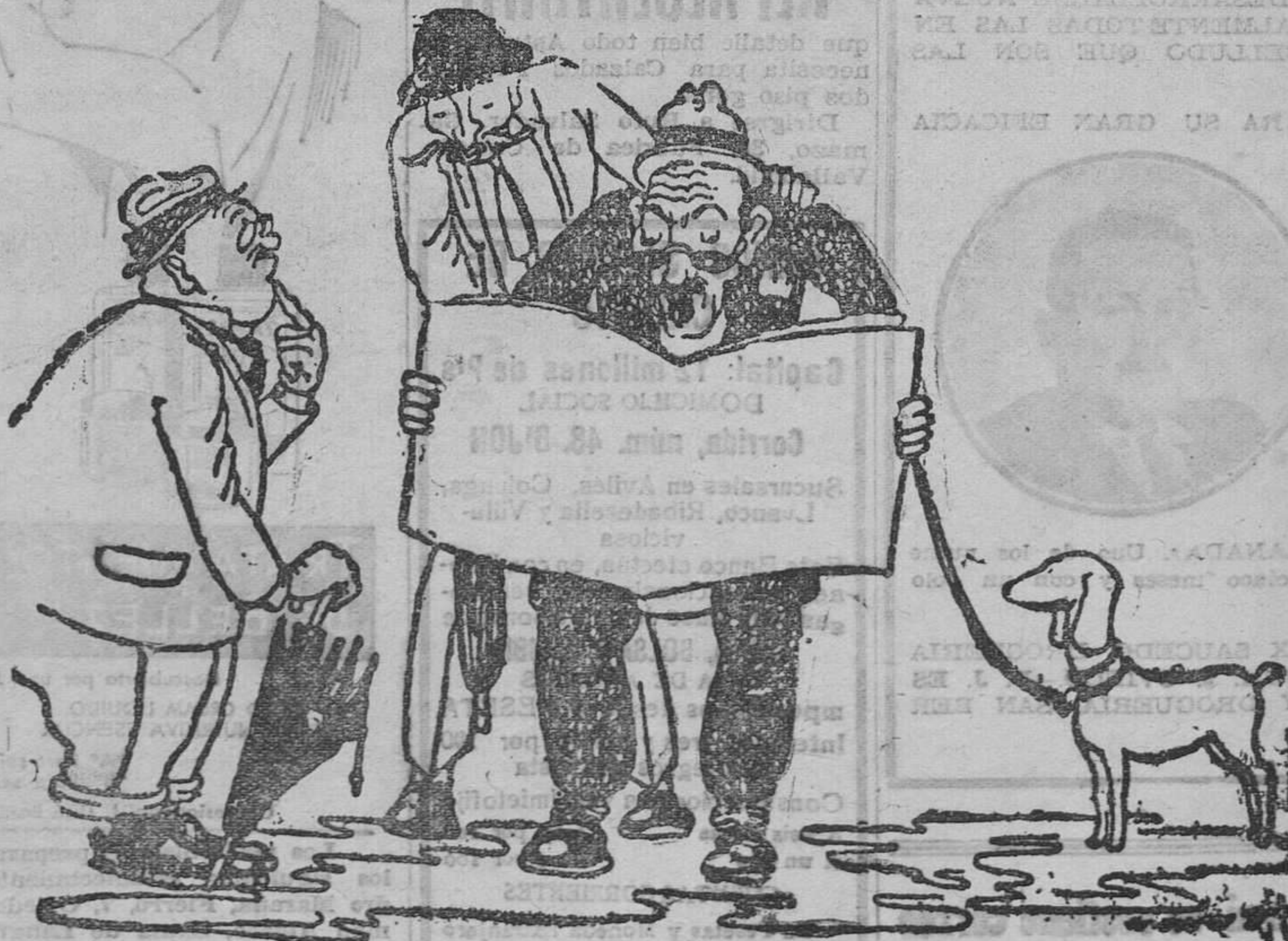
ENSALADA RUZA.—El general Xung-Xing-Sang ataca a Tsing-Tsonc-Tsonc, que se retira a Man-Esine-Xong, protegido por Xang-Tson-Man, y parece bloqueará a Non-Tien-Tshu.