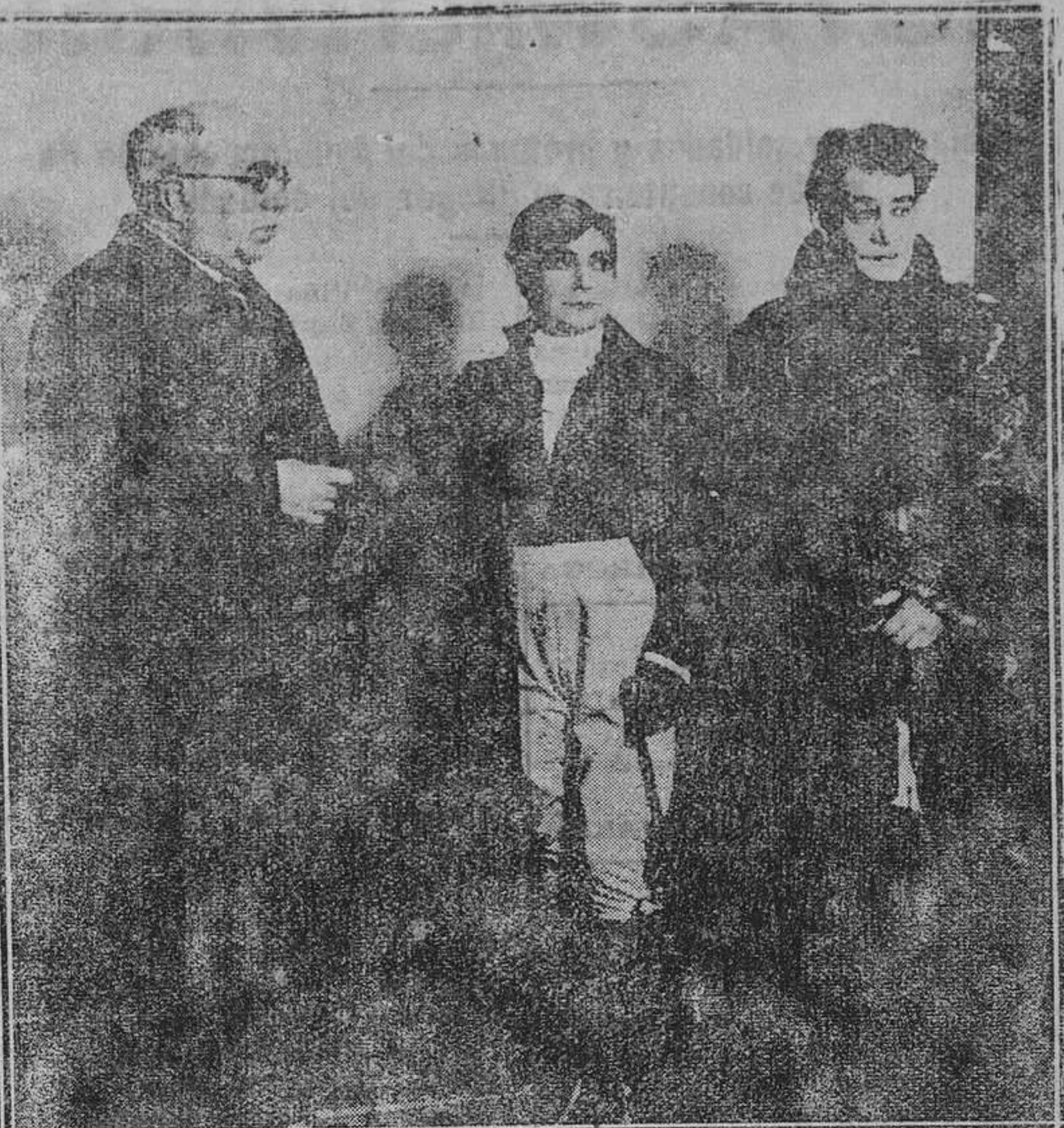
MADRID.—El jefe del Gobierno, don Manuel Azafia, con Margarita Xirgu y Alfonso Muñoz, principales intérpretes de su drama "La Corona", que se estrenó en Madrid.

Esta revancha dará comienzo a las tres de la tarde, y en cuanto al posible vencedor, nos abstendremos por completo de hacer profecías.