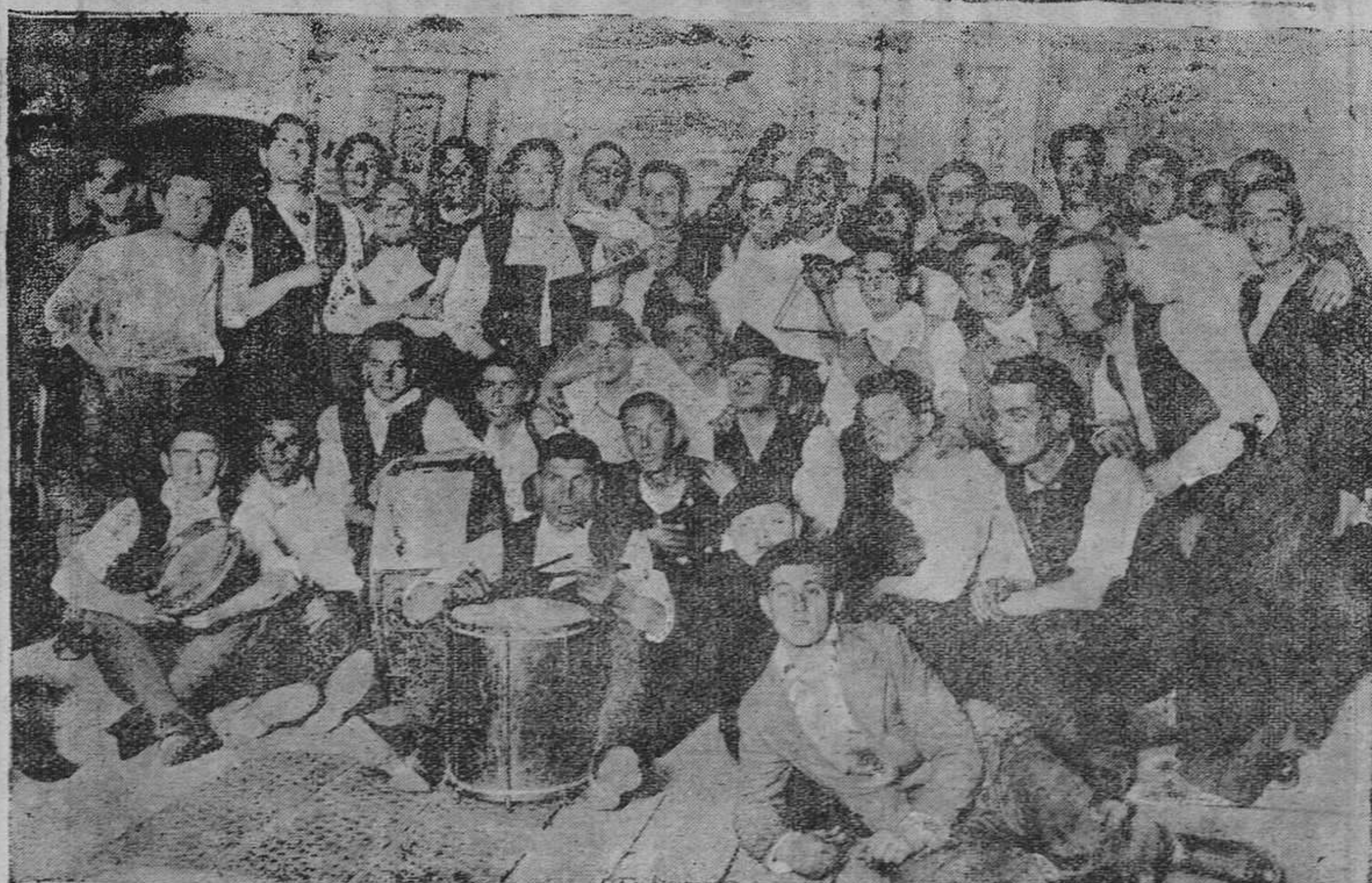
OVIEDO.—En festival de ayer en el Campoamor. El improvisado coro gallego "Os barulleiros do Reximento". (Foto Mendia).

El lesionado fué curado de varias heridas en distintas partes del cuerpo, de pronóstico grave.