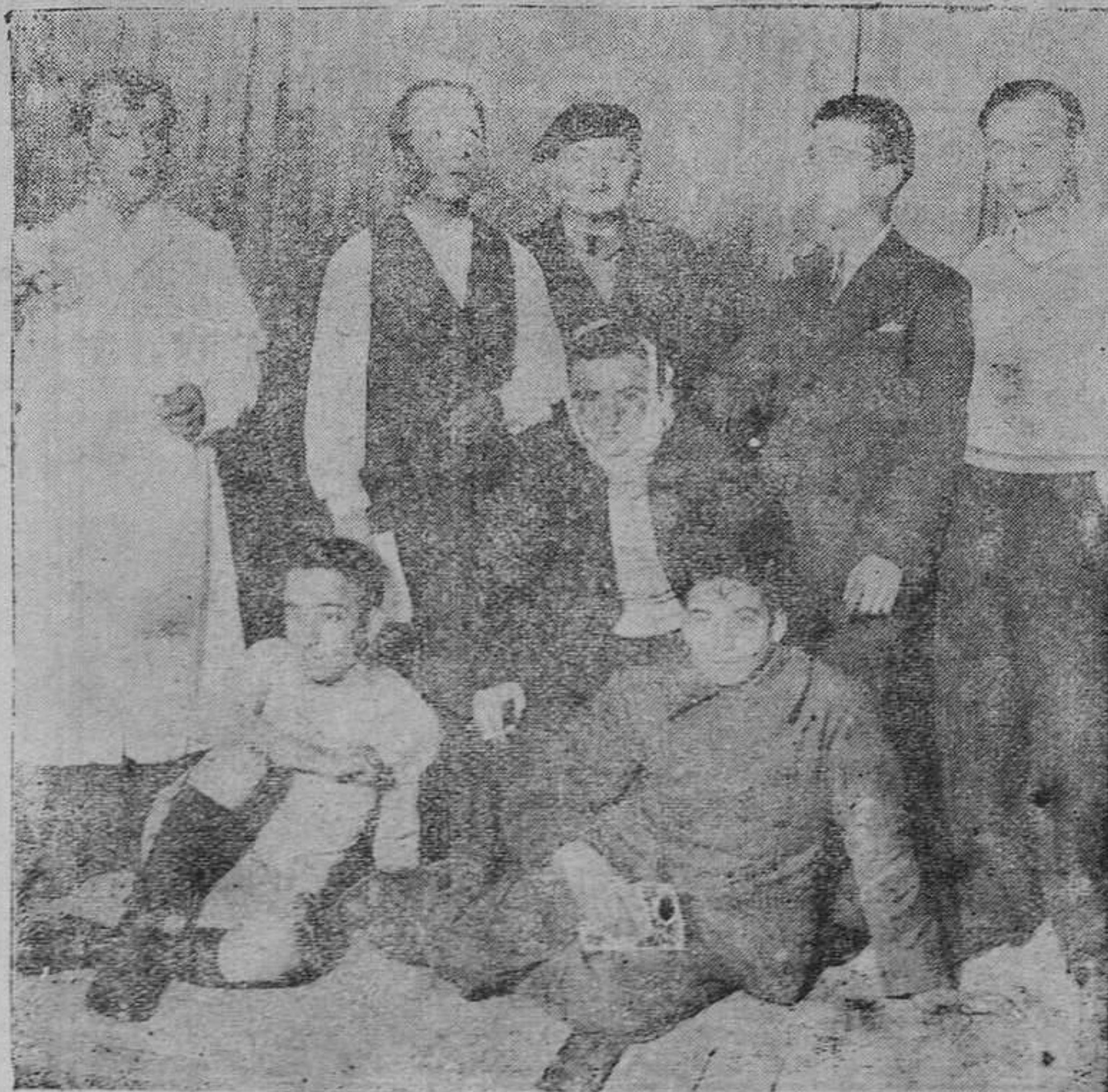
OVIEDO.—El festival de ayer en el Campoamor. Soldados del Regimiento número 3, que interpretaron su danza típica.