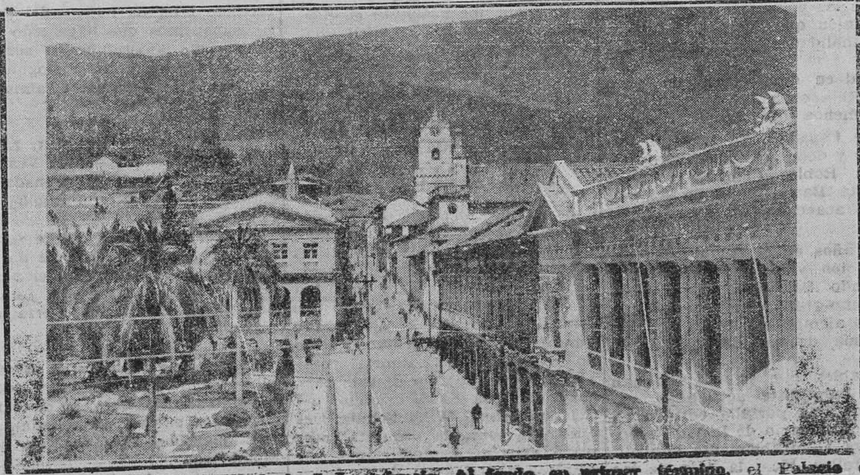
QUITO.—EQUADOR.—Parque de la Independencia. Al fondo, en primer término, el Palacio del Gobierno. A la derecha, iglesia de la Mercaderes, fundada en el año 1564